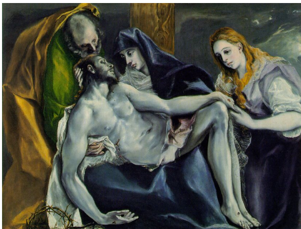
Ελ Γκρέκο: «Η αποκαθήλωση του Ιησού»

Η επαφή της καλλιτεχνικής παράδοσης της Κρήτης με τον πολιτισμό των Βενετών οδήγησε σε μία ιδιαίτερη μορφή τέχνης κατά την διάρκεια της ενετοκρατίας. Δημιουργούνται σπουδαία έργα ζωγραφικής και αναδεικνύονται σημαντικοί ζωγράφοι, όπως ο Δομίνικος Θεοτοκόπουλος ή Ελ Γκρέκο (1541 - 1614) και ο Μιχαήλ Δαμασκηνός (αρχές - τέλη 16ου αιώνα).