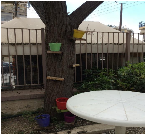
Ένας κορμός δέντρου...