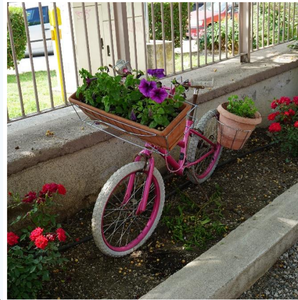
Μια όμορφη γωνιά!