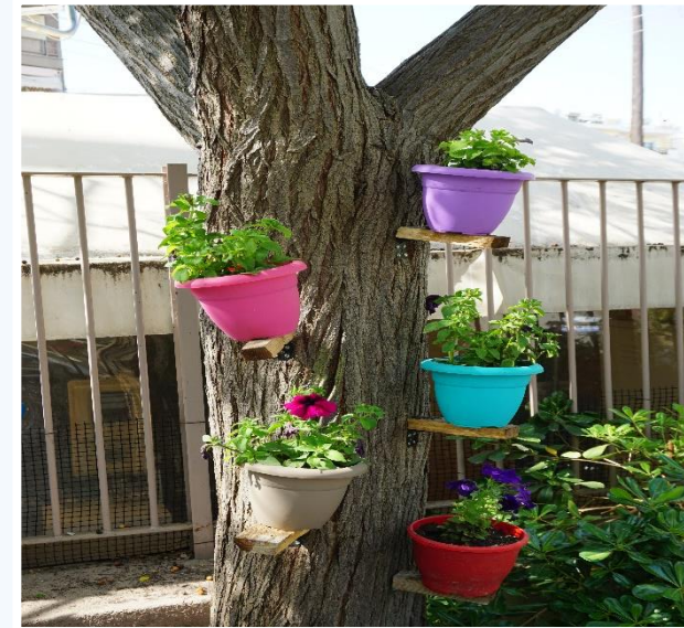
... γίνεται κρεμαστός κήπος!