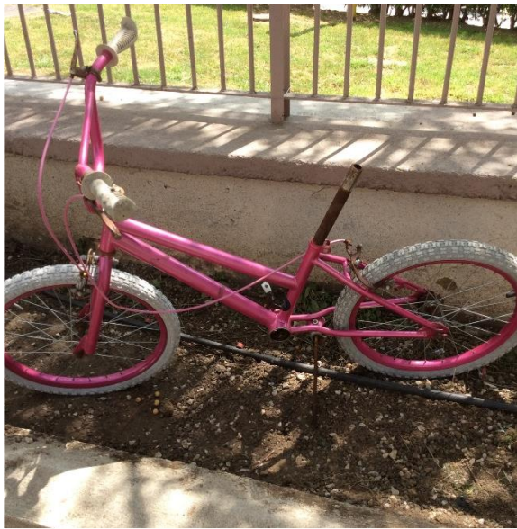
Ένα παιδικό ποδήλατο