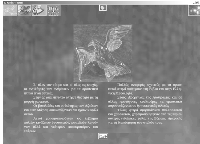
Εικόνα 2: Αρχική φόρμα Αετού

Στις εικόνες 3, 4 και 5 φαίνονται οι φόρμες του αστερισμού του Αετού. Επάνω δεξιά υπάρχει το πλήκτρο επιστροφής στη βασική φόρμα (στο χάρτη αστερισμών). Επάνω στο μέσον υπάρχει το πλήκτρο έναρξης-παύσης της σχετικής αφήγησης. Κάτω στο μέσον υπάρχει το πλήκτρο που οδηγεί στη φόρμα με τη δραστηριότητα-παιχνίδι της συναρμολόγησης του σχήματος του αστερισμού.