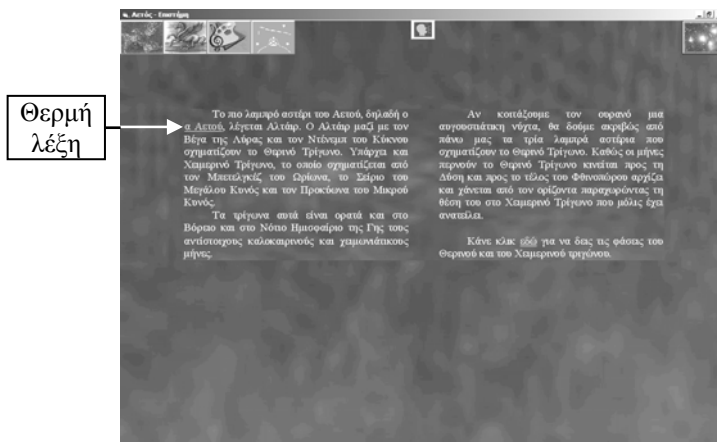
Εικόνα 5: Φόρμα επιστήμης Αετού

Όπως βλέπουμε στις εικόνες 2-5, τα πλήκτρα πλοήγησης καθώς και το πλήκτρο επιστροφής στη φόρμα με το χάρτη των αστερισμών βρίσκονται στις ίδιες θέσεις σε όλες τις φόρμες, γεγονός που διευκολύνει την πλοήγηση στην εφαρμογή. Βλέπουμε επίσης ότι σε κάθε φόρμα είναι ανενεργό το πλήκτρο πλοήγησης που οδηγεί σ' αυτήν την ίδια φόρμα και ενεργά όλα τα υπόλοιπα.