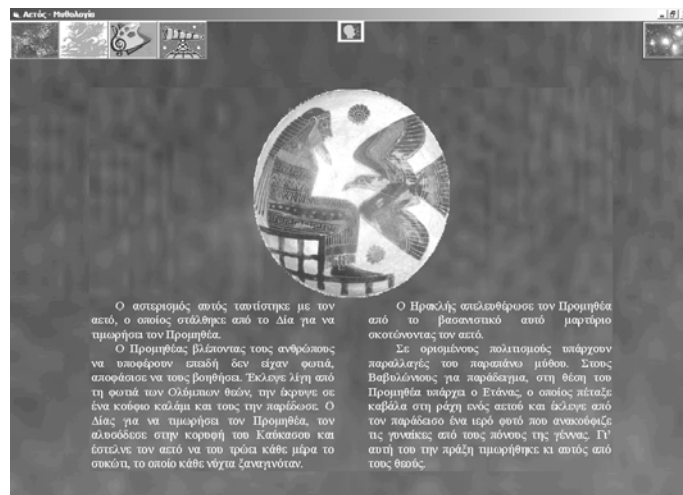
Εικόνα 3: Φόρμα μυθολογίας Αετού

Στις εικόνες 3, 4 και 5 φαίνονται οι φόρμες του αστερισμού του Αετού. Επάνω δεξιά υπάρχει το πλήκτρο επιστροφής στη βασική φόρμα (στο χάρτη αστερισμών). Επάνω στο μέσον υπάρχει το πλήκτρο έναρξης-παύσης της σχετικής αφήγησης. Κάτω στο μέσον υπάρχει το πλήκτρο που οδηγεί στη φόρμα με τη δραστηριότητα-παιχνίδι της συναρμολόγησης του σχήματος του αστερισμού.