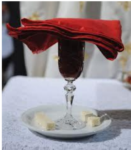
Το κοινό ποτήριο.

Το κοινό ποτήριο: θυμίζει ότι κάποτε το Μυστήριο του γάμου γινόταν μαζί με την Θεία Ευχαριστία και ότι οι νεόνυμφοι μεταλάμβαναν. Υπενθυμίζει επίσης ότι οι σύζυγοι θα έχουν πλέον κοινή συμμετοχή στις χαρές και στις λύπες 35 .