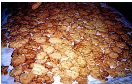
Παραδοσιακό κουλούρι Κιμώλου.

το κουλούρι του γάμου στο τέλος της βραδιάς. Όταν πάνε στο σπίτι τραγουδούν την καληνυχτιά 45 .