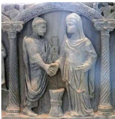
Ο γάμος στη ρωμαϊκή εποχή.

Στην Παλαιά Διαθήκη ο Θεός παρουσιάζεται να θεμελιώνει και να ευλογεί τον γάμο, καθώς προτρέπει τους πρωτόπλαστους να ολοκληρωθούν δια της αγαπητικής σχέσης. Παρά το γεγονός ότι ο γάμος τυγχάνει ιδιαίτερης τιμής στην Παλαιά Διαθήκη, είναι χαρακτηριστικό ότι δεν είχε θρησκευτικό ή δημόσιο χαρακτήρα, αλλά αποτελούσε ιδιωτική υπόθεση των οικογενειών από τις οποίες προέρχονταν οι σύζυγοι 4 . Ο γάμος στη Παλαιά Διαθήκη κρατούσε 7 ή 14 μέρες με πλούσια δείπνα και διασκεδάσεις 5 . Στο τελετουργικό μαρτυρείται όμως η σύνταξη του γαμήλιου συμβολαίου, τα στέφανα και η παράδοση και οι λόγοι της ευλογίας που δίνονταν στους νεόνυμφους από τους γονείς 6 .