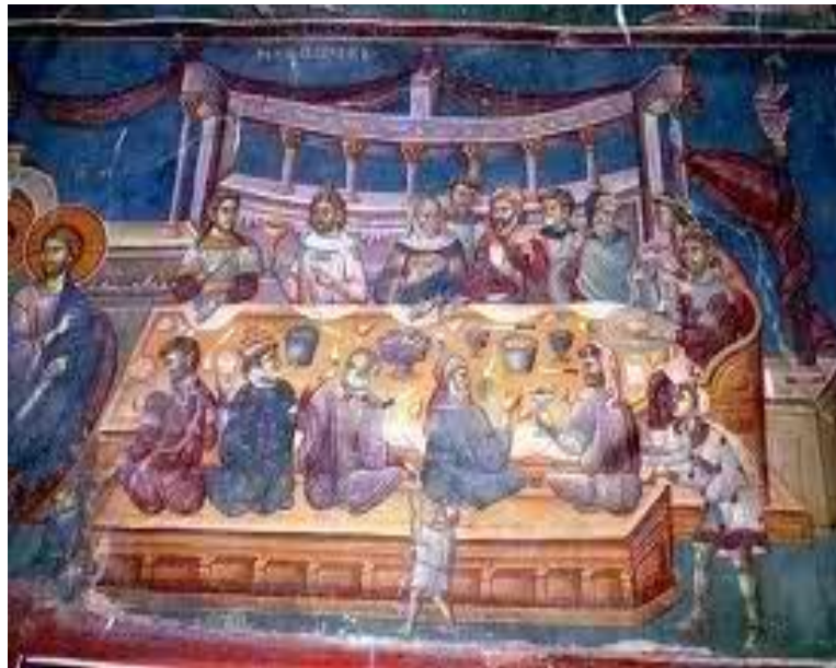
Το Μυστήριο του γάμου είναι άμεσα συνδεδεμένο με την Θεία Ευχαριστία.

κρατικός θεσμός. Είναι ένα γεγονός όπου ο άνθρωπος δεν πορεύεται μόνος του, αλλά ενεργεί σε συνεργασία με τον Θεό. Με τον εκκλησιαστικό γάμο έχουμε την ένωση των δύο φύλων δια της ευλογίας του Θεού με την Θεία Λειτουργία, ενώ εκπληρώνεται και ο πρωταρχικός προορισμός και λόγος της δημιουργίας του ανθρώπου 12 . Ο γάμος είναι ένας θεσμός που πάντοτε είχε μυστηριακό χαρακτήρα.