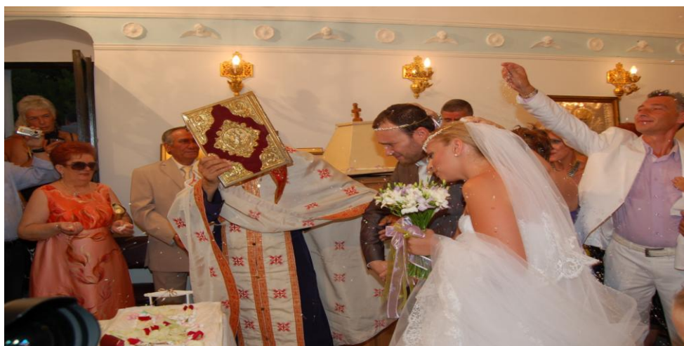
Ο χορός του Ησαΐα.

Μετά την ανάγνωση του Αποστόλου και του Ευαγγελίου συνεχίζεται η ακολουθία του γάμου που περιλαμβάνει την εκτενή ικεσία, τα πληρωτικά, την Κυριακή προσευχή και τη μετάληψη από το γαμήλιο ζευγάρι του ευλογημένου κρασιού που περιέχει το κοινό ποτήριο και μας υπενθυμίζει έντονα το γεγονός ότι αυτή η ακολουθία κατανοήθηκε από την Εκκλησία ως Ευχαριστιακή λειτουργία 29 . Ύστερα από την μετάληψη του κρασιού από το κοινό ποτήριο ο ιερέας ενώνει τα δεξιά χέρια του γαμπρού και της νύφης και τους οδηγεί τρεις φορές σε κυκλική πορεία γύρω από το τραπέζι της τελέσεως του γάμου.