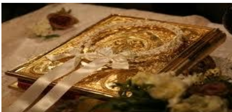
Τα στέφανα σύμβολά της Βασιλείας του Θεού.

Ο γάμος είναι ένα Μυστήριο, που οδηγεί στη Βασιλεία του Θεού. Η αμοιβαία αγάπη και ο άγιος έρωτας, που νοιώθει κάποιος για το άλλο φύλο, με την Χάρη του Αγίου Πνεύματος, μεταμορφώνεται σε μια αδιάσπαστη ένωση έτσι ώστε ο ιερός Χρυσόστομος να ορίζει το Γάμο ως: "Μυστήριο της αγάπης" 18 . Γι' αυτό και ο αληθινά χριστιανικός γάμος είναι ισόβιος. Η εκκλησία καθόρισε τη σχέση μεταξύ ανδρός και γυναίκας. Η αγάπη μεταξύ των χριστιανών που παντρεύονται οδηγεί στην κατάκτηση του επάθλου που δεν είναι άλλο από τη συμμετοχή τους στη θέωση, όπου θα στεφανωθούν με τα άφθαρτα στέφανα της Βασιλείας του Θεού 19 . Γι' αυτό και τα στέφανα όπως και τις λαμπάδες, οι ορθόδοξοι τα φυλάσσουν στα εικονοστάσια των σπιτιών τους.