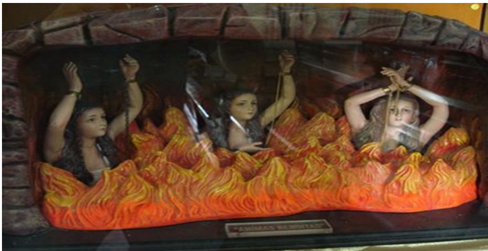
Το Καθατήριο Πυρ. Η μέση κατάσταση των Ρωμαιοκαθολικών.

Πάπας μπορούσε από το πλεόνασμα της αγιότητας να συγχωρεί με το αζημίωτο.