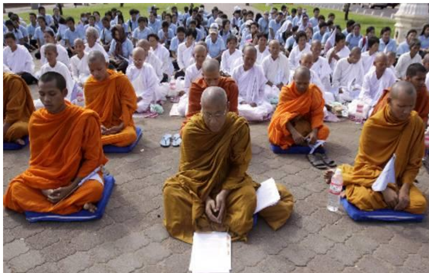
Στο Βουδισμό μόνο οι μοναχοί μπορούν να φτάσουν στο νιρβάνα.

διάνοιες των ανθρώπων θα γίνουν τόσο καθαρές όσο το κρύσταλλο... Ως επακόλουθο θα έρθει η Sat ή το Krta Yuga (χρυσή εποχή)» 36 .