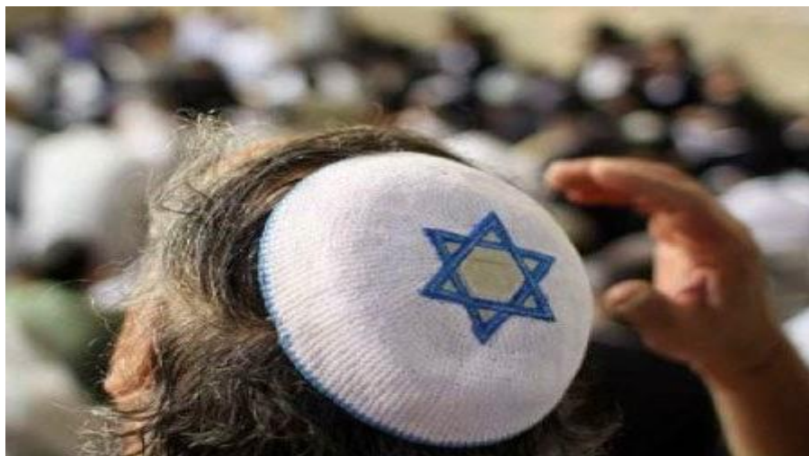
Η σωτηριολογία των Εβραίων.

τιμωρία, απλώς οι ψυχές διατηρούνται αναλλοίωτες. Στην Τορά ο άνθρωπος νοείται ως ψυχοσωματική οντότητα. Ταυτόχρονα στην εβραϊκή εσχατολογία υπάρχει η προσδοκία του επερχόμενου Μεσσία κυρίως στην εποχή της Κ. Διαθήκης.