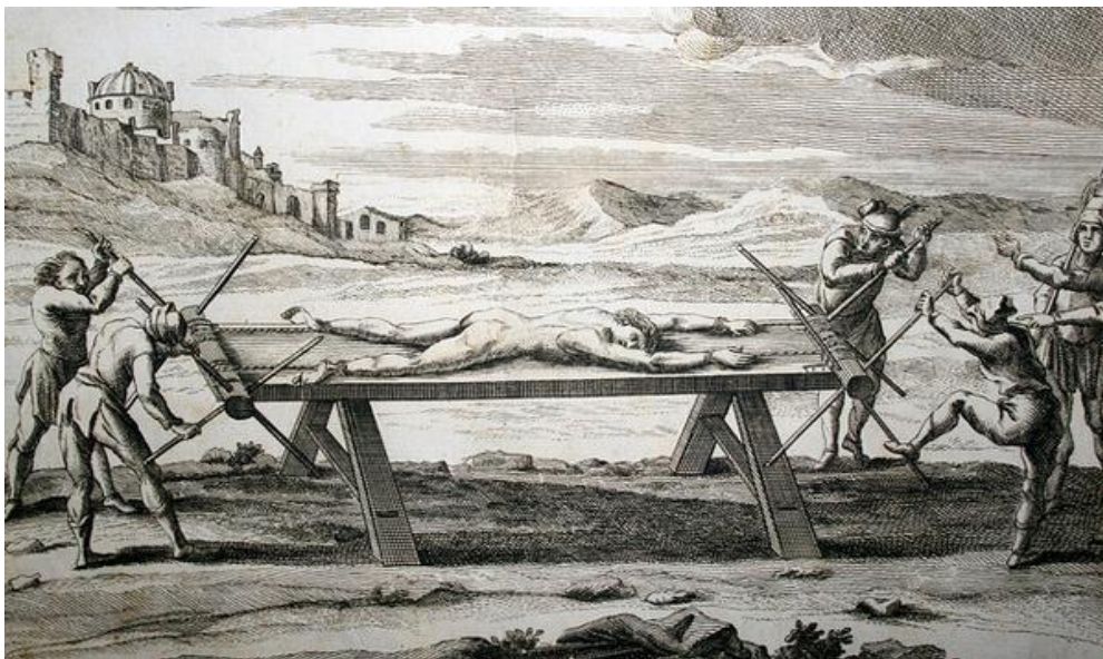
Τα μεσαιωνικά βασανιστήρια συνδέονταν με την κάθαρση της ψυχής.

βασανισμό και τη βίαιη εκτέλεση του ένοχου, προσπαθούσαν αφενός να κατευνάσουν τον «προσβεβλημένο Θεό» και αφετέρου να προσφέρουν στην ψυχή του εγκληματία την αιώνια ζωή. Εξάλλου, ήταν εξαιρετικά διαδεδομένη η άποψη πως ο σωματικός πόνος διαθέτει καθαρικές ιδιότητες. Γι' αυτό και, σύμφωνα με τον Σιλντ, πολλοί εγκληματίες συναινούσαν στο μαρτύριο, για να αποδείξουν τη θρησκευτική τους ακεραιότητα και να εξασφαλίσουν τη μετάβασή τους στη μεταθανάτια ζωή 56 .