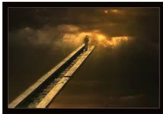
Η προσμονή του Παραδείσου

Στην Αγία Γραφή υπάρχουν πολλά χωρία πού βεβαιώνουν ότι οι ψυχές ζουν μετά θάνατον. Στην Παλαιά Διαθήκη αναφέρεται ότι «ό Αβραάμ απέθανε και προσετέθη τω λαώ αυτού» (Γεν. 25, 4), δηλαδή στους δίκαιους προγόνους του 10 . Ο τετραήμερος Λάζαρος, η θυγατέρα του Ιαείρου, ο γιός της χήρας της Ναΐν, όλων αυτών οι ψυχές επέστρεψαν στα αντίστοιχα σώματά τους με το λόγο του Χριστού. Και ο Απόστολος Παύλος, ο οποίος επιθυμούσε διακαώς «ἀναλῦσαι καί σύν Χριστῶ εἶναι» (Φιλιπ. 1, 23), δηλαδή είχε πόθο να εκδημήσει απ' αυτή τη ζωή και να ζει με τον Χριστό στη Βασιλεία Του, μας πιστοποιεί ότι οι ψυχές ζουν μετά το θάνατο 11 .