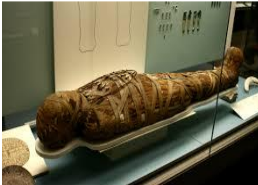
Αιγυπτιακή μούμια τυλιγμένη με επιδέσμους.

Η ταρίχευση ήταν ένα πολύ σημαντικό ζήτημα για τους Αιγύπτιους γι' αυτό οι τεχνίτες της κατείχαν εξουσία και ήταν πολύ σεβαστοί από τον λαό. Ήξεραν άριστα την ανατομία του ανθρώπινου σώματος όπως επίσης και διάφορα ξόρκια. Τα βασικά υλικά για την διαδικασία της ταρίχευσης είναι τα εξής: άσφαλτος, πίσσα, ρετσίνι, αρωματικό λάδι. Αρχικά, άλειφαν το σώμα με τα παραπάνω υλικά. Ύστερα αφαιρούσαν τα εντόσθια, την καρδιά και τον πνεύμονα. Τα εντόσθια τα διατηρούσαν στα κανωβικά αγγεία, τα οποία ήταν τέσσερα δοχεία γεμισμένα με άλμη 44 . Έπειτα το σώμα πλενόταν εσωτερικά με άσφαλτο, ρητίνες, αρώματα, σόδα, μύρα τοποθετούνταν σε άλμη για περίπου 55 μέρες.