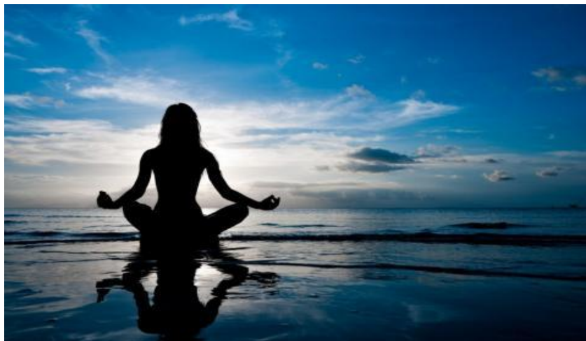
Ο διαλογισμός αποτελεί μέσο ένωσης με την θείκη ύπαρξη.

Γιόγκα σημαίνει «ζεύξη» δηλαδή ένωση. Η Γιόγκα διακρίνεται ανάλογα με τα μέσα που χρησιμοποιούνται για την ένωση με το θείο σε: «Γιόγκα της γνώσης» τζνάνα γιόγκα. Ως μέσον έχει την απλή γνώση του Άτμαν από το νου. «Γιόγκα της αγαπητικής αφοσίωσης» μπάκτι γιόγκα. Προϋποθέτει τη θεώρηση του Θεού ως προσωπικού, κι ως μέσον έχει την αγάπη προς αυτόν. «Γιόγκα των πράξεων» κάρμα γιόγκα. Ως μέσο έχει τις καλές πράξεις προς τον κόσμο με τις οποίες ο νους στρέφεται από το ατομικό εγώ προς τον Θεό. Βασική τεχνική της γιόγκα είναι ο διαλογισμός που συνίσταται στο να ξεκολλήσει ο νους από τις διάφορες σκέψεις, αφού με αυτές ταυτίζεται με τα αντικείμενα στα οποία αναφέρονται κι άρα με τον κόσμο των φαινομένων 35 .