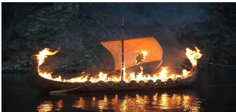
Η φλεγόμενη βάρκα των Βίκινγκς.

Αντίθετα, οι εύποροι Βίκινγκς διάλεγαν να έχουν έναν ακόμα πιο εντυπωσιακό τάφο, ένα καράβι άλλοτε φλεγόμενο και άλλοτε καταδικασμένο να ταξιδεύει στην απέραντη θάλασσα για πάντα. Γεμάτο τροφή, πολύτιμα αντικείμενα, ζώα ή σε εξαιρετικές περιπτώσεις τους υπηρέτες τους 53 . Τα σημάδια-μηνύματα είναι εμφανή, πίστευαν στη μεταθανάτια ζωή και είχαν την υπέρτατη θέληση να φτάσουν στον ύψιστο προορισμό Βαλχάλα ή αίθουσα του Οντίν 54 .