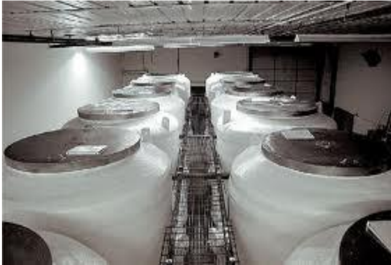
Η επιστήμη της κρυογονικής.

δύσκολο να σκαφτεί. Το σώμα του νεκρού αναμειγνύεται με αλεύρι και γάλα ώστε οι γύπες να μην αφήσουν κανένα κομμάτι στη γη 60 .