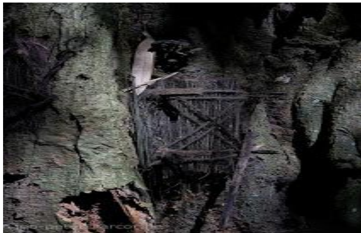
Ταφές στα δέντρα.

Όσο προχωράει κανείς στην έρευνα διαπιστώνει ότι οι άνθρωποι έδιναν μεγάλη σημασία, εκτός από την μεταθανάτια ζωή, και στο που θα καταλήξει το άψυχο σώμα. Όμως στην πραγματικότητα αυτά τα δύο είναι άμεσα επηρεασμένα το ένα από το άλλο. Αν πάρει κανείς ως παράδειγμα τους Αιγύπτιους που αναφερθήκαν παραπάνω καταλαβαίνει και πρακτικά τη σύνδεσή τους. Όπως στην αρχαιότητα έτσι και στον Μεσαίωνα υπάρχουν και οι ξεχωριστά ιδιαίτερες ταφές όπως αυτές των ιθαγενών, των Βίκινγκς αλλά και των άτυχων εξερευνητών, καθώς και μια σειρά από καθαρούς και βασανιστήρια.