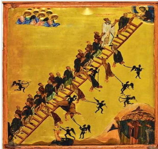
Η κλίμαξ, η οποία συμβολικά οδηγεί προς τα έσχατα.

Στην αναζήτηση του παραδείσου είναι λάθος να γίνεται λόγος για μια επιστροφή σ' ένα χαμένο παράδεισο του παρελθόντος 1 . Αντίθετα η θέωση έχει προοδευτικό και εξελικτικό χαρακτήρα. Δεν πρόκειται για φυσική αλλά για θεϊκή αθανασία, η οποία δεν είναι μια απλή επιβίωση του ανθρώπου ως έχει σήμερα, αλλά για δοξασμό, εκλάμπρυνση, θέα και γλυκασμό 2 . Ο άνθρωπος ενώνεται με τις άκτιστες ενέργειες του Θεού, όχι με την θεϊκή ουσία, απολαμβάνοντας συνεχώς την αφθαρσία του Θεού. Μέσα σ' αυτό το πλαίσιο δίκαιοι και άδικοι μπορούν να φτάσουν στη θέωση αρκεί να το θελήσουν. Κανείς δεν εξαιρείται από την Βασιλεία του Θεού και κυρίως οι ανεπαρκείς(αμαρτωλοί).