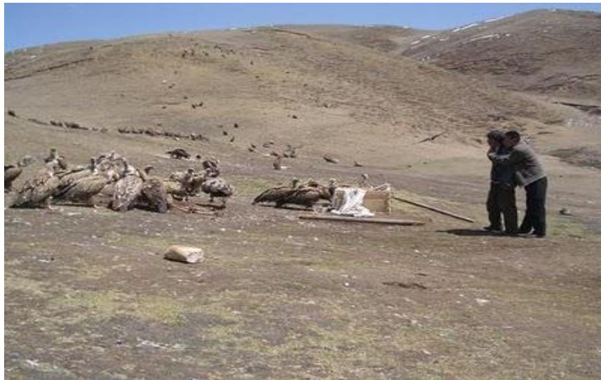
Η ταφή στον αέρα.

ημέρα, ο μήνας και το έτος θα έχουν μικρότερη διάρκεια και οι άνθρωποι θα γίνουν φαύλοι. Μετά από μια μάχη μεταξύ των καλών και των κακών θα συμβεί η τελική κρίση, οπότε και οι κακοί θα τιμωρηθούν για τρεις ημέρες αλλά τελικά θα συγχωρεθούν 58 . Ταφικά έθιμα δεν υπάρχουν, καθώς πιστεύεται ότι το σώμα είναι ακάθαρμο και δεν πρέπει να μολύνει τον κόσμο μετά τον θάνατο. Γι' αυτό τα πτώματα τα μεταφέρουν στον «Πύργο της σιωπής», όπου αφήνονται εκτεθειμένα μέχρι να αποσυντεθούν, τότε πάνε και συλλέγουν τα κόκαλα με σκοπό να τα εξαφανίσουν εντελώς διαλύοντάς τα σε ασβέστη 59 .