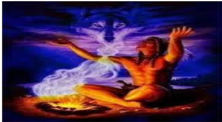
Η πίστη στα πνεύματα των προγόνων.

Ο ανιμισμός πρόκειται για την αρχαιότερη θρησκευτική και λατρευτική πρακτική της ανθρωπότητας. Η βασική ιδεολογία του ανιμισμού είναι η άποψη πως υπάρχει ένα πνευματικό βασίλειο το οποίο μοιράζονται οι άνθρωποι με το σύμπαν, συνεπώς κατέχει κυρίαρχη θέση και η άποψη, σύμφωνα με την οποία οι άνθρωποι, τα ζώα, τα φυτά και τα ουράνια σώματα κατέχουν ψυχή ανεξάρτητη από τη φυσική ύπαρξη 41 . Κάποιοι πιστεύουν πως οι ψυχές των ανθρώπων υπάρχουν πριν, ακόμα και μετά τον θάνατο του σώματος, ενώ αυτές των ζώων και των φυτών δεν «πεθαίνουν» ποτέ.