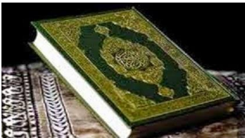
Το Κοράνι και η εσχατολογία του.

Στον παράδεισο, τον πιστό περιμένουν υλικές απολαύσεις: οι κήποι της Εδέμ με σκιερά δέντρα γεμάτα καρπούς, μαλακά μαξιλάρια, καθαρές πηγές, κρασί που δεν ζαλίζει, καθώς και η παρέα ντροπαλών παρθένων, νεαρών αγοριών αλλά και των πατέρων, των γυναικών και των απογόνων των πιστών. Χαρακτηριστικό είναι το απόσπασμα απ' την σούρα Αυτό που έρχεται : Θα είναι ξαπλωμένοι αντικριστά πάνω σε μαξιλάρια στολισμένα με πετράδια και θα τους σερβίρουν αθάνατοι νέοι με κούπες και κύπελλα από το αγνότερο κρασί (από αυτό που ποτέ δεν θα φέρει πόνο στο κεφάλι τους ούτε θα τους ζαλίζει), με φρούτα που αυτοί θα διαλέγουν και σάρκα πουλερικών που θα απολαμβάνουν 29 .