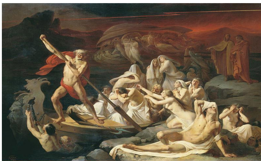
Ο Χάρωντας και η βάρκα με τις ψυχές.

Πολλά κείμενα μυθολογικά ή μη αναφέρονται σε ανθρώπους που προσπάθησαν να νικήσουν το θάνατο, να φτάσουν στον Άδη και να γυρίσουν πίσω έχοντας μαζί αγαπημένα τους πρόσωπα, που είχαν πεθάνει. Ο Ορφέας είχε κατέβει ζωντανός στον Άδη για να πάρει πίσω την αγαπημένη του νεκρή Ευρυδίκη, ή μάλλον την σκιά της, γιατί η Ευρυδίκη ήταν μαζί του στον πάνω κόσμο, δηλαδή ήταν μαζί του το πτώμα της. Και ο Ηρακλής μαινόμενος είχε κατέβει ζωντανός στον Άδη με την ελπίδα να νικήσει τον θάνατο. Ακόμη και ο Οδυσσέας, το αρχέτυπο των απανταχού εξερευνητών, κατέβηκε στον κάτω κόσμο για να μιλήσει με τις σκιές και τον νεκρό Τειρεσία. Τονίζοντας ιδιαίτερα την απελπισία που φέρνει ο θάνατος στους ανθρώπους και τον διαρκή αγώνα της ανθρωπότητας να τον υπερνικήσει σ' όλες τις εποχές 47 .