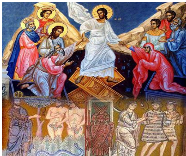
Ἡ ἀνάστασις του Χριστοῦ ἀποτελεῖ τὴ νίκη κατὰ τῆς φθορᾶς και του θανάτου.

διακρίνουν από τούς άλλους ανθρώπους: «Εἰ γὰρ καὶ χωρίζεται ἡ ψυχὴ τοῦ ἀνθρώπου ἐν τῷ θανάτῳ, ἀλλ' ἡ ὑπόστασις ἀμφοτέρων μία καὶ ἡ αὐτὴ ἐστίν· μένει τό τε σῶμα καὶ ἡ ψυχὴ, ἀεὶ μία τὴν ἀρχὴν τῆς ἑαυτῶν ἔχοντα ὑπάρξεώς τε καὶ ὑποστάσεως, εἰ καὶ χωρισθῶσιν ἀλλήλων» 12 . Δηλαδή αν και χωρίζεται ἡ ψυχὴ του ἀνθρώπου ἀπὸ το σῶμα του, τη στιγμή του θανάτου του, παραμένει ὁμως ἡ μία και ἡ αὐτὴ ὑπόστασις και για τα δύο. Μένει δηλαδή και το σῶμα και ἡ ψυχὴ πάντοτε ἔχοντας μία ἀρχὴ της ὑπάρξεως και ὑποστάσεώς τους.