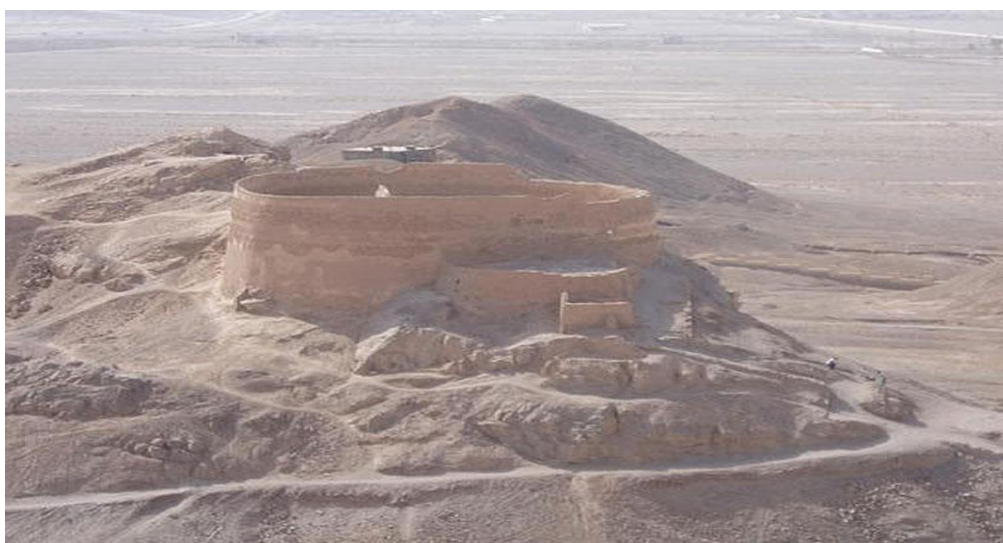
Πύργος της σιωπής στο Anjuman.

Μετά από αυτήν την ιστορική αναδρομή και φτάνοντας στη σύγχρονη εποχή συναντά κανείς αντιλήψεις που δεν απέχουν πολύ από εμάς. Στις αναπτυγμένες χώρες, κυριαρχεί η μανία της πλήρους συντήρησης του σώματος, με την ελπίδα ότι η επιστήμη θα προχωρήσει τόσο ώστε να μπορεί να ξανά δημιουργεί ζωή. Στις όχι και τόσο αναπτυγμένες χώρες και σε μικρές φυλές, υπάρχουν πιο παραδοσιακές αντιλήψεις, καθώς συνεχίζουν να επιμένουν στην άποψή τους για τον θάνατο και στους παράξενους τρόπους ταφής.