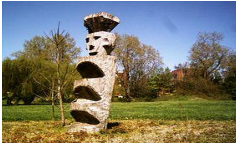
Τοτέμ. Αντικείμενο της προγονολατρίας.

Εκείνοι που πέθαναν ποτέ δεν έφυγαν: Υπάρχουν μέσα στη σκιά που γίνεται όλο και παχύτερη. Οι νεκροί δεν είναι κάτω από τη γη: Υπάρχουν στο δέντρο που θροϊίζει, υπάρχουν στο δάσος που βογγά. Υπάρχουν στο νερό που τρέχει, υπάρχουν στο νερό που κοιμάται, υπάρχουν στην καλύβα, υπάρχουν μέσα στο πλήθος. Οι νεκροί δεν είναι νεκροί. Εκείνοι που πέθαναν ποτέ δεν έφυγαν: Υπάρχουν στο στήθος της γυναίκας, υπάρχουν στο παιδί που στριγγλίζει, και στο δαυλό που φλέγεται. Οι νεκροί δεν είναι κάτω απ' τη γη: Είναι στη φωτιά που σβήνει. Είναι στα χόρτα που κλαίνει. Είναι στους βράχους που θρηνούν. Είναι στο δάσος, είναι στο σπίτι. Οι νεκροί δεν είναι νεκροί 42 .