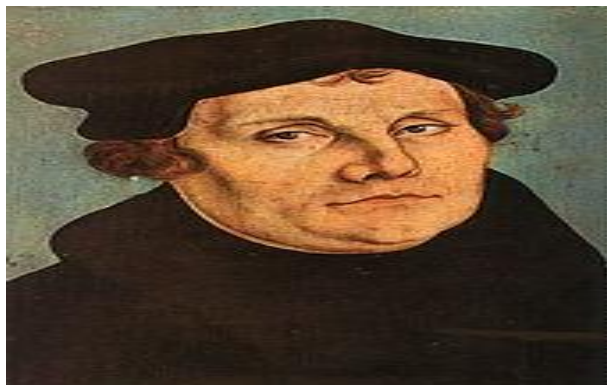
Ο Λούθηρος και η Προτεσταντική σωτηριολογία.

όλους τους Διαμαρτυρομένους θεολόγους, αλλά μόνον από τον Καλβίνο και τους οπαδούς του.