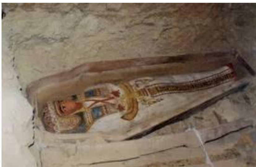
Διακοσμημένη αιγυπτιακή σαρκοφάγος.

Οι Αιγύπτιοι έδιναν πολύ προσοχή στην εμφάνιση είτε των νεκρών είτε των ζωντανών, πίστευαν ότι η ζωή δεν σταματά, απλά συνεχίζεται σε μια άλλη διάσταση γι' αυτό το λόγο το σώμα έπρεπε να συνεχίσει να είναι εξίσου καλοπεσμένο με την επίγεια ζωή. Αυτό το πετύχαιναν στολίζοντας το με πολύτιμα κοσμήματα, βάφοντας το, χτενίζοντας το και τοποθετώντας το μέσα σε μεγαλοπρεπούς σαρκοφάγους. Από ότι συμπεραίνει κανείς το σώμα ήταν αναγκαίο να παραμείνει ως έχει. Η καρδιά ήταν το σημαντικότερο όργανο αλλά και σημείο από όλο το σώμα. Για τους Αιγύπτιους εκτός από πηγή ζωής ήταν και πηγή ευφύϊας 46 .