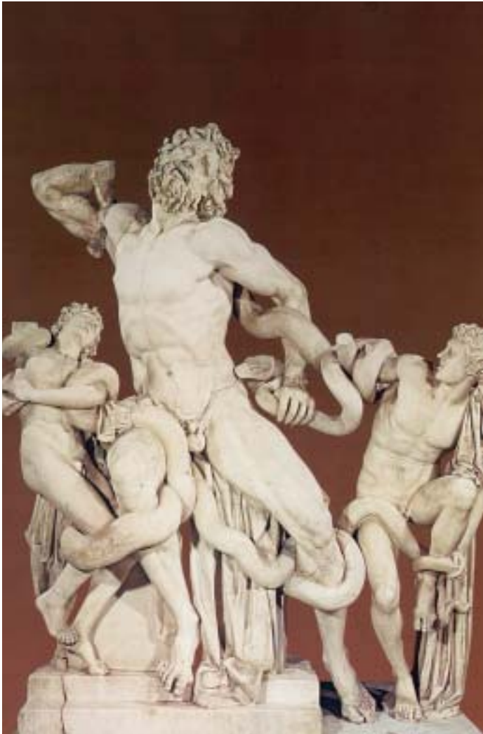
2. Ο Λαοκόοντας και οι δυο γιοί του. Αρχαίο ελληνικό γλυπτό.

Αμέσως δυο τεράστια φίδια σταλμένα από τον Ποσειδώνα, βγήκαν από τη θάλασσα κι έπνιξαν τον Λαοκόοντα μαζί με τα παιδιά του.