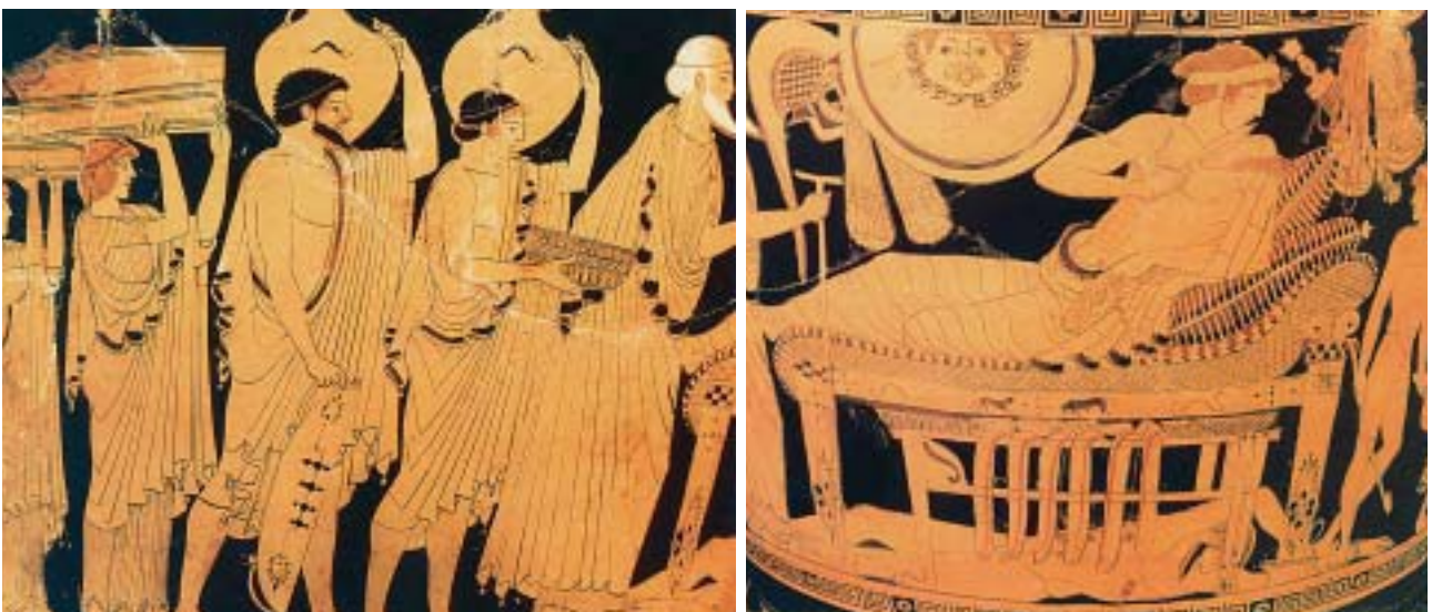
3. Ο Πρίαμος έρχεται με δώρα στη σκηνή του Αχιλλέα και τον ικετεύει. Από αρχαίο ελληνικό αγγείο.

Ο νεκρός Έκτορας έντεκα μέρες έμεινε άταφος, ώσπου ο Πρίαμος πήγε στον Αχιλλέα, έπεσε στα πόδια του και τον παρακάλεσε να του δώσει το σώμα του παιδιού του να το θάψει. Ο Αχιλλέας συγκινήθηκε. Διέταξε να πλύνουν και να στολίσουν το νεκρό και τον έδωσε στο γέρο βασιλιά, για να τον πάει στην Τροία. Και πρόσταξε να σταματήσει ο πόλεμος έντεκα μέρες, για να προλάβουνε οι Τρώες να θρηνήσουν και να κάψουν το νεκρό, όπως είχαν συνήθεια.