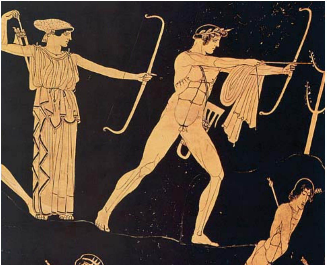
1. Ο Απόλλωνας ρίχνει τα βέλη του. Από αρχαίο ελληνικό αγγείο.

Ο Χρύσης τότε παρακάλεσε τον Απόλλωνα να τιμωρήσει σκληρά τους Αχαιούς. Ο Απόλλωνας τον άκουσε από τον Όλυμπο κι αμέσως πήρε το τόξο του και πήγε στο στρατόπεδο των Αχαιών. Κάθισε παράμερα και αόρατος χτυπούσε με τα βέλη του τα ζώα και τους ανθρώπους. Έπεσε τότε αρρώστια φοβερή ανάμεσά τους και πέθαιναν οι Αχαιοί, ο ένας μετά τον άλλο.