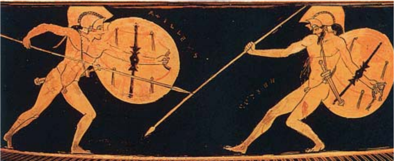
2. Μονομαχία Αχιλλέα-Έκτορα. Από αρχαίο ελληνικό αγγείο.

Αμέσως ο Αχιλλέας πήρε τα όπλα τού νεκρού, έδεσε τα πόδια του με δερμάτινα λουριά από το άρμα κι άφησε το κεφάλι του να σέρνεται στο χώμα. Μετά χτύπησε τ' άλογά του κι εκείνα έτρεξαν γρήγορα προς τα πλοία σέρνοντας το νεκρό Έκτορα μαζί τους.