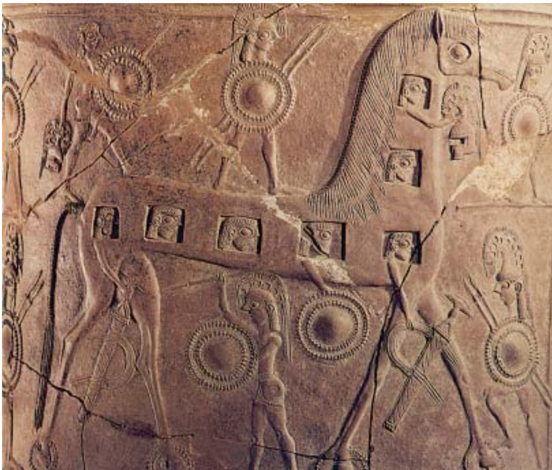
1. Ο Δούρειος ίππος. Από αρχαίο ελληνικό αγγείο.

Άδικα η Κασσάνδρα , φώναζε πως μέσα στην κοιλιά του ήταν κρυμμένοι Αχαιοί. Καθένας δεν την πίστευε. Κι ένας Τρώας, ο Λαοκόοντας, που ήταν ιερέας του Απόλλωνα, είπε: «Να φοβάστε τους Αχαιούς ακόμη κι αν σας φέρνουν δώρα».