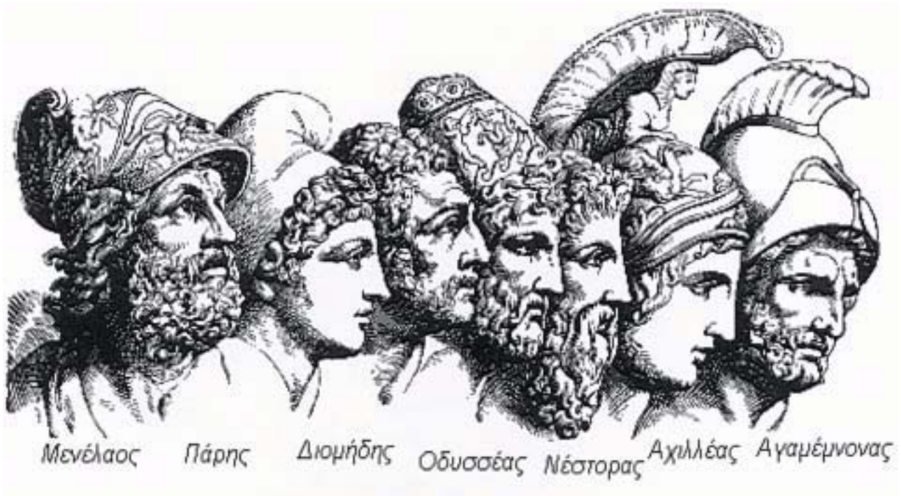
3. Οι πιο σπουδαίοι ήρωες του Τρωικού πολέμου.

Όμως φύλλο δεν εσάλευε κι οι βασιλιάδες ρωτήσανε το μάντη Κάλχα να τους πει γιατί οι άνεμοι δε φυσούσαν. Εκείνος τότε είπε ότι η θεά Άρτεμη κρατούσε τους ανέμους. Είχε θυμώσει, γιατί ο Αγαμέμνωνας είχε σκοτώσει το ιερό ελάφι της. Και δε θα της περνούσε ο θυμός, αν πρώτα ο Αγαμέμνωνας δε θυσίαζε στο βωμό της την κόρη του, την Ιφιγένεια .