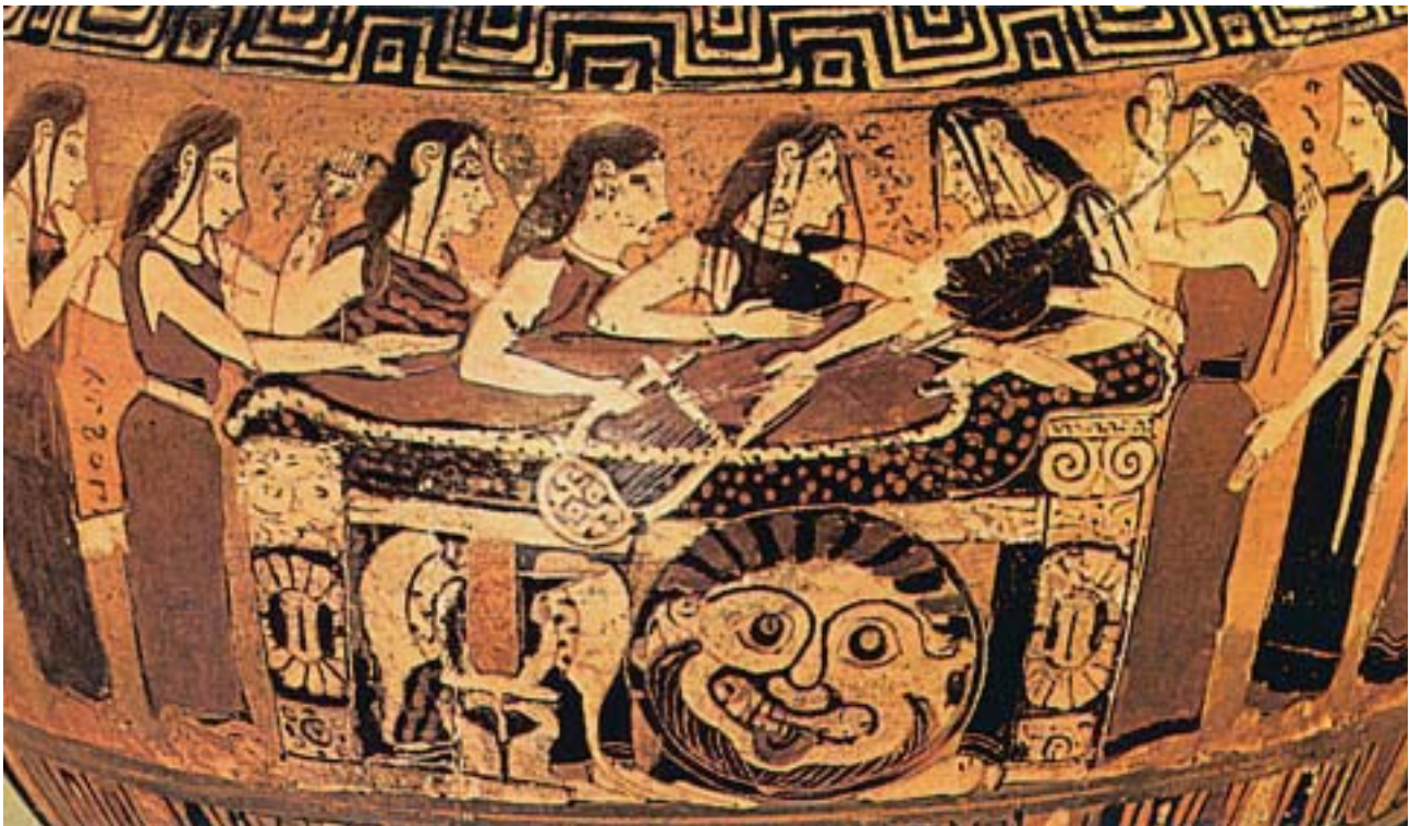
1. Οι Νηρηίδες θρηνούν τον Αχιλλέα. Από αρχαίο ελληνικό αγγείο.

Μετά από λίγες μέρες σκοτώθηκε κι ο Πάρης . Τον σκότωσε ο Φιλοκτήτης με ένα από τα δηλητηριασμένα βέλη, που του είχε χαρίσει ο Ηρακλής.