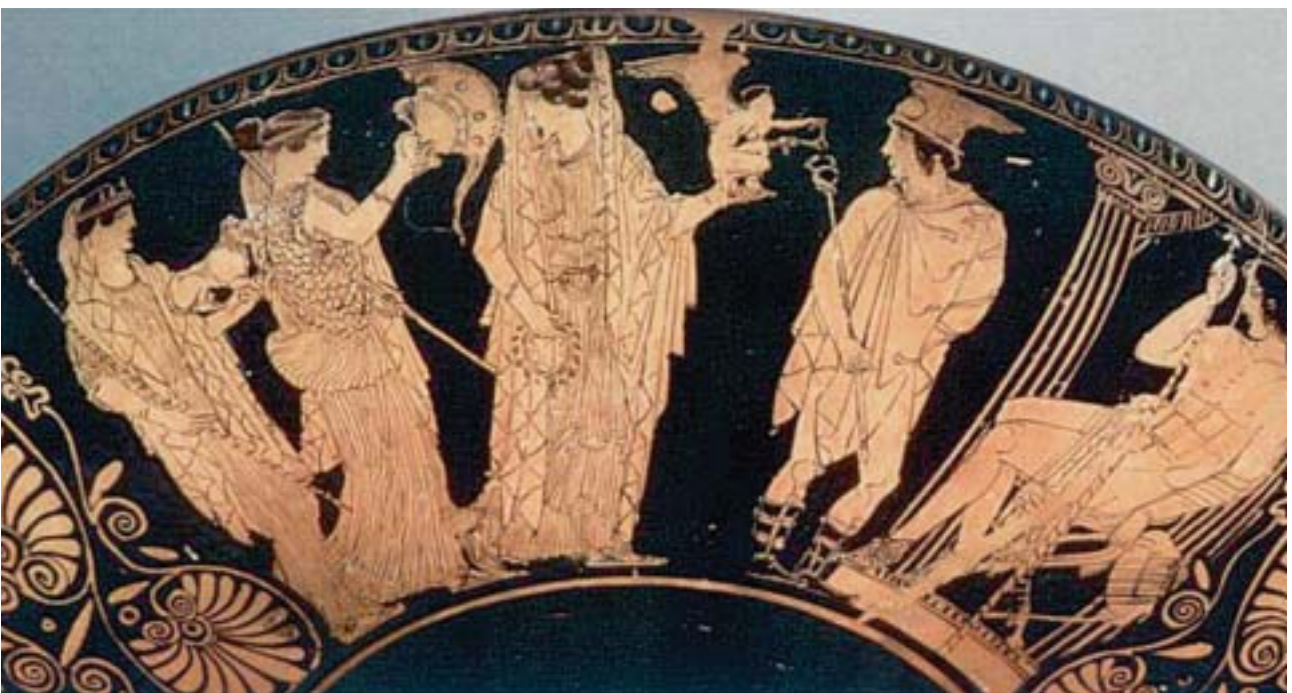
1. Η κρίση του Πάρη. Δεξιά ο Πάρης, στο κέντρο ο θεός Ερμής και ακολουθούν οι τρεις θεές: Αφροδίτη, Αθηνά, Ήρα. Από αρχαίο ελληνικό αγγείο.

Η Ήρα και η Αθηνά έφυγαν θυμωμένες, ενώ η Αφροδίτη φανέρωσε στον Πάρη πως η ωραία Ελένη , η γυναίκα του Μενέλαου, του βασιλιά της Σπάρτης, ήταν η ομορφότερη στον κόσμο και τον συμβούλεψε να πάει να την πάρει.