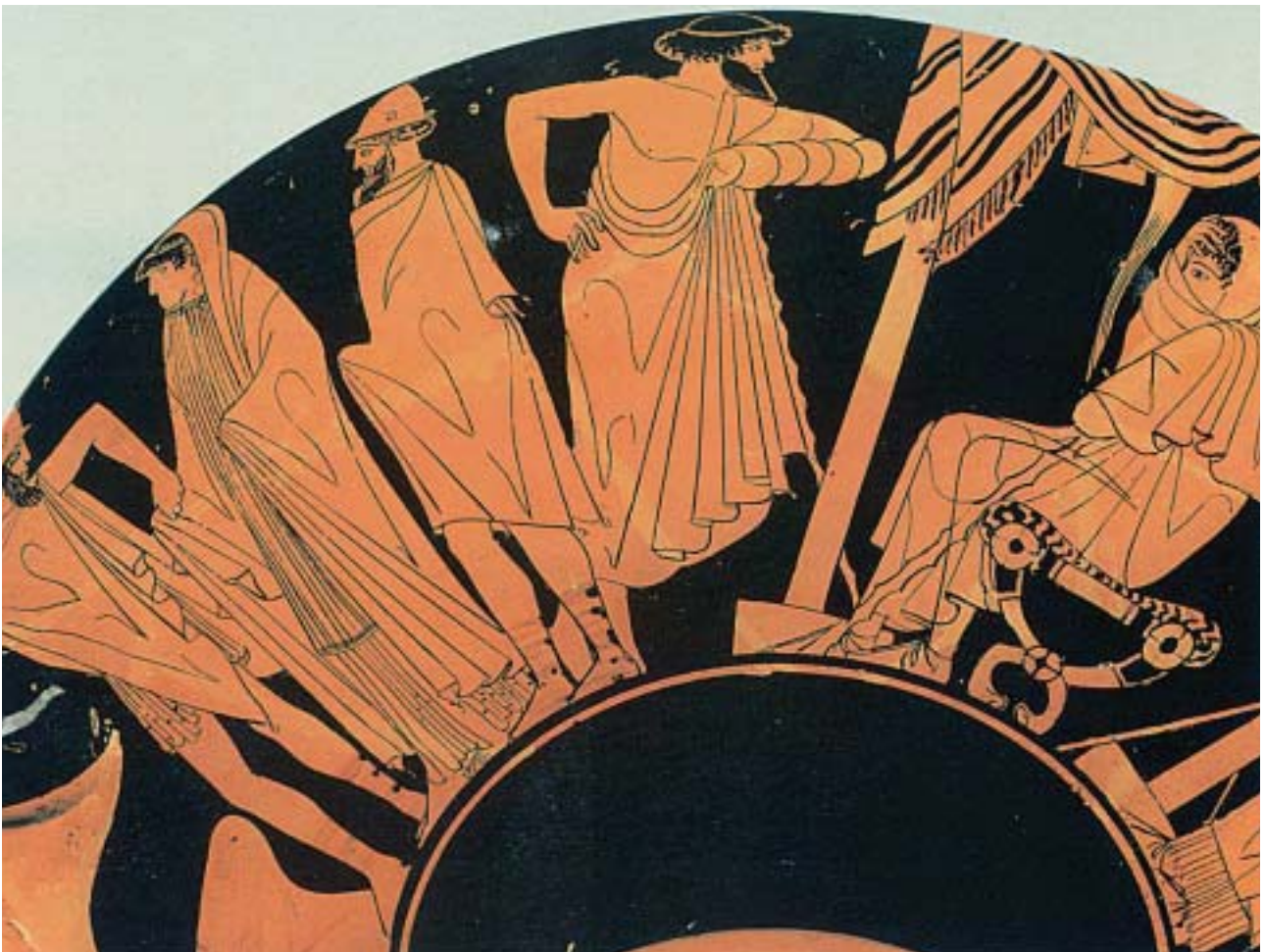
2. Η Βρισηίδα φεύγει από τη σκηνή του Αχιλλέα για να παραδοθεί στον Αγαμέμνονα. Η καθιστή μορφή δεξιά είναι ο Αχιλλέας. Από αρχαίο ελληνικό αγγείο.

Θύμωσε ο Αχιλλέας πολύ, μίσος και οργή γέμισαν την ψυχή του. Θέλησε να σκοτώσει τον Αγαμέμνονα για την προσβολή που του έκανε, μα έτρεξε η θεά Αθηνά και τον συγκράτησε. Πικραμένος όμως κλείστηκε στη σκηνή του κι ορκίστηκε να μην ξαναπολεμήσει.