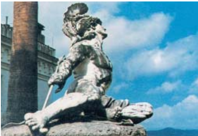
4. Ο θάνατος του Αχιλλέα. Γλυπτό της νεότερης εποχής.