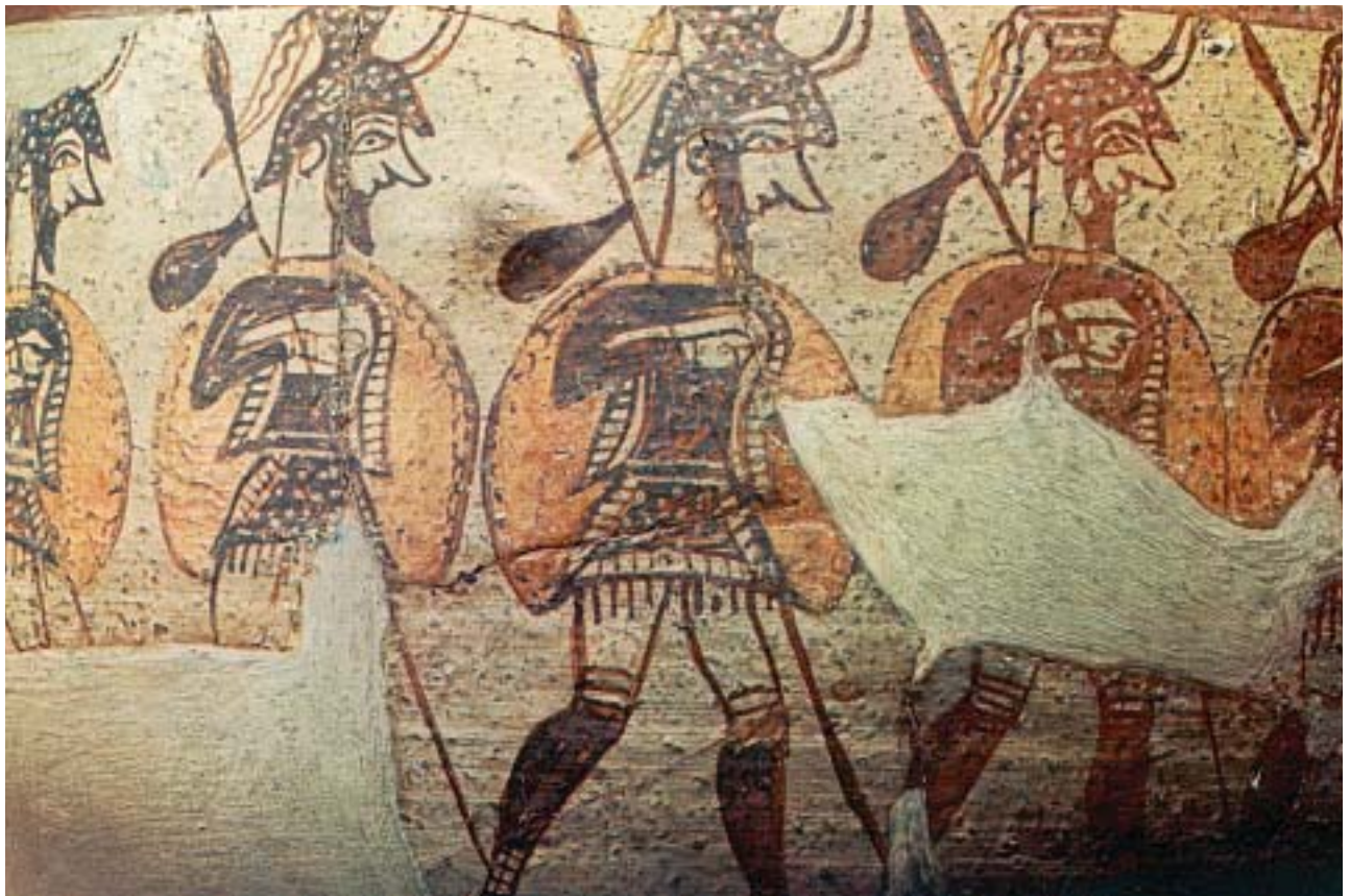
Αχαιοί πολεμιστές ξεκινούν για τον πόλεμο. Λεπτομέρεια από αρχαίο ελληνικό αγγείο.

Τι να πρωτοθυμηθεί κανείς απ' όλα αυτά που έγιναν. Οι μύθοι που τα αναφέρουν είναι τόσο γοητευτικοί, που αξίζει τον κόπο να τους διαβάσουμε και να τους θυμόμαστε για πάντα.