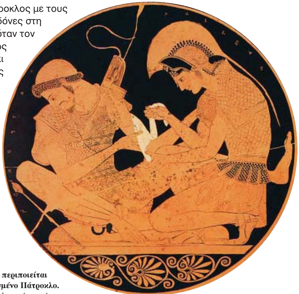
1. Ο Αχιλλέας περιποιείται τον τραυματισμένο Πάτροκλο. Από αρχαίο ελληνικό αγγείο.

Όρμησε ο Πάτροκλος με τους γενναίους Μυρμιδόνες στη μάχη. Οι Τρώες, όταν τον είδαν, νόμισαν πως ήταν ο Αχιλλέας κι έφυγαν τρέχοντας προς την Τροία.