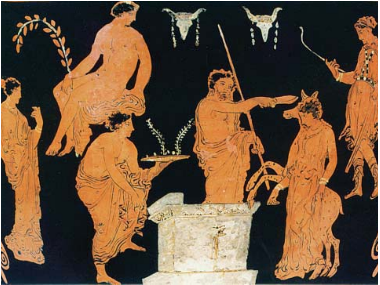
4. Η θυσία της Ιφιγένειας. Από αρχαίο ελληνικό αγγείο.