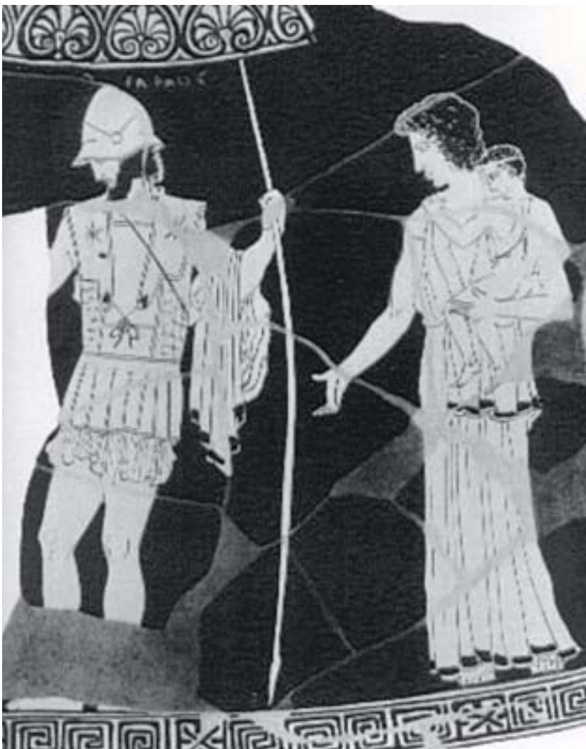
1. Ο Έκτορας αποχαιρέτά την Ανδρομάχη και τον Αστυάνακτα. Από αρχαίο ελληνικό αγγείο.

Μόνο ο γενναίος Έκτορας δεν κλείστηκε στα τείχη, αλλά έμεινε να αντιμετωπίσει τον εχθρό. Άδικα του φώναζαν ο Πρίαμος και η Εκάβη , η μητέρα του, και η όμορφη