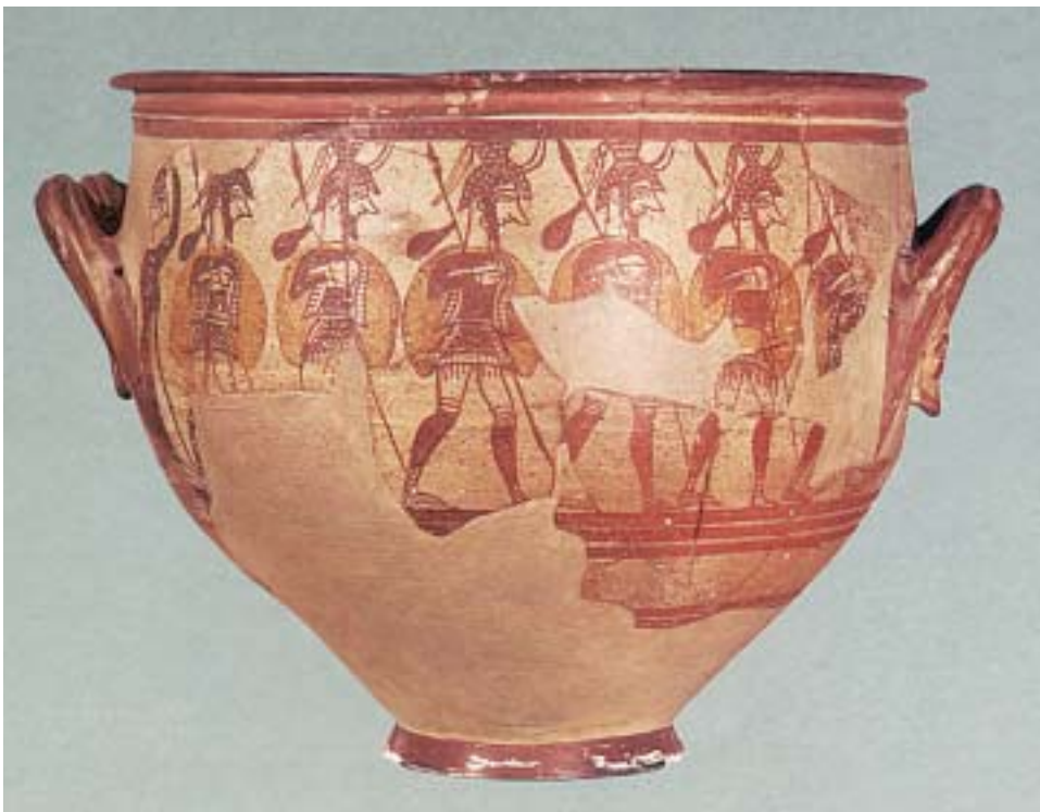
1. Αχαιοί πολεμιστές. Αρχαίο ελληνικό αγγείο.

Διάλεξαν για αρχηγό τον Αγαμέμνονα κι αφού έκαναν θυσίες, περίμεναν να φυσήξει ο άνεμος , να ξεκινήσουν τα καράβια για την Τροία.