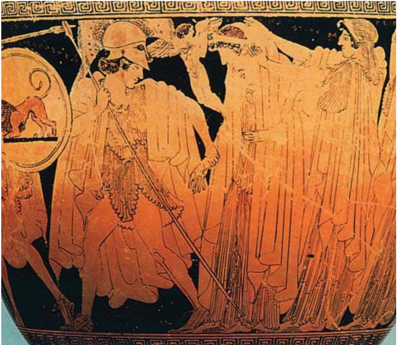
2. Η αρπαγή της Ελένης από τον Πάρη. Ανάμεσά τους ο φτερωτός θεός Έρωτας. Από αρχαίο ελληνικό αγγείο.

Ο Πάρης ετοίμασε καράβι γρήγορο κι έφυγε για τη Σπάρτη . Έφτασε στο παλάτι του Μενέλαου κρατώντας πλούσια δώρα. Εκεί όλοι τον καλοδέχτηκαν και τον φιλοξένησαν, όπως ταίριαζε στο βασιλόπουλο της Τροίας. Όμως ο Πάρης, με τη βοήθεια της Αφροδίτης, ξεμυάλισε την Ελένη και την έπεισε να τον ακολουθήσει. Και μια μέρα που έλειπε ο Μενέλαος, έφυγαν για την Τροία .