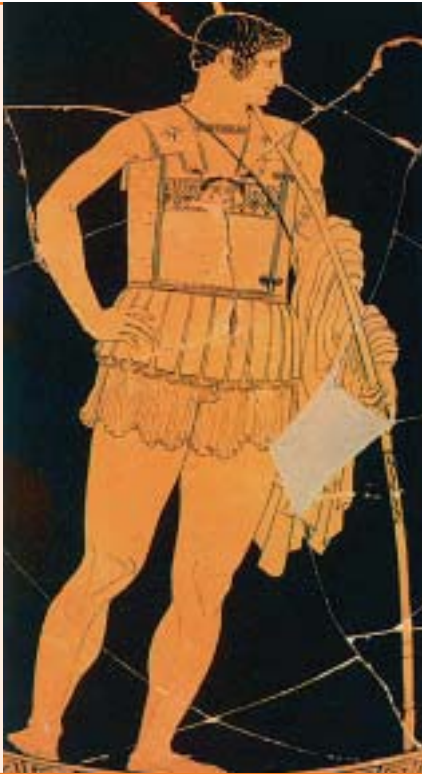
Ο Αχιλλέας. Από αρχαίο ελληνικό αγγείο.