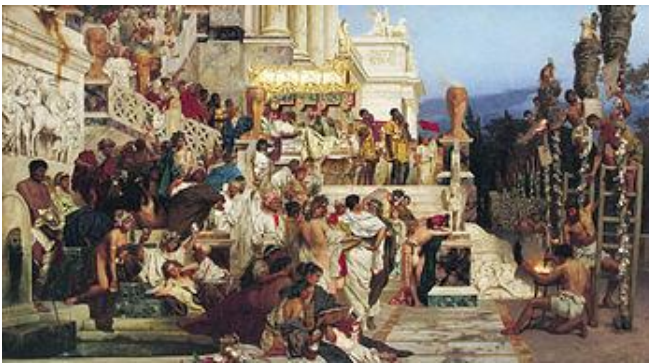
Οι δαυλοί του Νέρωνα. Πίνακας του Χένρικ

RALPH MARTIN NOVAK, "Χριστιανισμός & Ρωμαϊκή Αυτοκρατορία", εκδόσεις ΚΟΝΙΔΑΡΗ, 2000