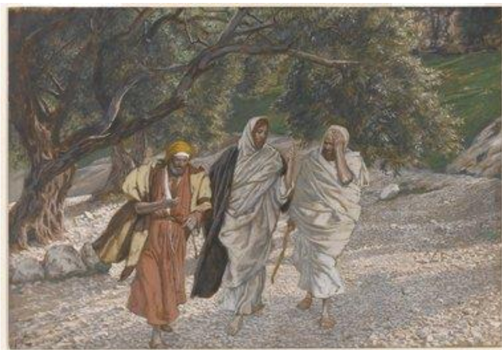
James Tissot, Η πορεία προς Εμμαούς

Ο πίνακας της πορείας προς Εμμαούς που προβάλλεται στους/στις μαθητές/τριες: