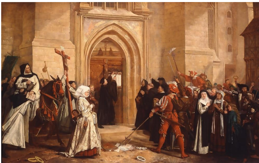
Eyre Crowe (1864). Ο Λούθηρος αναρτά τις θέσεις του στην είσοδο της εκκλησίας της Βυρτεμβέργης. Λάδι σε καμβά. Bob Jones University Museum and Art Gallery, Greenville, South Carolina, U.S.A.