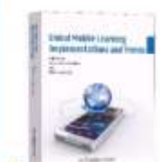
Terzopoulos, G., Kazanidis, I., Satratzemi, M., Tsinakos, A. (2019). Global Mobile Learning Implementation and Trends (2019)