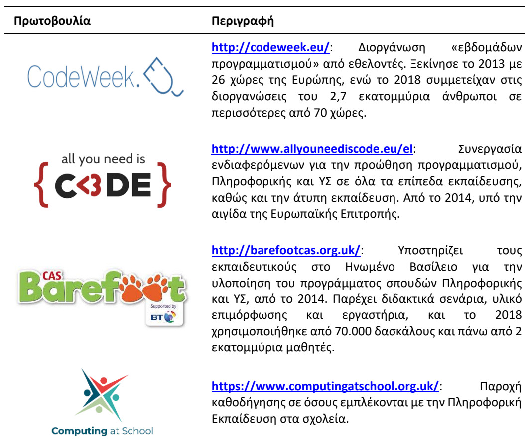
Πίνακας 5. Παγκόσμιες πρωτοβουλίες ενσωμάτωσης της ΥΣ.