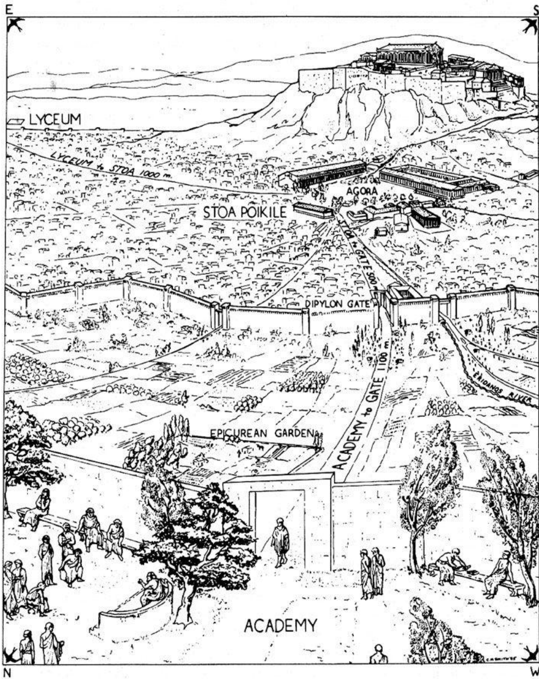
The philosophical schools of Hellenistic Athens: locations and distances. © Candace H. Smith 1987