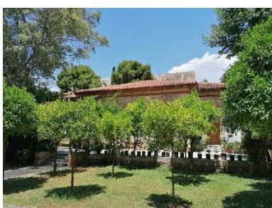
Ι. Ναός Αγ. Γεωργίου