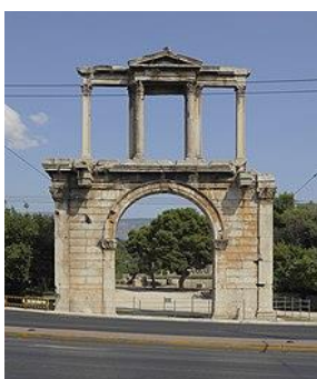
Πύλη του Αδριανού