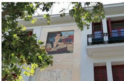
Η πολυκατοικία με το ψηφιδωτό του Θησέα