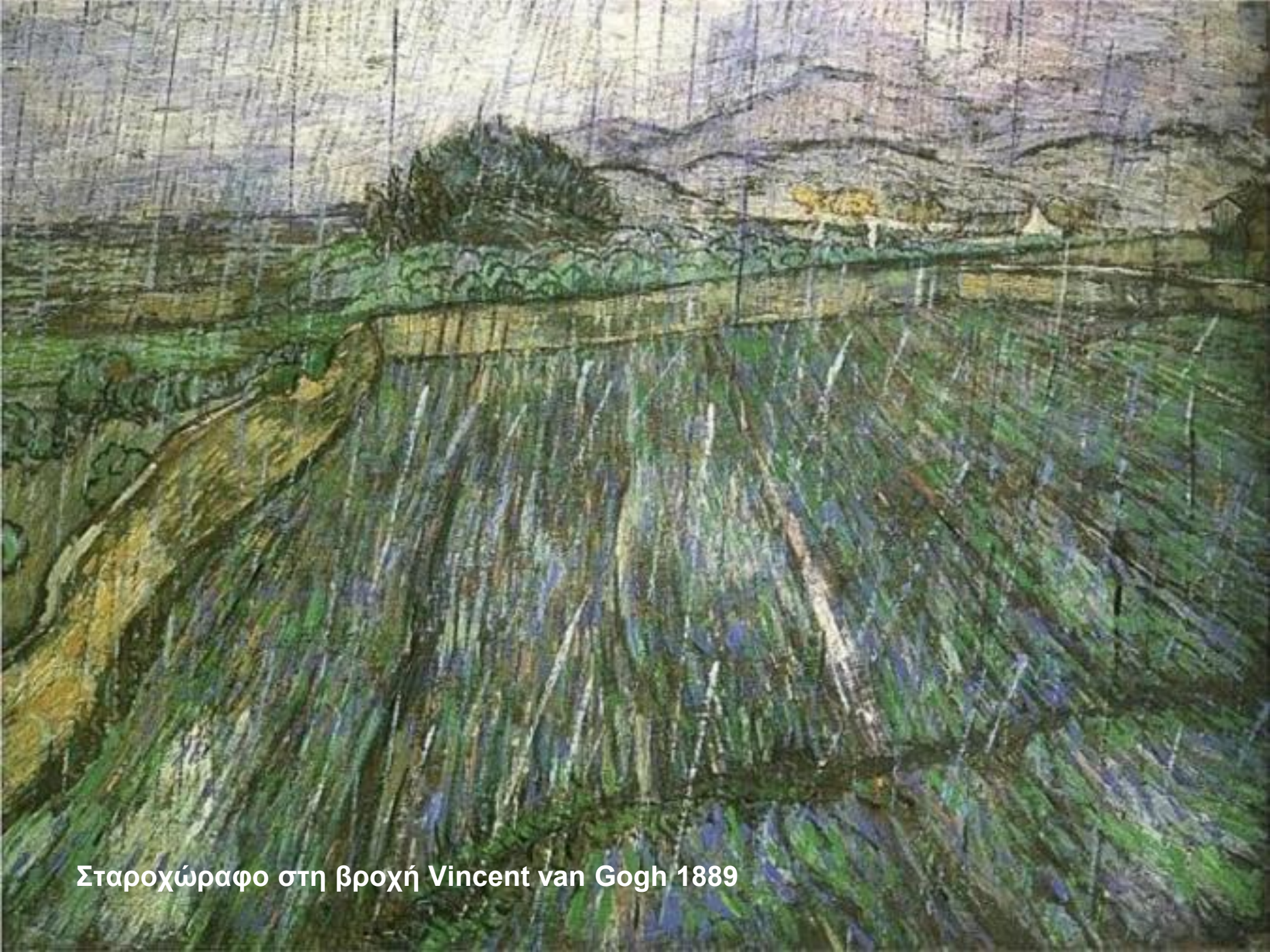
Σταροχώραφο στη βροχή Vincent van Gogh 1889