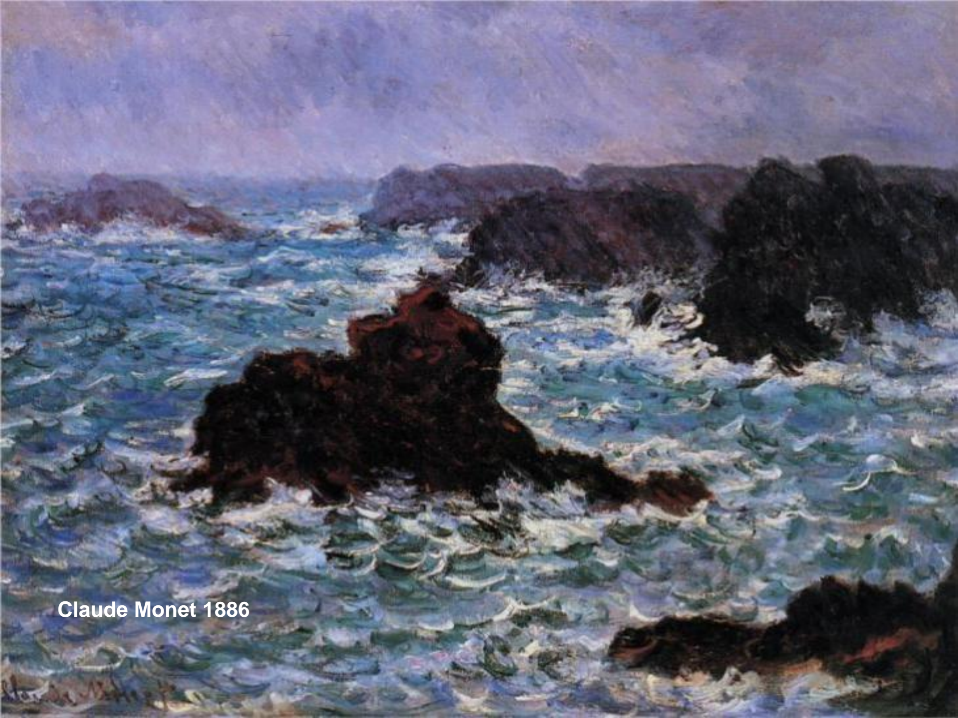
Claude Monet 1886