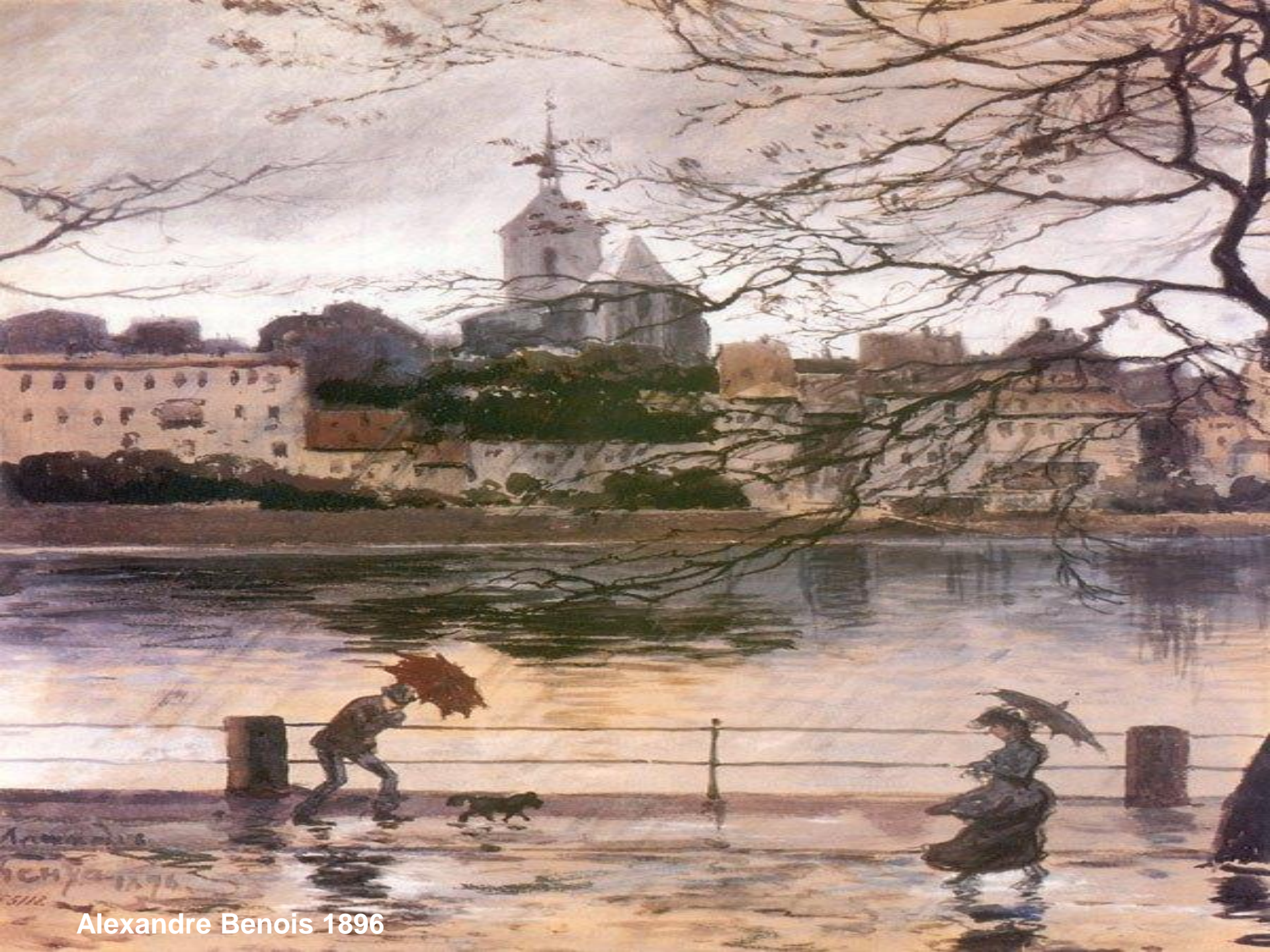
Alexandre Benois 1896