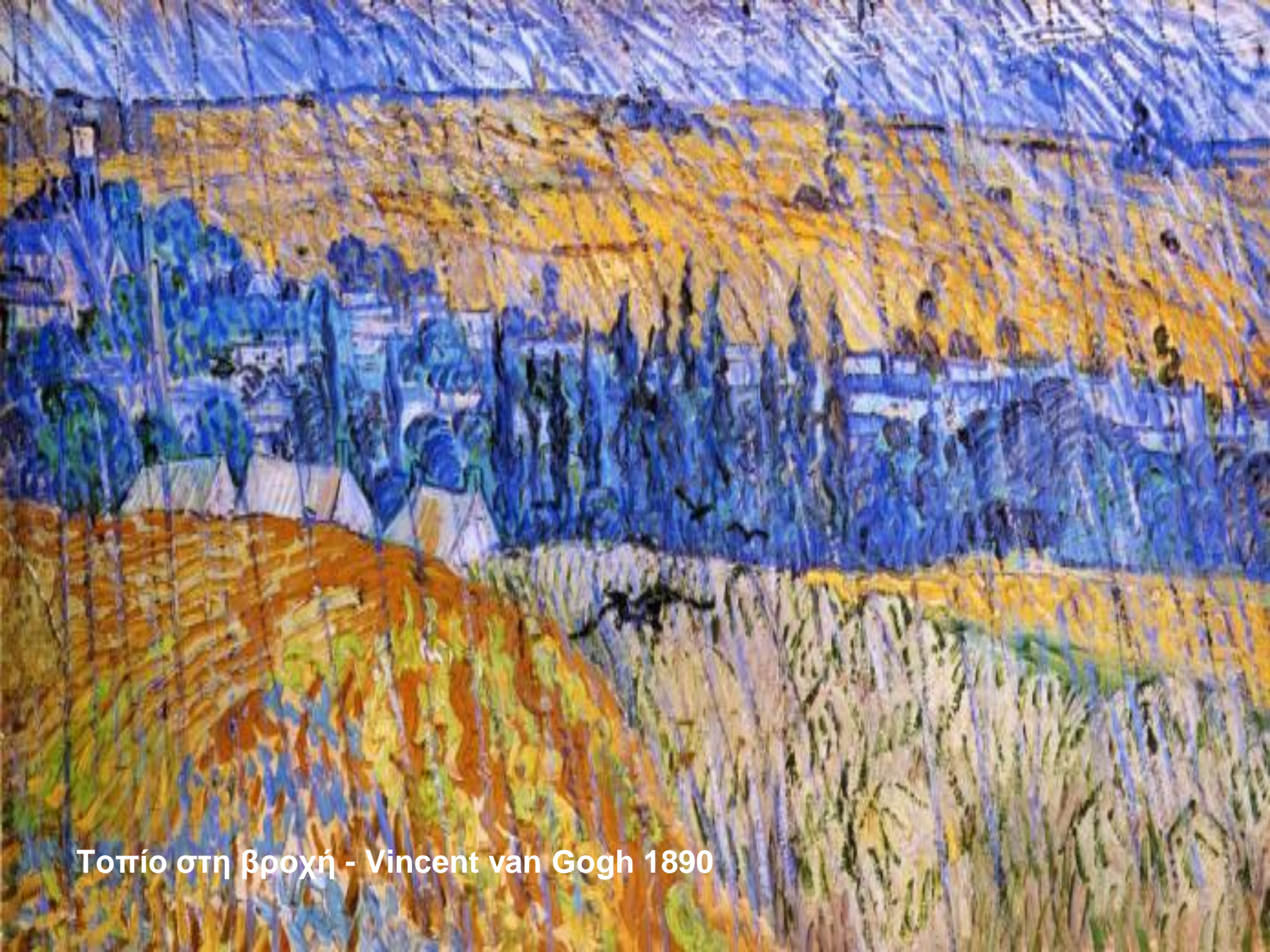
Τοπίο στη βροχή - Vincent van Gogh 1890