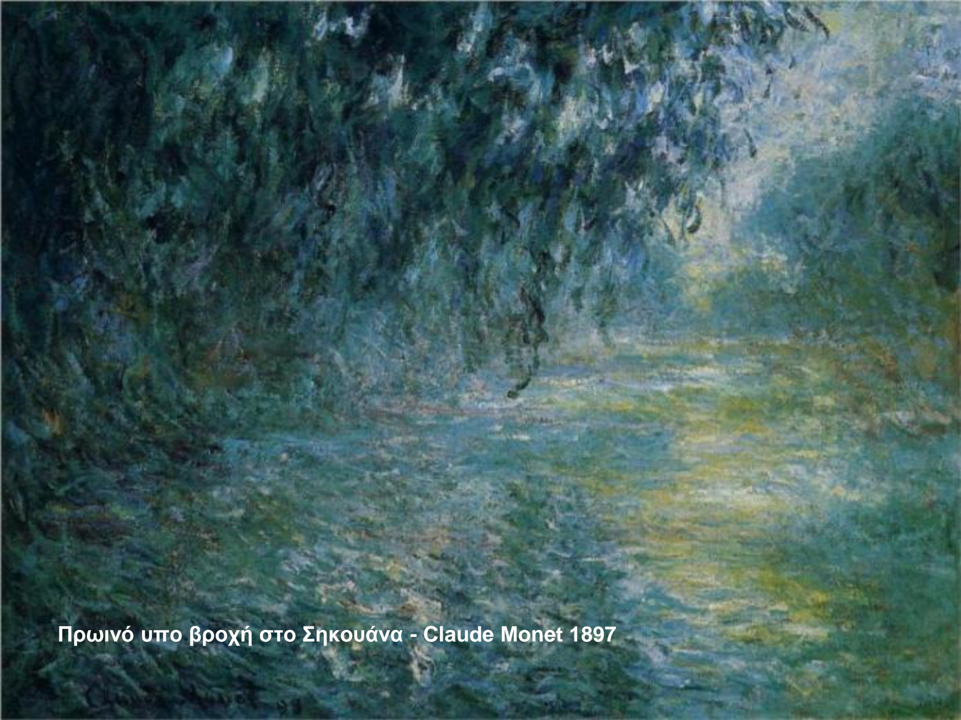
Πρωινό υπο βροχή στο Σηκουάνα - Claude Monet 1897