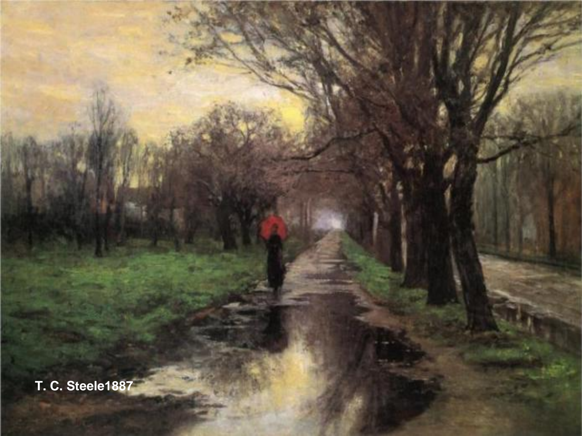
T. C. Steele 1887