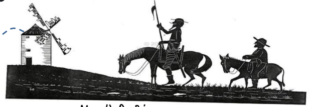
του Μιχαήλ Θερβάντες

Ο Δον Κιχώτης ήταν ένας άρχοντας πολύ φτωγός σε λεφτά αλλά ηλούσιος σε φαντασία. Ζούσε στην Ισπανία, στην ζακουσμένη επαρχία της Μάντσα. Όταν έφτασε σε ηλικία 50 χρόνων, αποφάσισε να κλειστεί σ' ένα δωμάτιο και άρχισε να διαβάζει ιπποτικά μυθιστορήματα. Έφτασε να νομίζει ότι όλα αυτά που διάβαζε γίνονταν πραγματικά. Επηρεάστηκε τόσο, που αποφάσισε να γίνει κι αυτός ιππότης και να ζήσει περιπέτειες.