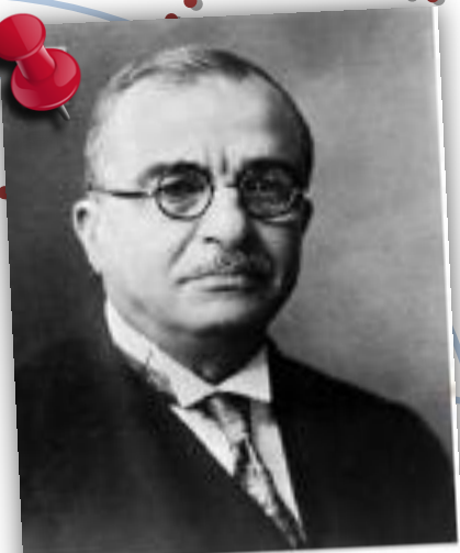
▲ Ο Ιωάννης Μεταξάς (1871-1941)