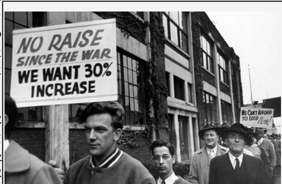
Εικόνα 6: Τα εργατικά συνδικάτα πρωταγωνίστησαν στην κατάκτηση της αξιοπρέπειας των εργατών. Εδώ περιφρουρούν την απεργία έξω από ένα εργοστάσιο.

Α κόμα , λένε οι ειδικοί , ότι ήταν οι ενέργειες των αμέτρητων ανθρώπων , όπως της ίδιας που βοήθησε να κερδηθούν τα πρότυπα ασφάλειας στην εργασία , οι καλύτερες αμοιβές , και η αξιοπρέπεια στο χώρο εργασίας, που πολλοί εργάτες λαμβάνουν σήμερα . Στο 1990 , πολύ καιρό αφότου είχε πεθάνει η Camella , στο Lawrence ένας δρόμος πήρε το όνομά της: Camella Teoli . «Η Camella πιθανώς δεν κατάλαβε ποτέ το δώρο της στο έθνος » , έγραψε ένας αρθρογράφος τοπικής εφημερίδας . Ωστόσο το έθνος με τον τρόπο του , αυτό το μικρό δρόμο πληρώνει φόρο τιμής για τη συμβολή αυτού του έφηβου κοριτσιού, που έκανε τη σιγανή φωνή του να ληφθεί υπόψη.