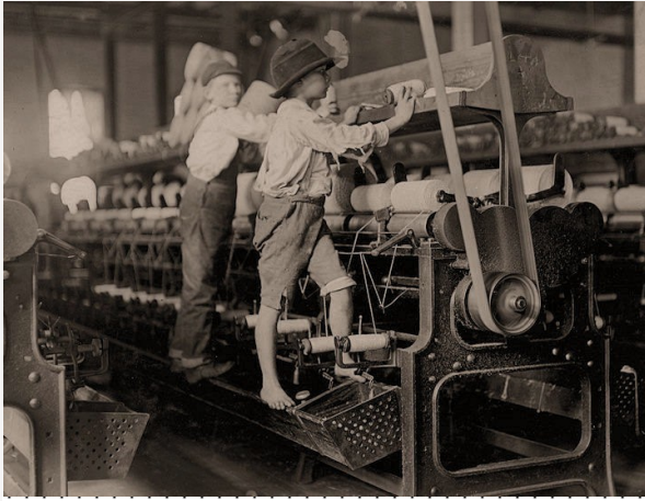
Εικόνα 1: ΠΑΙΔΙΚΗ ΕΡΓΑΣΙΑ. Αυτοί οι εργάτες ήταν τόσο μικροί που αναγκάζονταν να σκάρφάλωσουν πάνω στα μηχανήματα ύφανσης.

Αυτή η ημέρα στην Camella τον Ιούλιο του 1909 ήδη φαινόταν ατελείωτη . Όπως πολλά από τα άλλα παιδιά εργάτες, που εργαζόνταν στην περιοχή των υφαντουργείων της Ουάσιγκτον στη Μασαχουσέτη των ΗΠΑ, είχε ξεκινήσει πριν την αυγή για να πιάσει δουλειά στις 6 π.μ. . Ωρα με την ώρα , ο θόρυβος από το εργοστάσιο μηχανών είχε κυριολεκτικά ξεκουφάνει τα αυτιά της . Ο αέρας στο κτήριο ήταν πυκνός με ίνες από το ύφασμα που περιστρέφονταν εκεί - και τους ανέπνεε , επιβαρύνοντας τους πνεύμονές της.