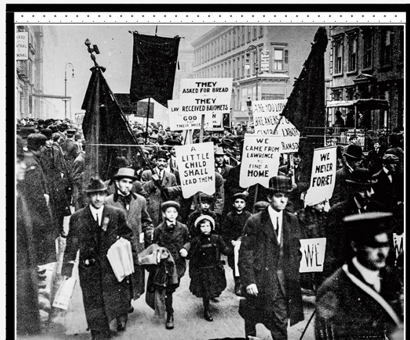
Εικόνα 4: ΣΕ ΑΠΕΡΓΙΑ. Εργάτες στο Lawrence κάνουν πορεία διεκδικώντας καλύτερους μισθούς

Οι ενώσεις των εργατών διαπραγματεύονται για καλύτερες αμοιβές και καλύτερες συνθήκες των μελών τους. Διοργανώνουν απεργίες ή διαδηλώσεις. Βασικό στοιχείο τους είναι η καλλιέργεια αλληλεγγύης μεταξύ των εργατών