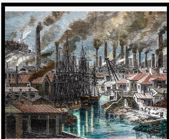
Εικόνα 3: Κατά τη διάρκεια της βιομηχανικής επανάστασης πόλεις όπως αυτή του Lawrence ήταν μολυσμένες γεμάτες από το μαύρο καπνό των εργοστασίων.