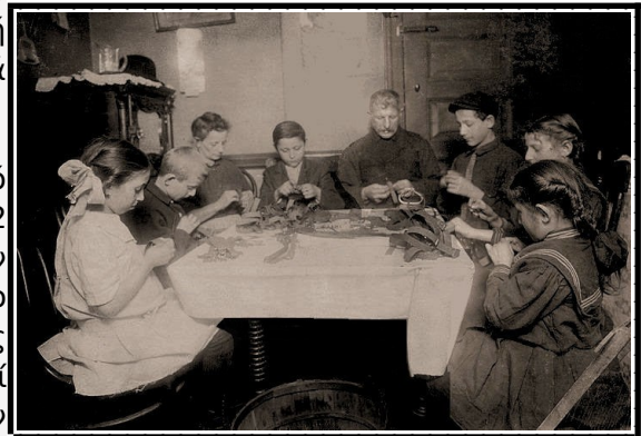
Εικόνα 2: Οι συνθήκες ζωής των εργατών ήταν άθλιες. Ζούσαν σε σκοτεινά σπίτια με ελάχιστες ανέσεις.