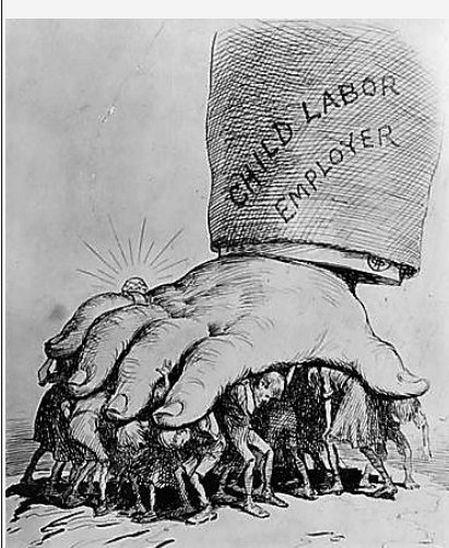
Εικόνα 8: Εργοδότης παιδικής εργασίας.

Στη σύγχρονη εποχή η παιδική εργασία εξακολουθεί να υπάρχει. Όχι στις αναπτυγμένες κοινωνίες όπως η δική μας, ίσως γιατί, όπως έχεις ακούσει, οι βιομηχανίες έχουν μεταφερθεί σε άλλες χώρες, όπου οι μισθοί των εργατών είναι πολύ χαμηλοί και δεν υπάρχουν αυστηροί κανόνες για τα δικαιώματα των εργατών. Πολλά παιδιά συνεχίζουν να εργάζονται σε συνθήκες χειρότερες από αυτές της Καμέλα. Ίσως να ξαφνιαζόσουν αν μάθαινες ότι πολλά από τα ρούχα, τα παπούτσια και οι ηλεκτρονικές συσκευές που χρησιμοποιείς έχουν κατασκευαστεί από παιδικά χέρια.