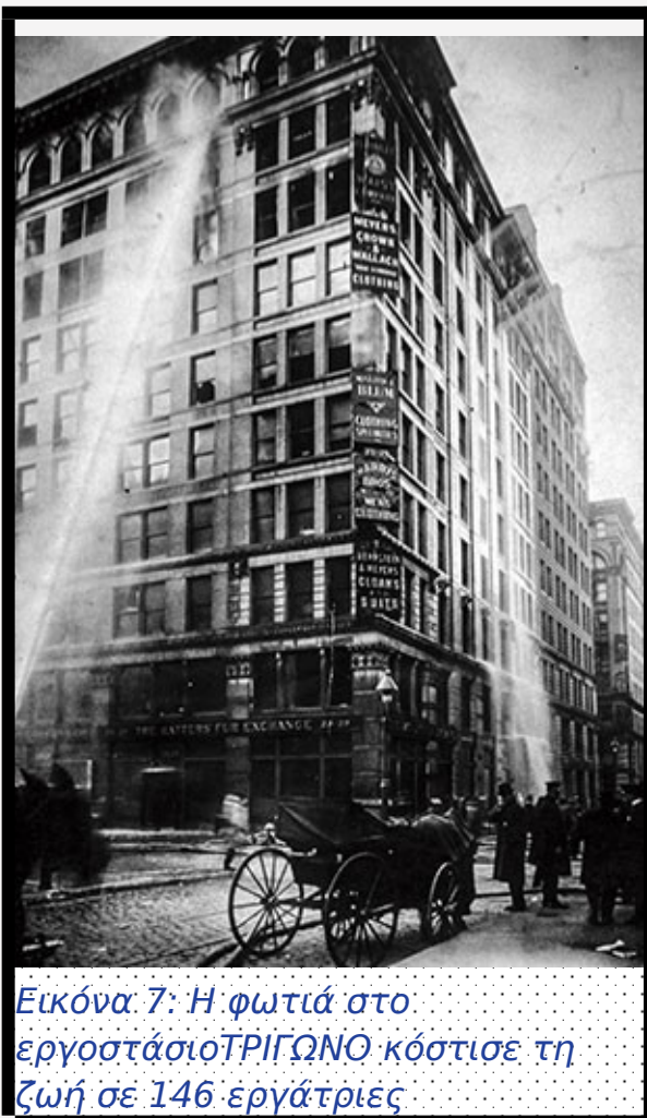
Εικόνα 7: Η φωτιά στο εργοστάσιο ΤΡΙΓΩΝΟ κόστισε τη ζωή σε 146 εργάτριες

https://junior.scholastic.com/issues/2018-19/031119/the-girl-who-spoke-out-for-workers-rights.html#930L