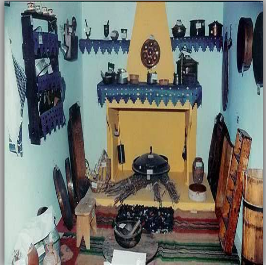
Μαγειρείο με τα παλιά σκεύη