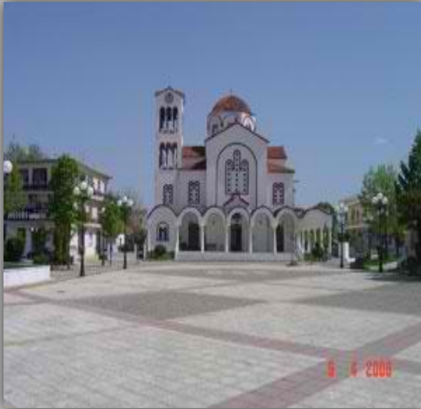
Η Κεντρική Πλατεία με την Πολιούχο Αγία Παρασκευή

Σήμερα οι Σοφάδες είναι μια κωμόπολη στην καρδιά της Ελλάδας με πραγματικό πληθυσμό άνω των 6.500 κατοίκων και έκταση 4.000 στρεμ.