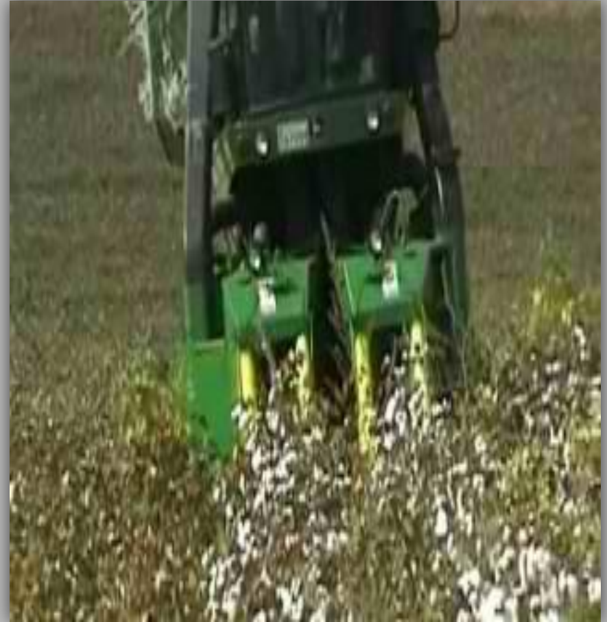
Αλωνιστική μηχανή μαζεύει το βαμβάκι