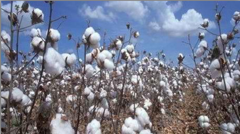
Το βαμβάκι «βγήκε»