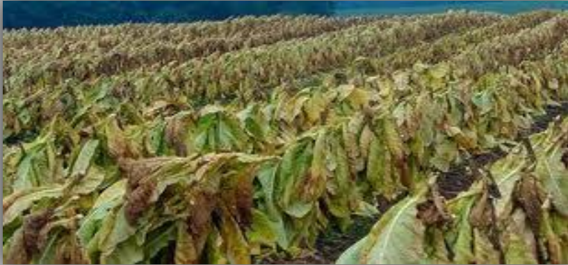
Ο καπνός αποξηραίνεται

Οι Σοφάδες είναι καθαρά αγροτική περιοχή , με καλλιέργειες καπνού, βαμβακιού, σιταριού, πιπεριάς και βιομηχανικής ντομάτας.