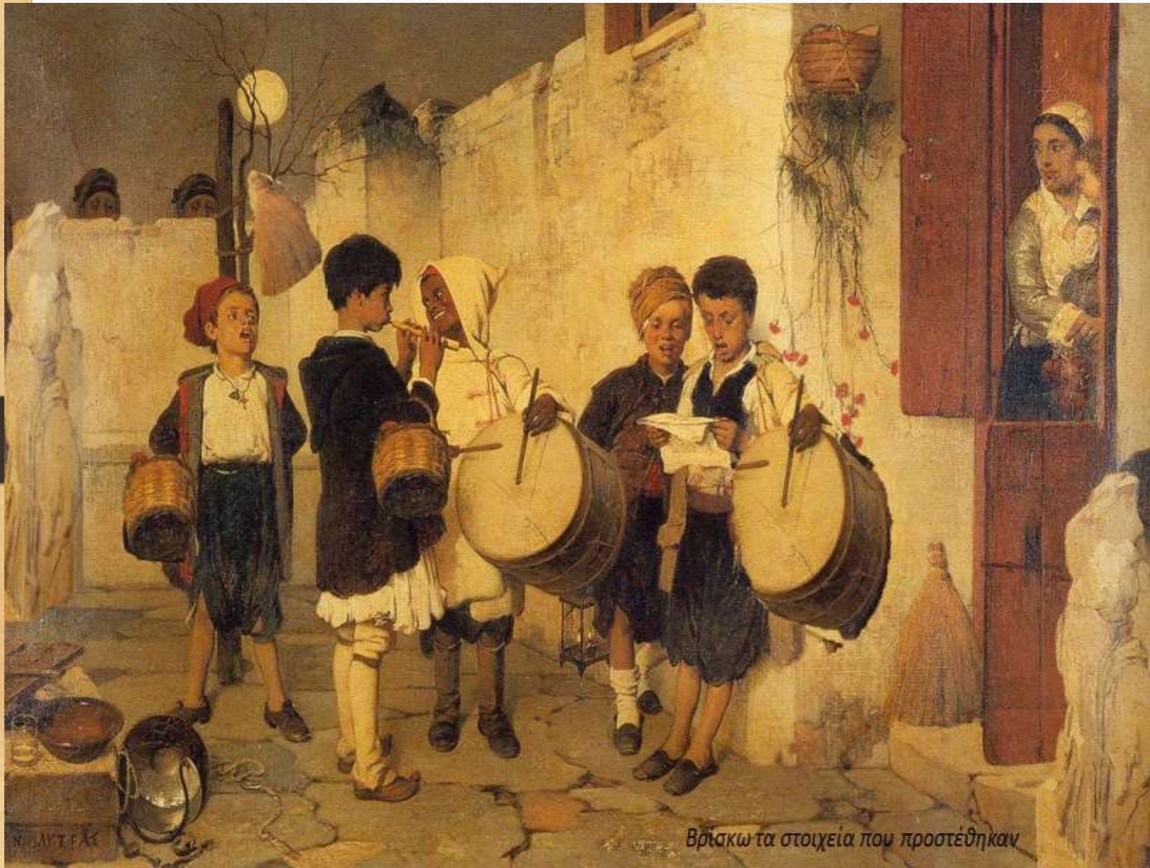
Βρίσκω τα στοιχεία που προστέθηκαν