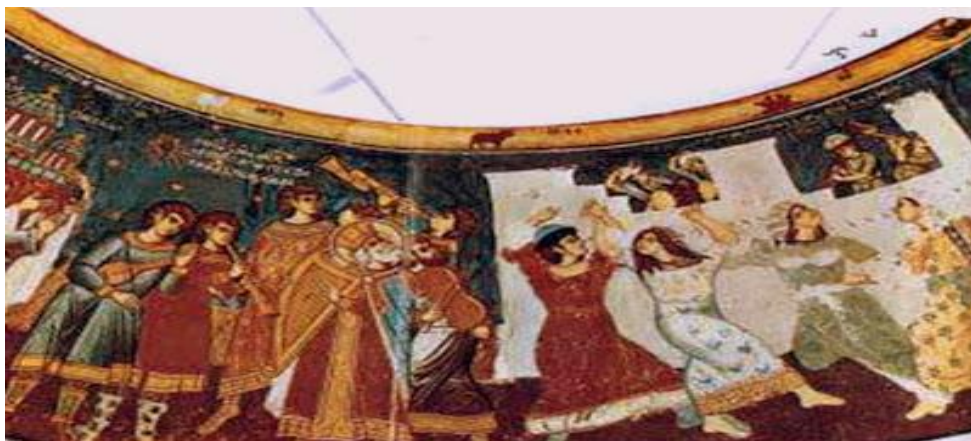
Βυζαντινό πανηγύρι σε ξωκλήσι.