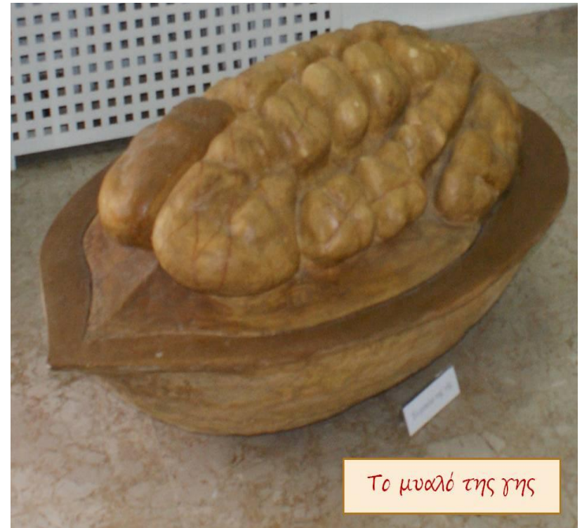
Το μυαλό της γης

Για κούταξε αυτό. Σίγουρα κάτι σου θυμίζει. Είναι το καρύδι που ο γλύπτης ονόμασε «Το μυαλό της φύσης», μια που η ψίχα του είναι σαν τον ανθρώπινο εγκέφαλο. Εκεί η φύση έχει καταγεγραμμένη όλη της τη σοφία.