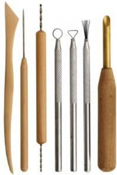
...τα εργαλεία του γλύπτη