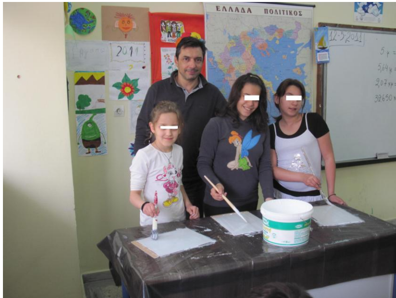
Φωτογραφία 7: Μαθήτριές μας σε στιγμές δημιουργίας και χαράς.