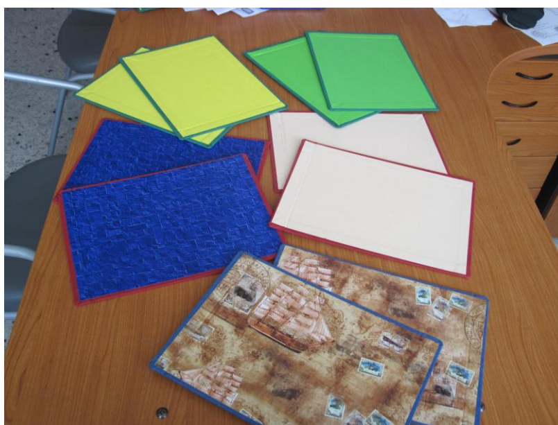
Φωτογραφία 4: Εσωτερική επένδυση εξωφύλλων με διακοσμητικό χαρτί.