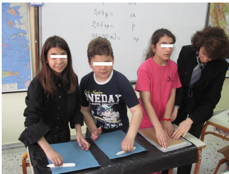
Φωτογραφία 3: Επικόλληση υφάσματος με συμπίεση με κόκαλο βιβλιοδεσίας.