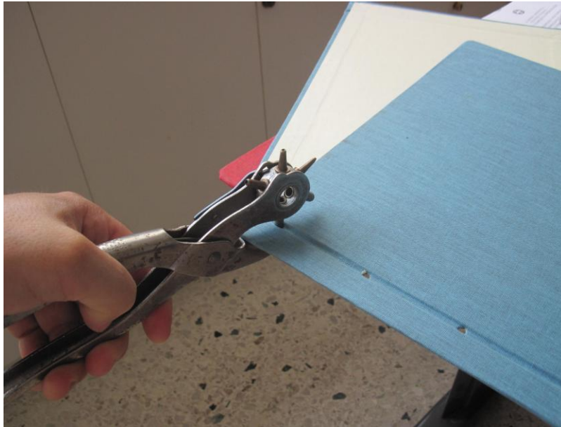
Φωτογραφία 5: Τρύπημα εξωφύλλων μέσα στο αυλάκι.