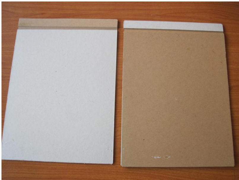
Φωτογραφία 2: Χαρτόνια για εξώφυλλα με επικόλληση χαρτιού κραφτ.