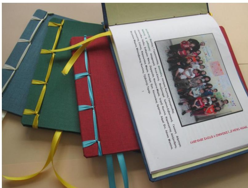
Φωτογραφία 8: Τα βιβλία ολοκληρωμένα.