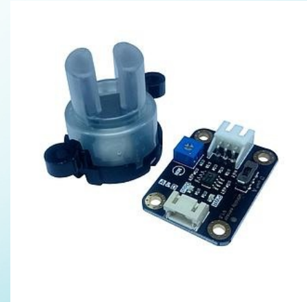
Gravity: Analog Turbidity Sensor

Καθώς ζούμε σε μία περιοχή που, ευρύτερα γύρω της, υπάρχουν μεγάλες δασικές εκτάσεις μπορούμε να χρησιμοποιήσουμε τον αισθητήρα εντροπισμού φλόγας αυτό για την ανίχνευση πυρκαγιάς (με γωνία δράσης > 120 μοίρες). Ο αισθητήρας αυτός βασίζεται σε 5 επί μέρους αισθητήρες φλόγας που είναι διατεταγμένοι ο ένας δίπλα στον άλλον σε γωνία 30 μοιρών για μεγαλύτερη ακτίνα δράσης γύρω από τη συσκευή αισθητήρα