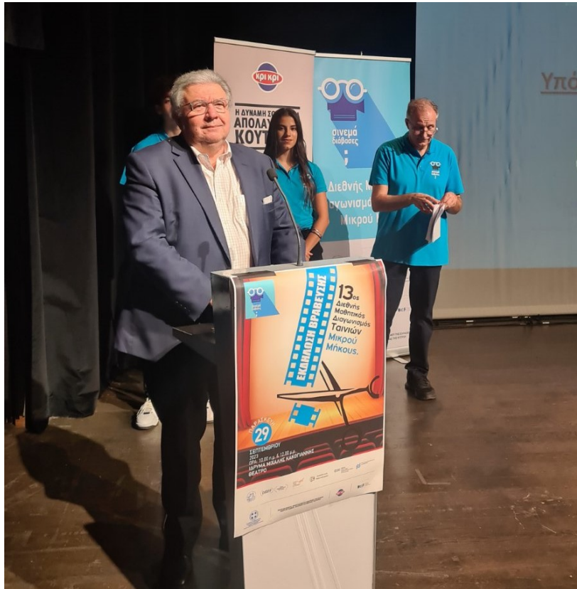
Ο κ. Γιάννης Χρυσουλάκης, Γενικός Γραμματέας Απόδημου Ελληνισμού και Δημόσιας Διπλωματίας