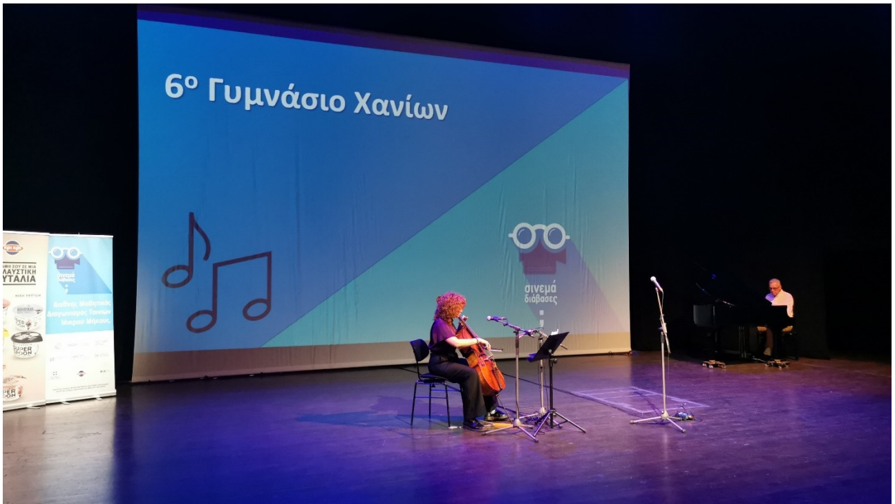
Live τραγούδι από το 6° Γυμνάσιο Χανίων