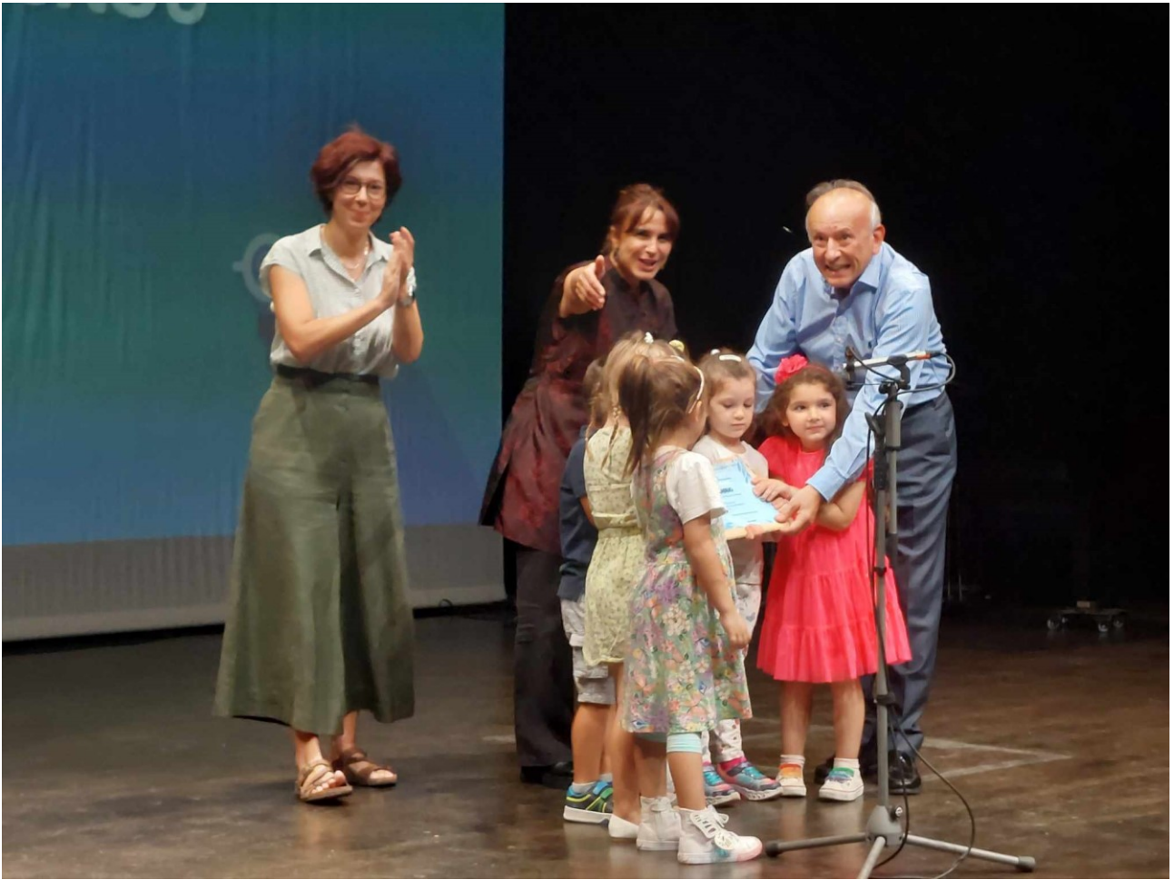
Ο κ. Κωνσταντίνος Τσαχαλός, Προϊστάμενος της Γενικής Διεύθυνσης Σπουδών Πρωτοβάθμιας και Δευτεροβάθμιας Εκπαίδευσης