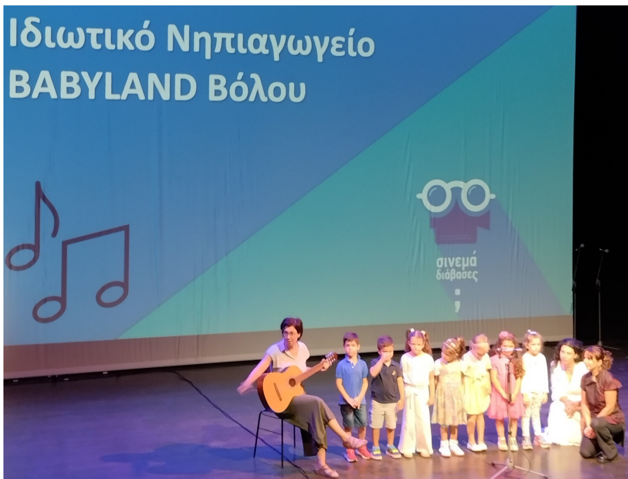
Live τραγούδι από το νηπιαγωγείο Babyland του Βόλου