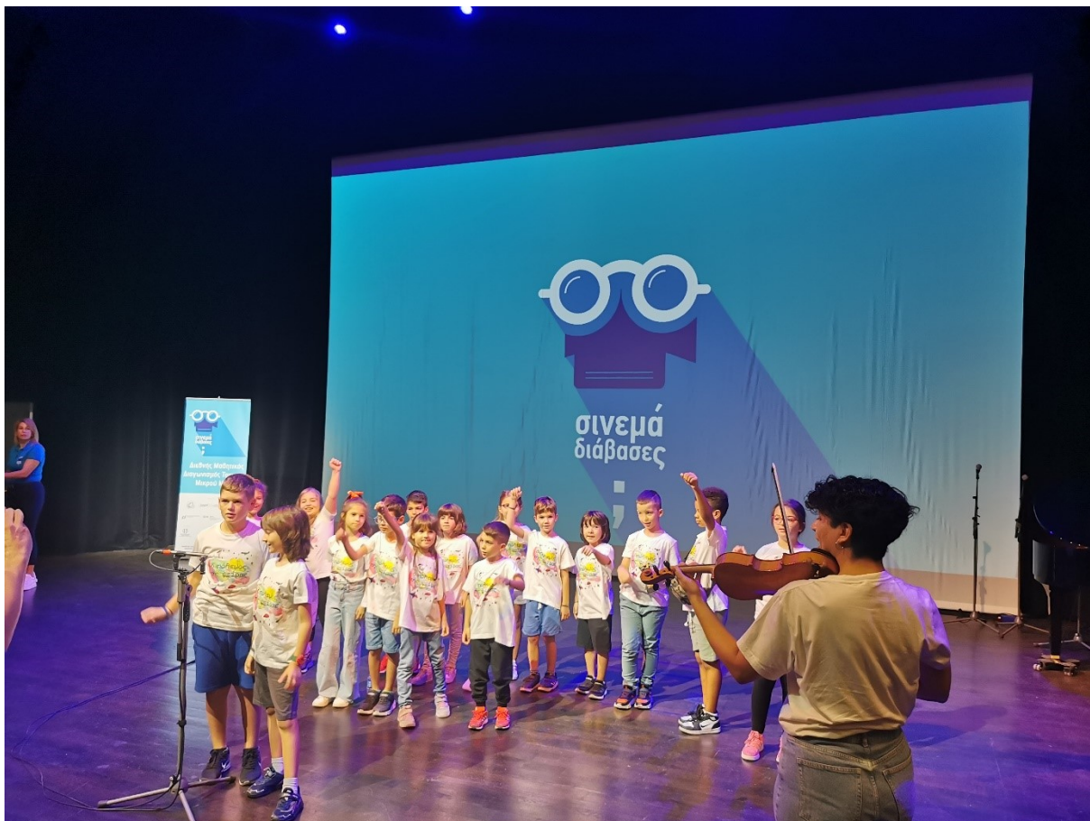
Live τραγούδι από το 10 ο Δημ. Σχολείο Νεάπολης