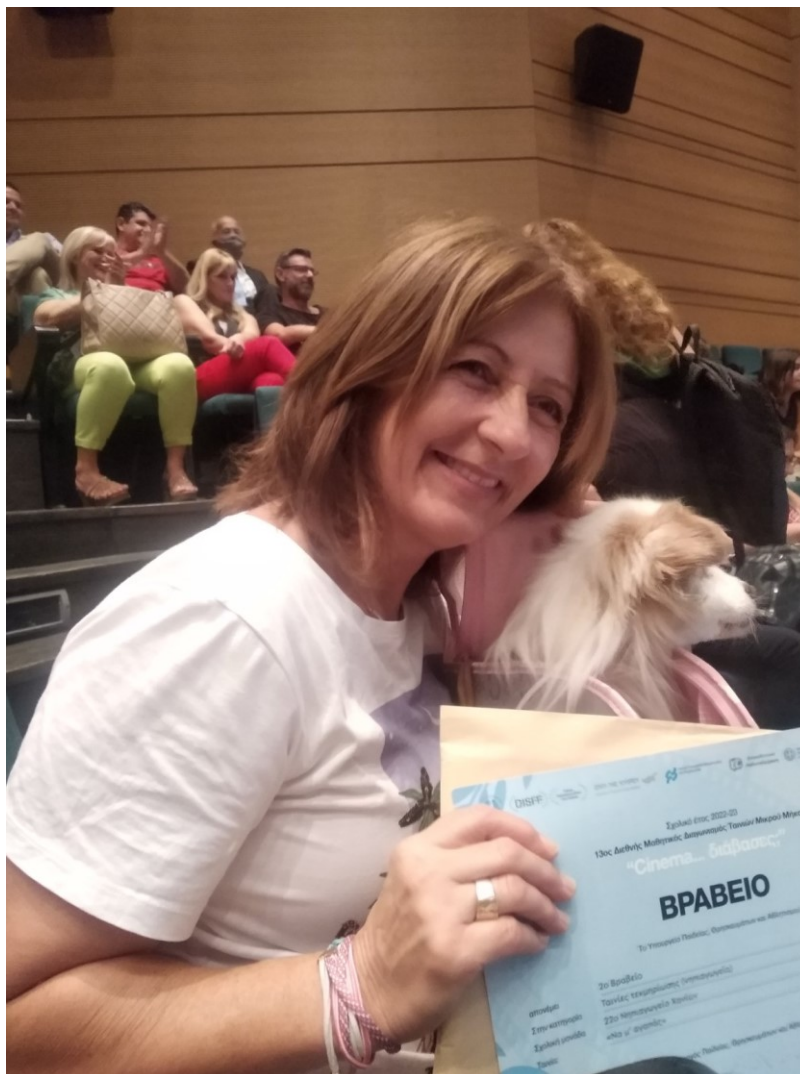
Η σκυλίτσα «πρωταγωνίστρια» του 22 ου Νηπιαγωγείου Χανίων!