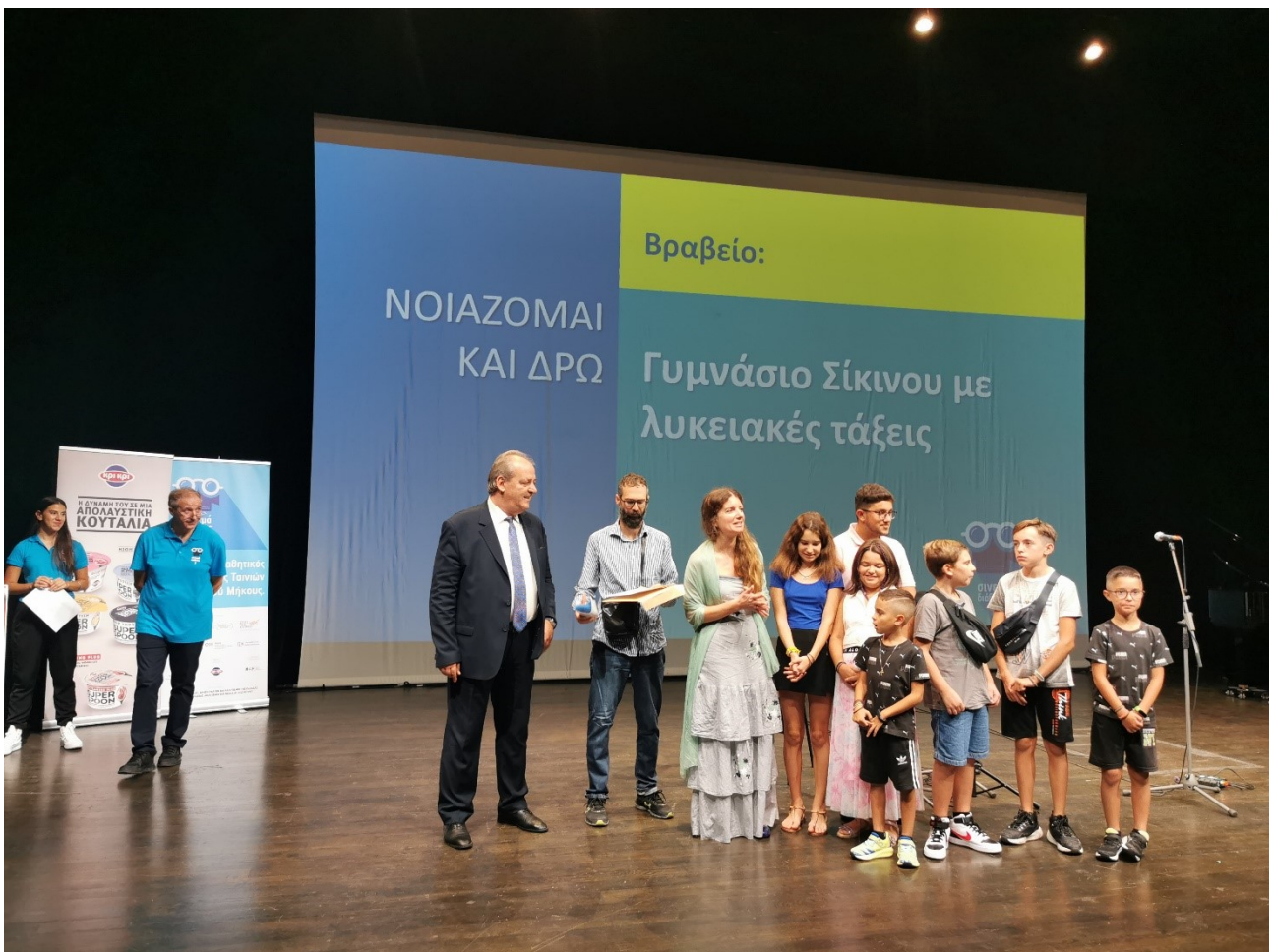
Η ομάδα του Γυμνασίου με Λ.Τ. Σικίνου, που σάρωσε τα βραβεία!