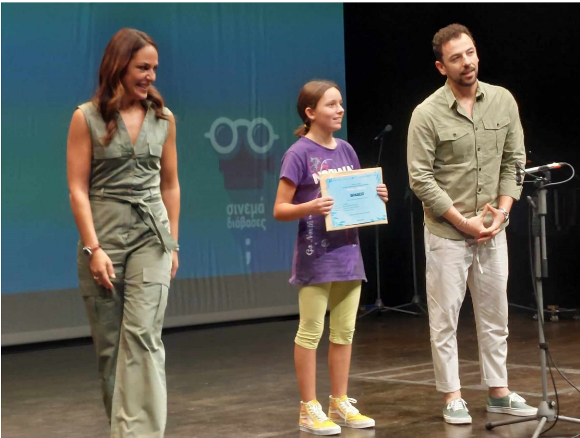
η κα Δόμνα Μιχαηλίδου , Υφυπουργός Παιδείας, Θρησκευμάτων και Αθλητισμού