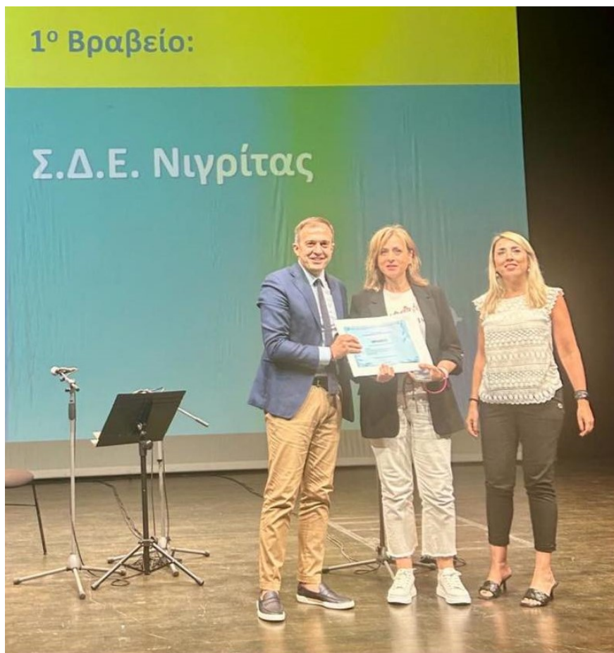
Ο κ. Τάσος Χατζηβασιλείου, Βουλευτής Σερρών