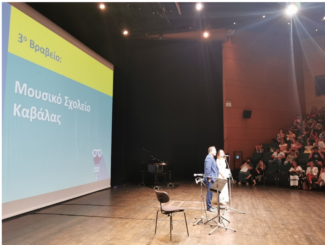
Ο κ. Doron Lebovich , Σύμβουλος της Πρεσβείας του Ισραήλ