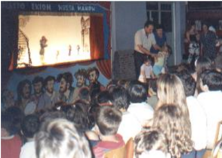
«Καραγκιόζης, ο άρχοντας του καπνού», εν δράσει.