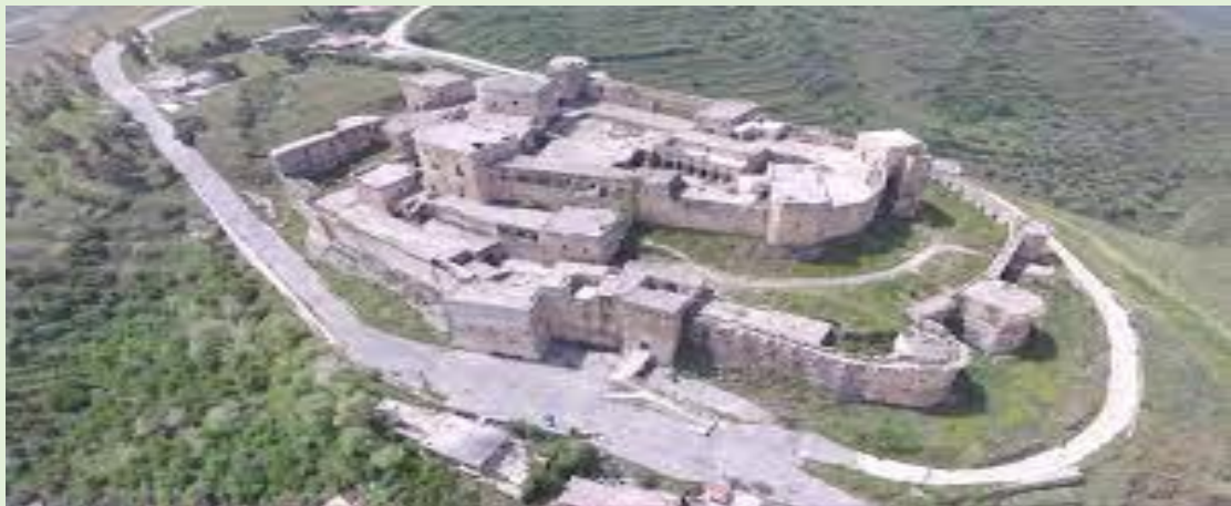
Spyridoula Papathanasiou, B2

En Syrie, il y a une zone appelée les États arabes. Là, il y a le château des chevaliers, probablement construit entre 1150-1250. C'est une ville ancienne, en pierre. Elle est haute et assez grande.