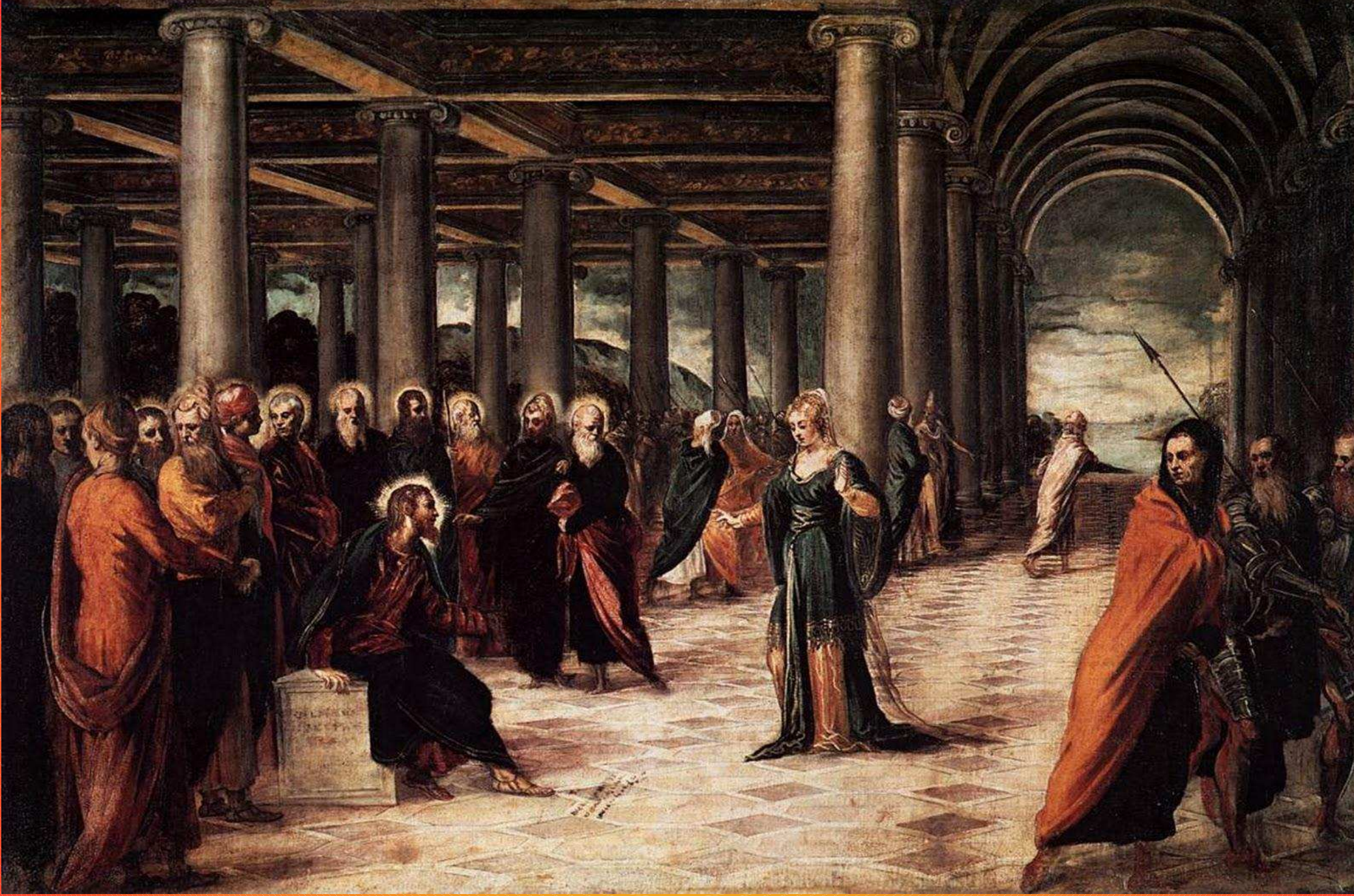
“Ο Χριστός και η μοιχαλίδα” : Τιντορέτο (1518-1594)