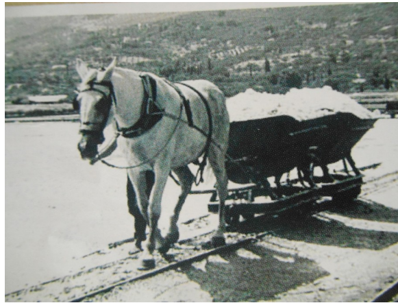
Πολύτιμος βοηθός για την μεταφορά του αλατιού

Η περιοχή των Αλυκών στην οποία χτίστηκε το γεφύρι ήταν ιδιαίτερα σημαντική τα παλιά χρόνια για την παραγωγή του αλατιού. Στα «τηγάνια» εργάζονταν οι κάτοικοι των γύρω χωριών λαμβάνοντας ένα σόλδιο για κάθε βατσέλι αλατιού που παρήγαγαν. Αγνοείται πότε και ποιοι επέβαλαν αυτή τη συμφωνία αλλά είναι γνωστό ότι οι εργάτες ως ανταμοιβή εξαιρούνταν από φόρους, αγγαρείες και στρατιωτικές υποχρεώσεις. Το 1783 οι Αλυκές παραχωρήθηκαν για 25 χρόνια στους άρχοντες Λογοθέτη και Μεσαλά με την υποχρέωση να πληρώνουν ετησίως στο δημόσιο ταμείο 1.142 τάλιρα.