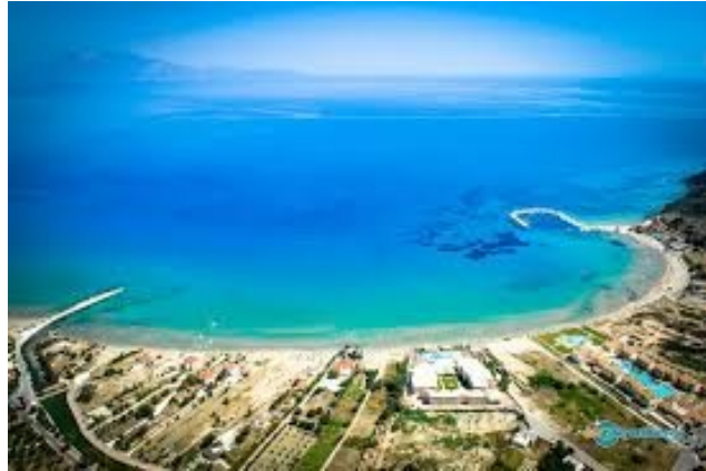
Η ΠΑΡΑΛΙΑ ΤΩΝ ΑΛΥΚΩΝ ΜΙΑ ΑΠΟ ΤΙΣ ΩΡΑΙΟΤΕΡΕΣ ΠΑΡΑΛΙΕΣ ΤΗΣ ΖΑΚΥΝΘΟΥ

Από τα παραπάνω στοιχεία βλέπουμε το λόγο ύπαρξης του γεφυριού αφού χτίστηκε σε μια περιοχή με σημαντική οικονομική και εμπορική αξία. Σήμερα το πεντακάμαρο αποτελεί στολίδι για την πανέμορφη παραλία των Αλυκών με τα κρυστάλλινα νερά και τη χρυσή άμμο.