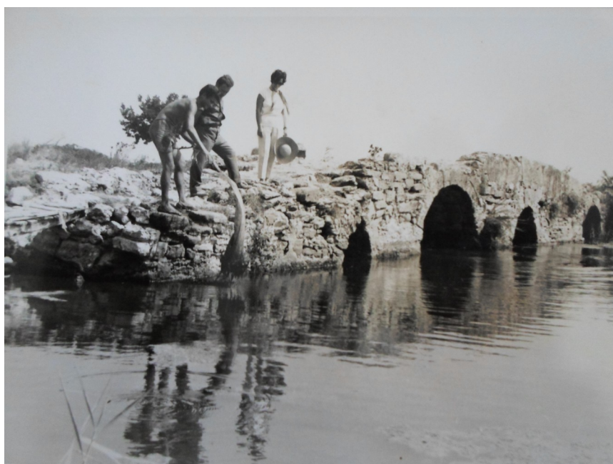
Το Πεντακάμαρο των Αλυκών πριν επισκευαστεί