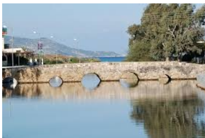
Το Πεντακάμαρο σήμερα