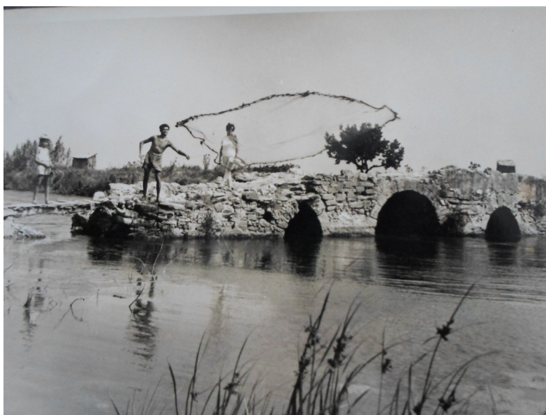
Πεταχτάρι από το Πεντακάμαρο των Αλυκών.