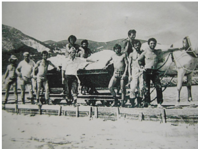
Εργάτες στα τηγάνια των Αλυκών