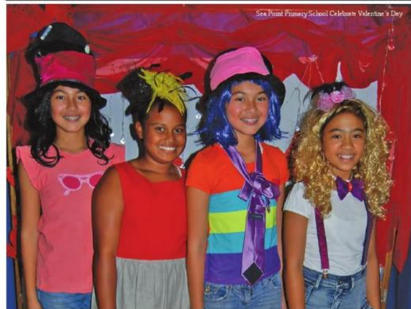
Sea Point Frimery School Celebrate Valentine's Day