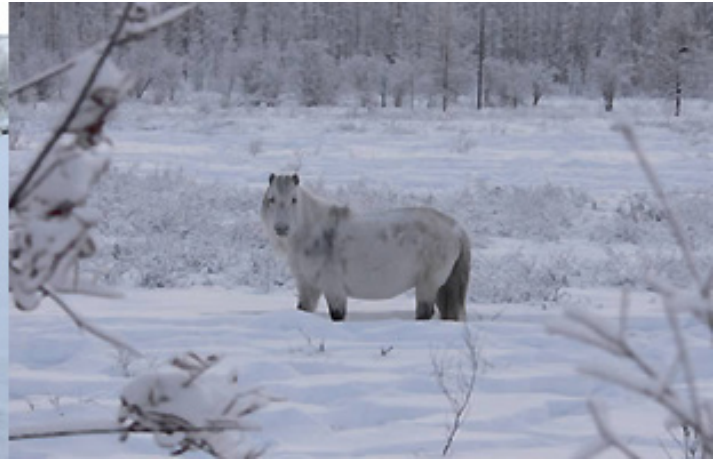
Το πιο κρύο κατοικημένο μέρος της Γης, Οϊμιάκον (Ρωσία) Χαμηλότερη θερμοκρασία: - 71,2^{\circ}\text{C}