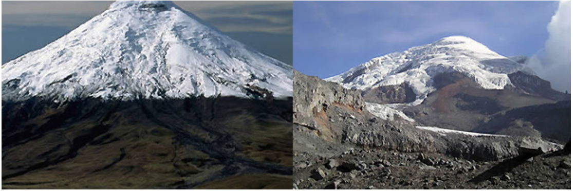
Το πιο απομακρυσμένο μέρος από το κέντρο της Γης Βουνό Τσιμποράσο (Εκουαδόρ) Ύψος: 6.310 μέτρα πάνω από το επίπεδο της θάλασσας