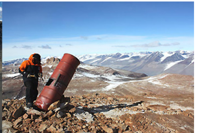
Το πιο ξηρό μέρος του κόσμου Ξηρές Λίμνες Μακ Μάρντο (Ανταρκτική)