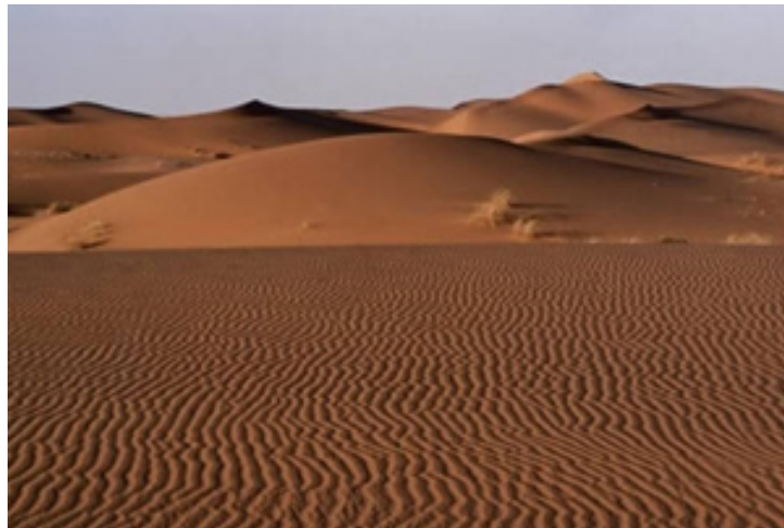
Το πιο θερμό μέρος του πλανήτη Έρημος Λουτ (Ιράν) Μεγαλύτερη θερμοκρασία: 71 °C