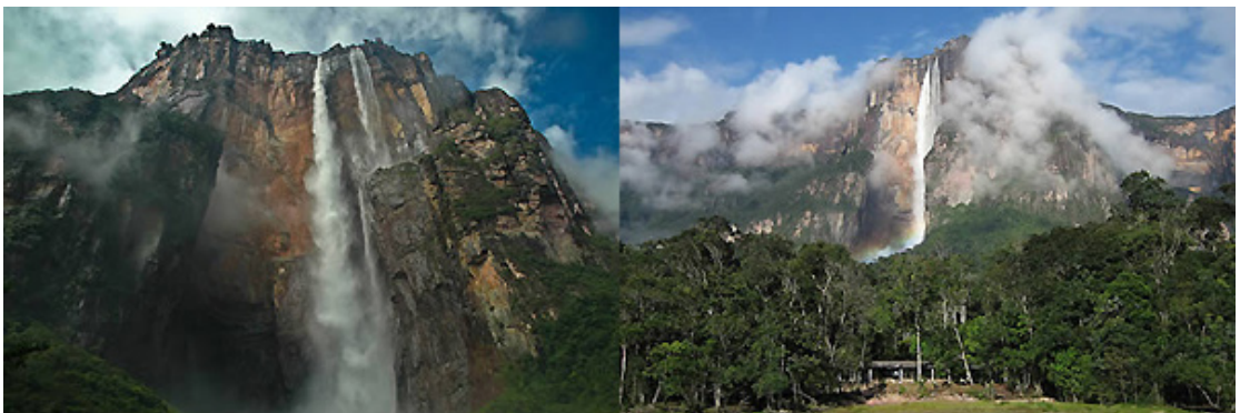
Ο ψηλότερος καταρράκτης της Γης Σάλτο Άνχελ (Βενεζουέλα) Ύψος: 984 μέτρα