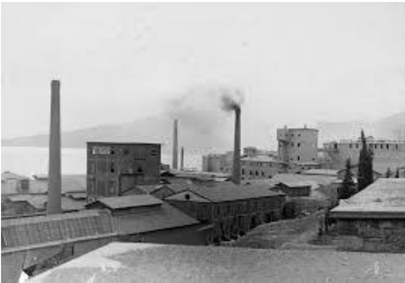
Η ρύπανση της ατμόσφαιρας στην Ελευσίνα