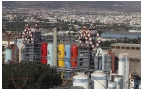
Βιομηχανίες και εργοτάξια