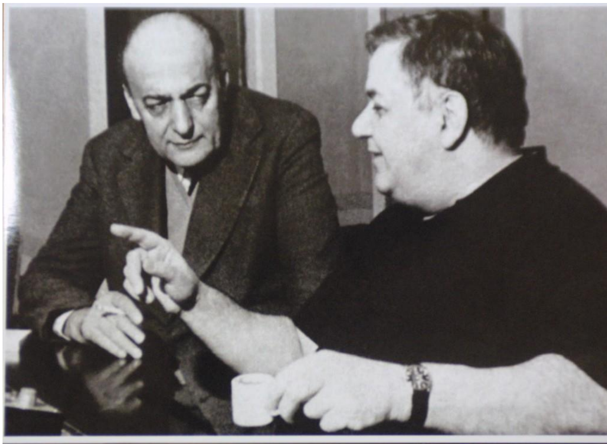
Ο Γιάννης Ρίτσος με τον Μάνο Χατζηδάκι

Η αλλαγή αυτή που συνέβη στην Ελευσίνα προβλημάτισε πολύ δυο καλλιτέχνες, τον ποιητή Γιάννη Ρίτσο και την συνθέτη Μάνο Χατζηδάκι που θέλησαν να μας ευαισθητοποιήσουν για την περιβαλλοντική καταστροφή που υπέστη η περιοχή μέσα από την τέχνη τους. Ο ένας λοιπόν έγραψε το παραπάνω ποίημα και ο άλλος το μελοποίησε, το έκανε δηλαδή τραγούδι. Αυτό έγινε το 1976.