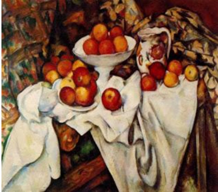
“Μήλα και πορτοκάλια” το 1899

Ο Γάλλος ζωγράφος Πολ Σεζάν (Paul Cezanne), 19 Ιανουαρίου 1839 – 22 Οκτωβρίου 1906 , ζωγράφισε τους πίνακες: