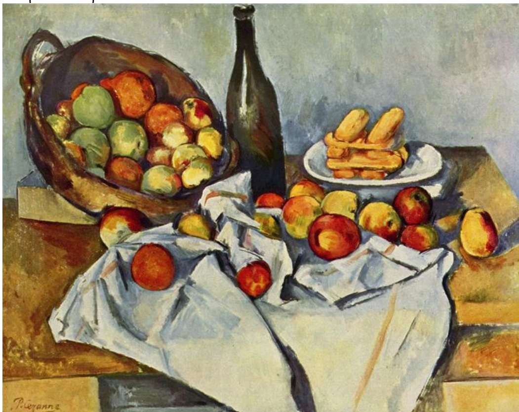
“καλάθι με μήλα”, 1895