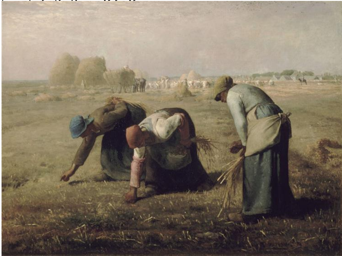
Ζαν – Φρανσουά Μιλλέ 'οι σταχτομαζώχτρες' 1854, λάδι σε καμβά

Ο Γάλλος ζωγράφος Ζαν – Φρανσουά Μιλλέ (1814 - 1875) ζωγράφιζε θέματα με σκηνές της αγροτικής ζωής .