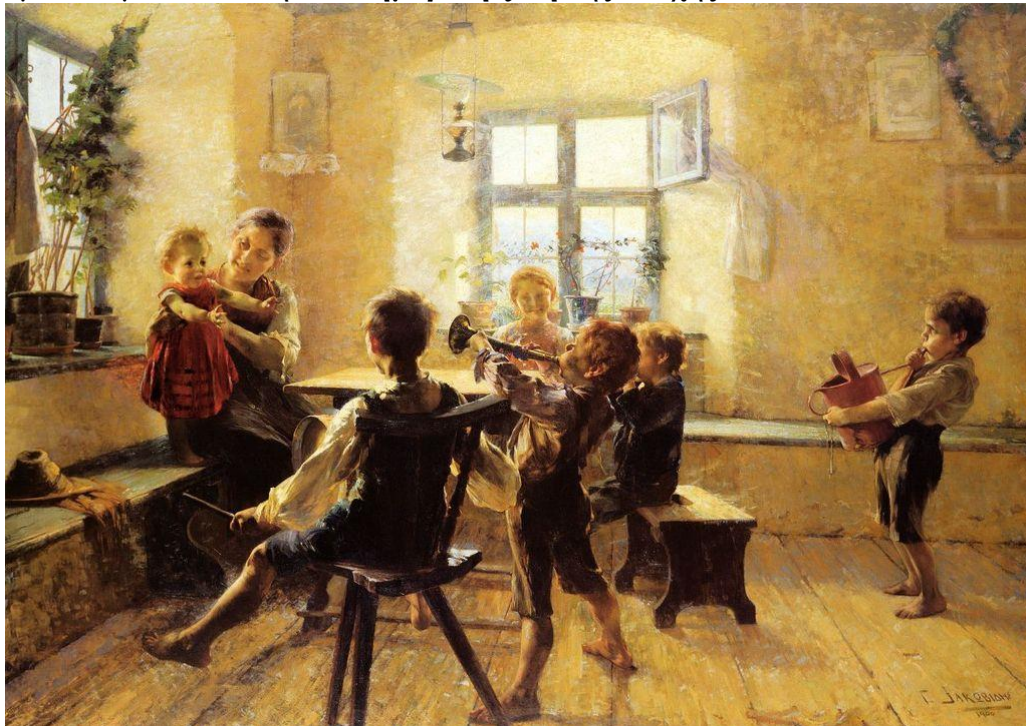
Παιδική συναυλία, 1900, λάδι σε μουσαμά

Ο ζωγράφος Γεώργιος Ιακωβίδης (1853-1932) δημιούργησε έργα με θέματα εμπνευσμένα από την καθημερινή ζωή της εποχής του.