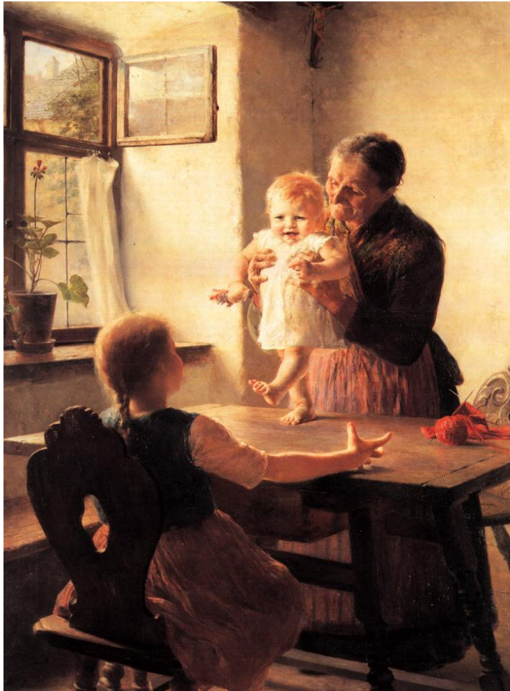
πρώτα βήματα, 1893