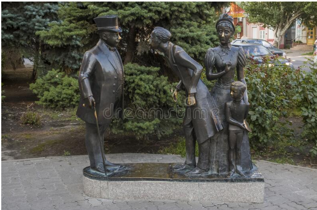
Το άγαλμα του Παχύ και του Αδύνατου στο Taganrog της Ρωσίας