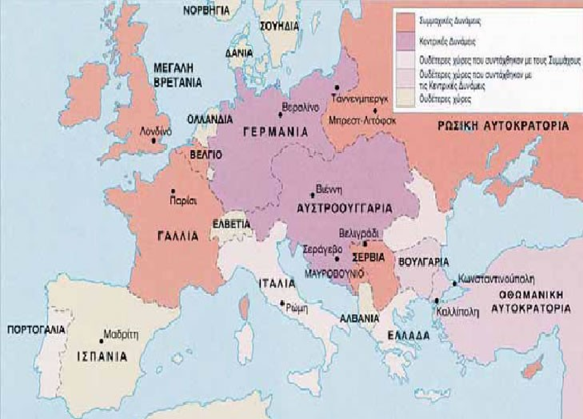
ΤΑ ΑΝΤΙΠΑΛΑ ΣΤΡΑΤΟΠΕΔΑ ΤΟΥ Α΄ ΠΑΓΚΟΣΜΙΟΥ ΠΟΛΕΜΟΥ 1914