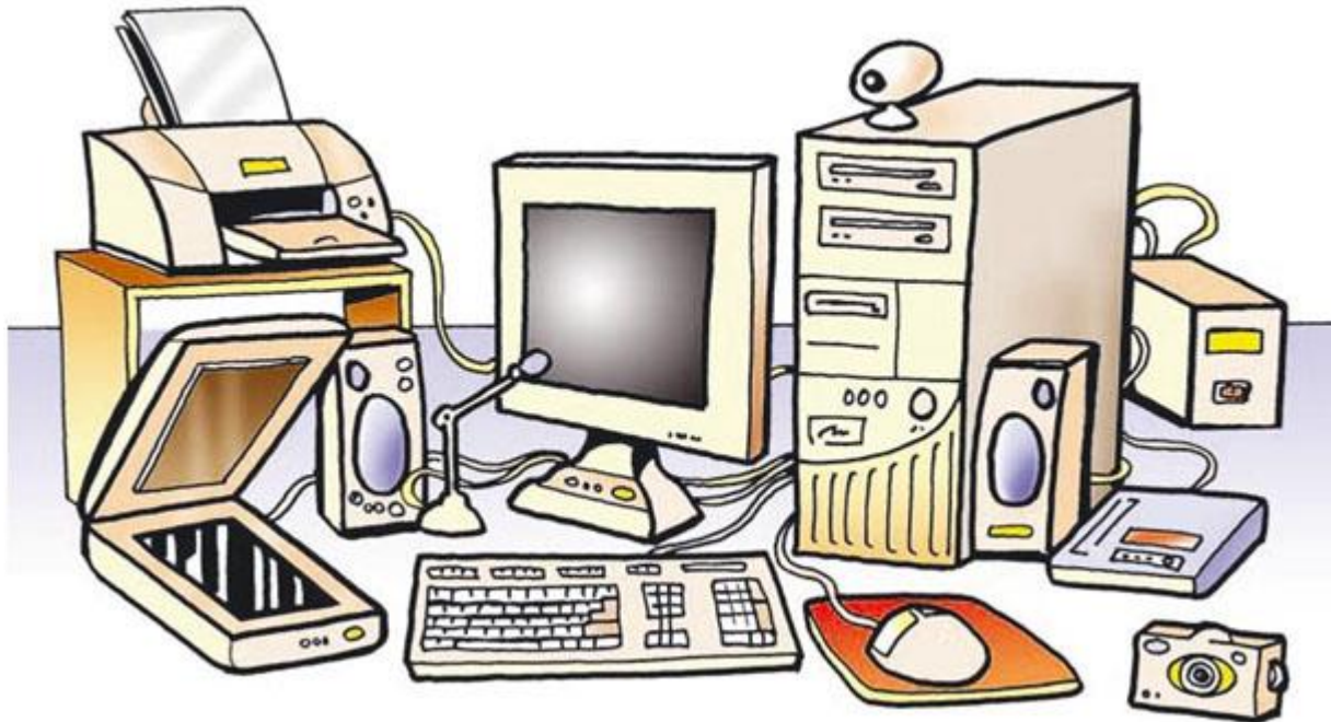
Το Υλικό Μέρος ενός υπολογιστικού συστήματος