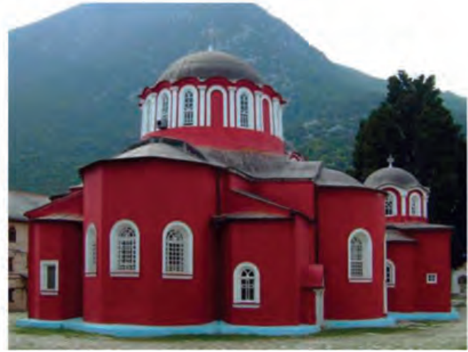
Ι. Μ. Μεγίστης Λαύρας, Άγιο Όρος (βυζαντινός)