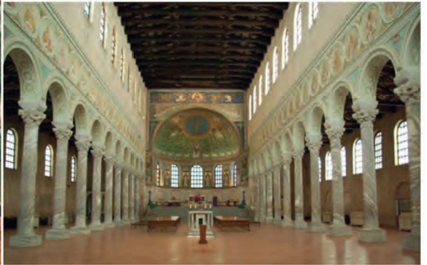
Αχειροποίητος, Θεσσαλονίκη και Άγιος Απολλινάριος, Ραβέννα Ιταλία