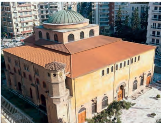
Αγ. Σοφία, Θεσσαλονίκη (βασιλική με τρούλο)

Από τον 6ο αιώνα οι επινοήθηκε ένας νέου τύπου ναός, η βασιλική με θόλο – τρούλο με λαμπρό παράδειγμα το ναό της Αγίας Σοφίας στην Κωνσταντινούπολη. Ο ναός της Αγίας Σοφίας στην Κωνσταντινούπολη, που χτίστηκε επί Ιουστινιανού, είναι ο πρώτος ναός αυτού του ρυθμού. Στη μέση του ναού (με ρυθμό βασιλικής) υπάρχει ένας μεγάλος τρούλος που στηρίζεται πάνω σε κολόνες (κίονες).