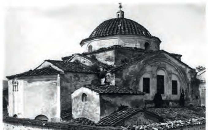
Κοίμηση Θεοτόκου, Νίκαια Βιθυνίας (βασιλική με τρούλο)