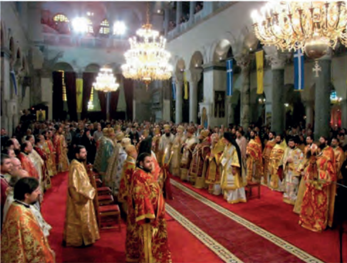
Άγιος Δημήτριος , Θεσσαλονίκη