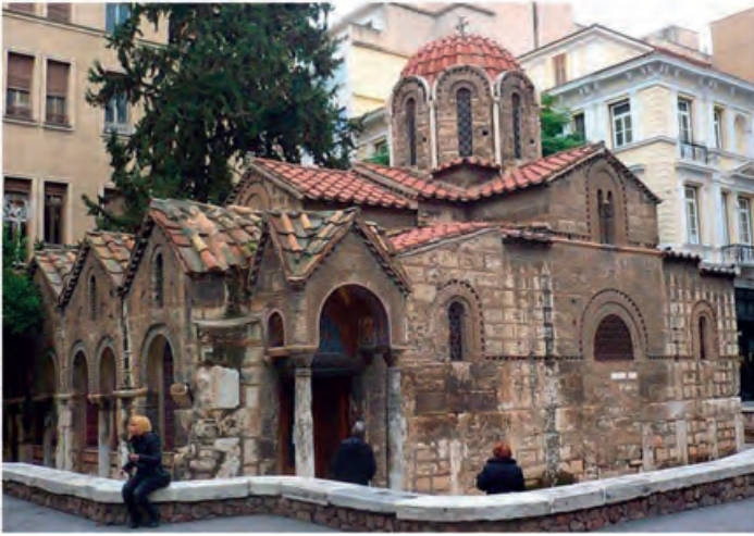
Παναγία Καπνικαρέα, Αθήνα (βυζαντινός)

Σήμερα οι ναοί χτίζονται με πρότυπο τους διάφορους βυζαντινούς τύπους.