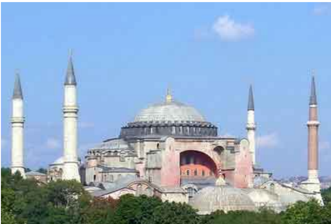
Ναός της Αγίας Σοφίας στην Κωνσταντινούπολη (βασιλική με τρούλο)