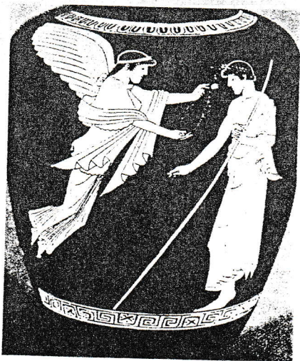
Οινοχόη· Νίκη καί νέος

Ανατύπωση από Βιβλ. Θρησκ. της εποχής 1980