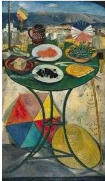
1 - ΤΟ ΤΡΑΠΕΖΙ ΤΗΣ ΚΑΘΑΡΑΣ ΔΕΥΤΕΡΑΣ