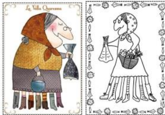
4 - στο ένα χέρι ψάρι βακαλάο και στο άλλο καλάθι με φρούτα και λαχανικά ...