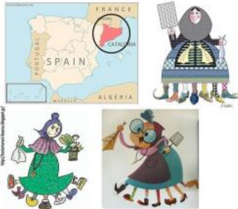
Επιστικό υλικό για τη Vella Quaresma (την κυρά-Σαρακοστή της Καταλονίας)