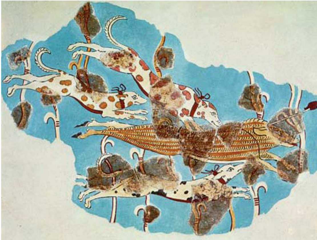
Τοιχογραφία με σκηνή κυνηγιού.