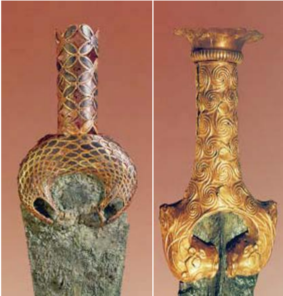
Λαβές από ξίφη στολισμένες με χρυσό.