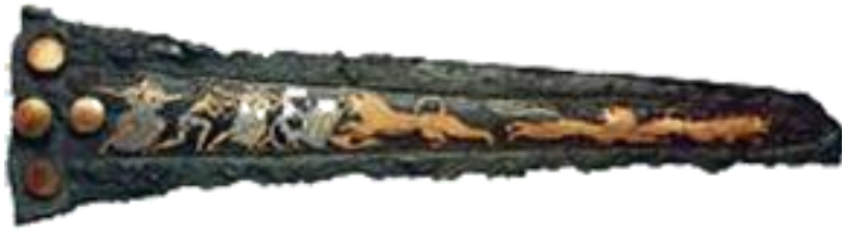
Μικρό μαχαίρι με σκηνή κυνηγιού.