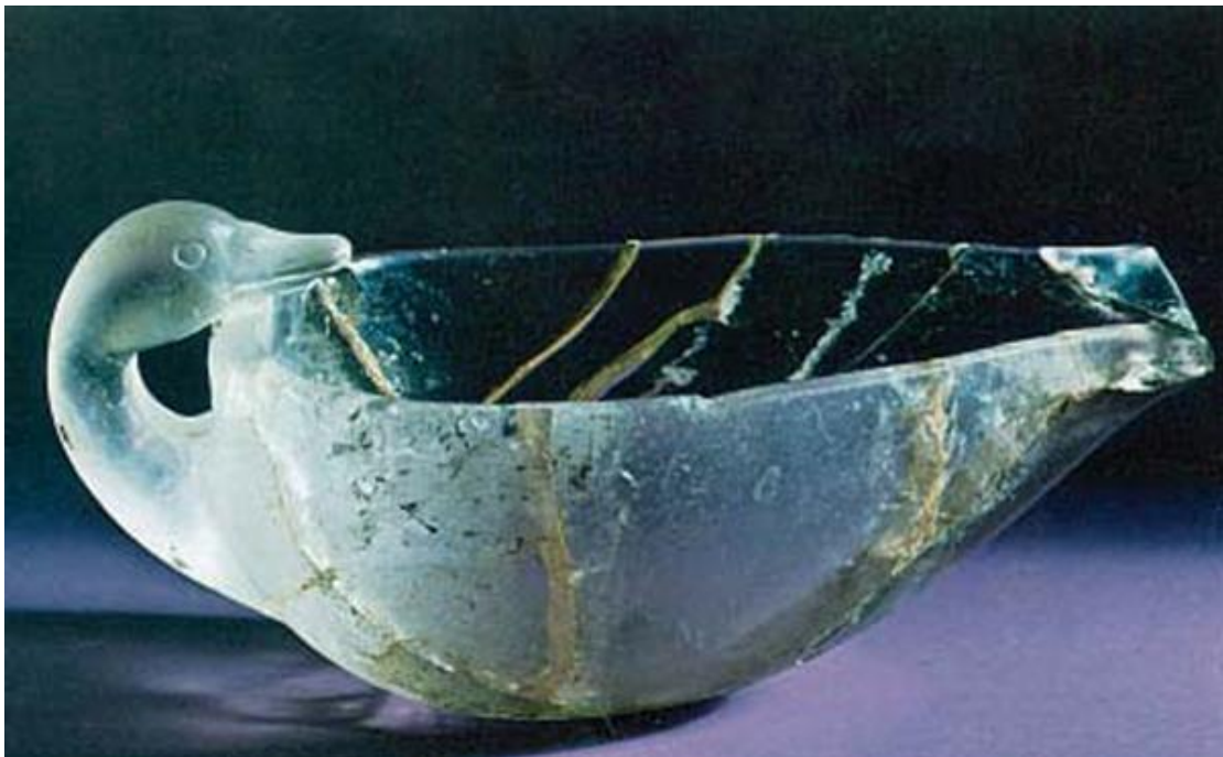
Αγγείο από κρύσταλλο που έχει τη μορφή πάπιας.