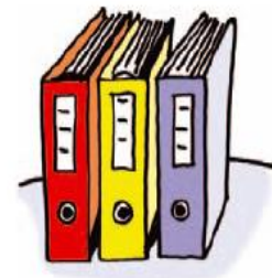
Τα ντοσιέ ενός γραφείου

Όπως στο σπίτι μας τακτοποιούμε τα χαρτιά μας σε κατηγορίες και τα τοποθετούμε σε φακέλους και ντοσιέ, έτσι ταξινομούμε και τα αρχεία μας στον σκληρό δίσκο του Η/Υ. Χωρίζουμε το σκληρό δίσκο σε νοητές περιοχές για να τοποθετήσουμε τα αρχεία μας ταξινομημένα σε κατηγορίες. Οι ξεχωριστές περιοχές που δημιουργούμε στο σκληρό δίσκο του Η/Υ, με σκοπό να διατηρήσουμε τα αρχεία μας τακτοποιημένα, ονομάζονται φάκελοι . Αυτοί εμφανίζονται από τα windows ως εικονίδια με κίτρινο χρώμα και σχήμα καρτέλας. Ένας φάκελος μπορεί να περιέχει όχι μόνο αρχεία αλλά και άλλους φακέλους