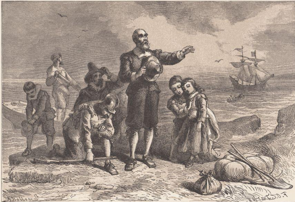
Landung der Pilger-Väter.

καλαμπόκι και άλλα σιτηρά, να ψαρεύουν, και να αποφεύγουν τα δηλητηριώδη φυτά εκείνης της γης.