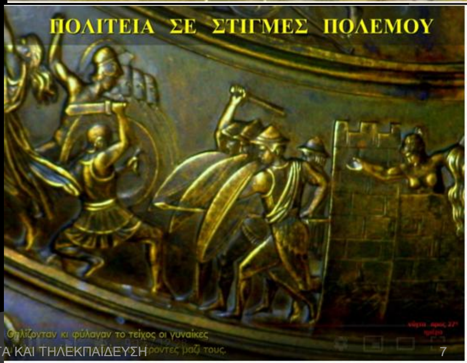
νότα προς 27 η ημέρα

Οπλίζονταν κι φύλαγαν το τείχος οι γυναίκες ρόντες μαζί τους