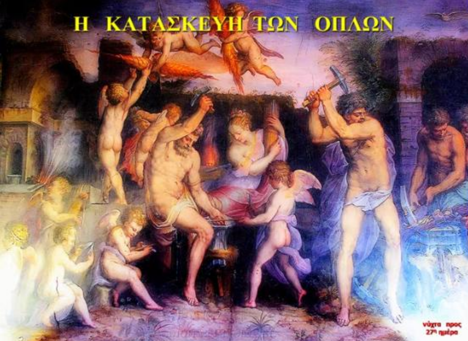
νότα προς 27 η ημέρα