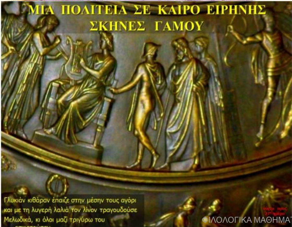
νότα προς 27 η ημέρα