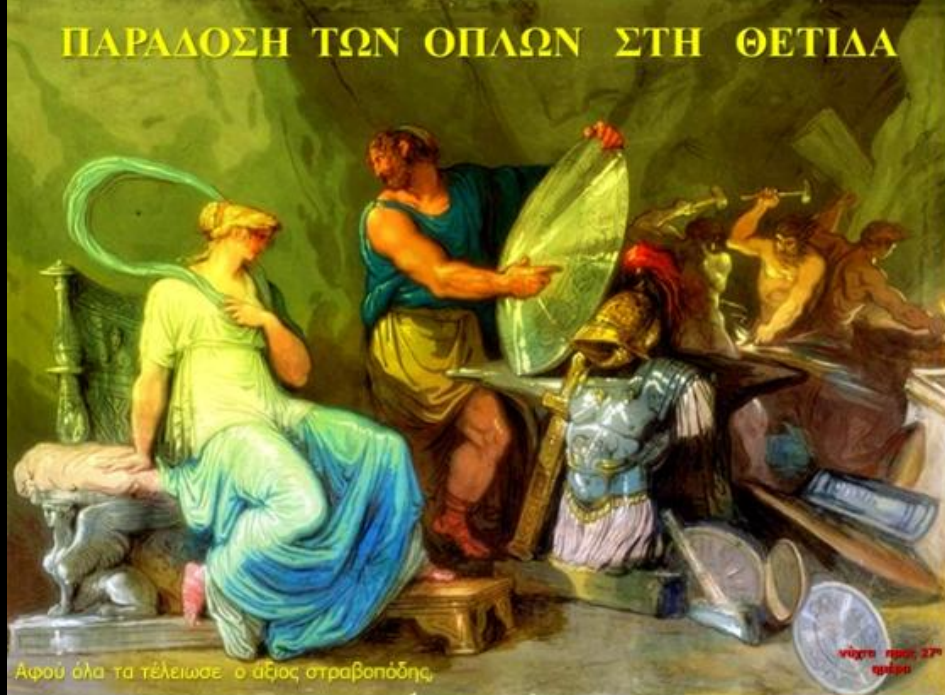
Αφού όλα τα τέλειωσε ο αξιος στραβοπόδης