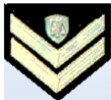
Υπαρχιφύλακας (Ανακριτικός Υπάλληλος)