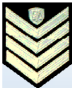
Αρχιφύλακας (Ανακριτικός Υπάλληλος - Με εξετάσεις)