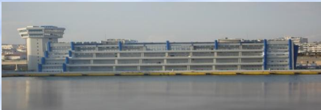
Το κτίριο του Αρχηγείου Λ.Σ.- ΕΛ.ΑΚΤ. στον Πειραιά