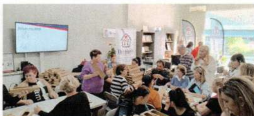
Πασχαλινές λαμπάδες για τα παιδιά του Βενιαμίν