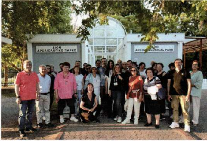
Ξεναγήση στο Μουσείο του Δίου και στο Αρχαιολογικό Πάρκο