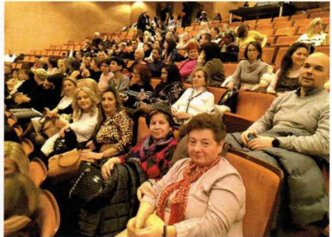
Το ΣΔΕ πάει θέατρο στη Μονή Λαζαριστών