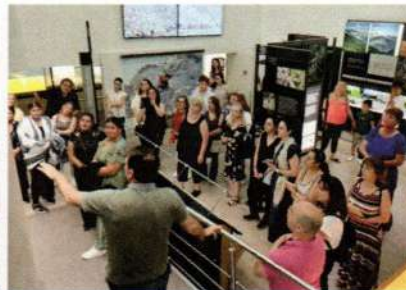
Κέντρο Πληροφόρησης Εθνικού Δρυμού Ολύμπου