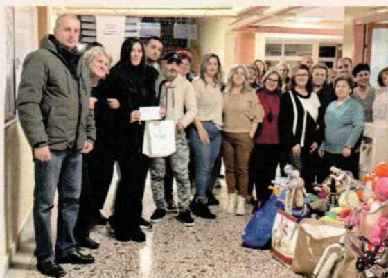
Συλλογή παιδικών παιχνιδιών για τον Βενιαμίν

Ο ΒΕΝΙΑΜΙΝ είναι ένας ανεξάρτητος φιλανθρωπικός φορέας, Νομικό Πρόσωπο Ιδιωτικού Δικαίου, με έδρα την Κατερίνη. Τα ιδρυτικά του μέλη είναι άτομα που ανατράφηκαν στο Ορφανοτροφείο Κατερίνης τη δεκαετία του 1950 -1960 και τα οποία σήμερα συμπαραστέκονται σε παιδιά που βρίσκονται σε ανάγκη ή κίνδυνο σε 20 πόλεις στην Ελλάδα, προσφέροντας εδώ και 30 χρόνια ωφέλεια σε παιδιά με τις οικογένειές τους και έχοντας στηρίξει πάνω από 1600 παιδιά από το 1994 μέχρι