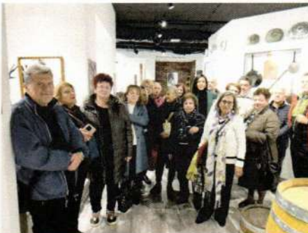
Το ΣΔΕ στη Μουσειακή Έκθεση Παραδοσιακών Επαγγελμάτων