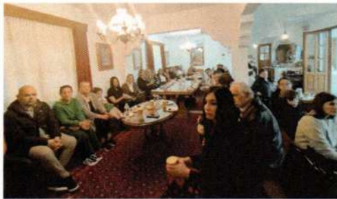
Εκκλησιασμός στην Ι.Μ. Παναγίας Μακρυράχης