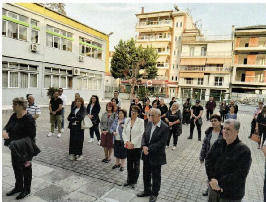
Αγισμός σχολικού έτους 2023-2024

Τα Σχολεία Δεύτερης Ευκαιρίας παρέχουν τη δυνατότητα σε ενήλικες, 18 ετών και άνω , που δεν έχουν ολοκληρώσει την εννιάχρονη υποχρεωτική εκπαίδευση, να συνεχίσουν τις σπουδές τους και να αποκτήσουν τίτλο ισότιμο με το απολυτήριο του Γυμνασίου .