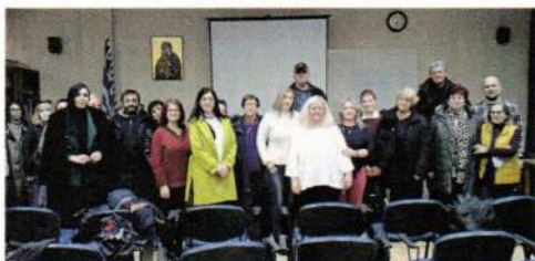
Ενημέρωση απο το Κέντρο Συμβουλευτικής Υποστήριξης Γυναικών