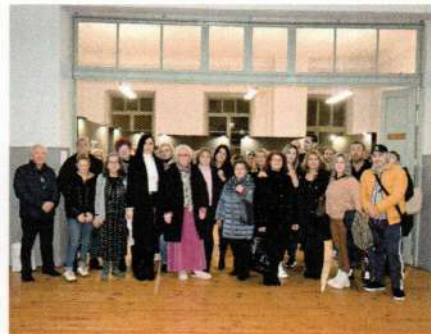
Έκθεση Φωτογραφίας στην Αστική Σχολή