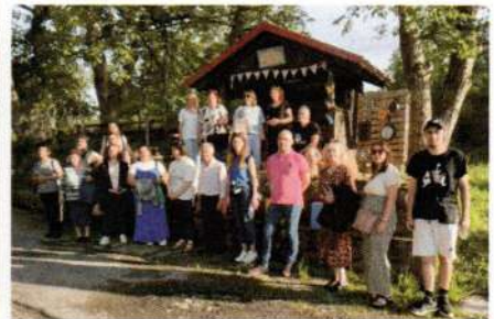
Περιήγηση στην Άνω Μηλιά