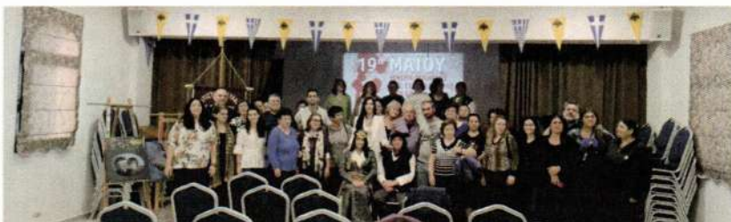
Επίσκεψη στον Πολιτιστικό Σύλλογο Σ. Σταθμού Κατερίνης