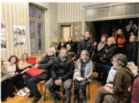
Ενάγηση στο Κέντρο Τεχνών Εννέα Μούσες