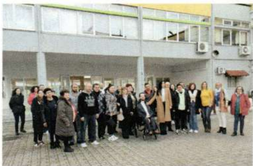
Ο Ευρωβουλευτής Στέλιος Κυμπουρόπουλος στο Σχολείο μας

Οι εκπαιδευτικές δραστηριότητες ως αναπόσπαστο τμήμα της εκπαιδευτικής διαδικασίας αποτελούν έκφραση της εξωστρέφειας του σχολείου ενηλίκων και επιδιώκουν το «άνοιγμα» του σχολείου στην κοινωνία προάγοντας την ευρύτερη κοινωνικοποίηση, καθώς και την ελεύθερη έκφραση των εκπαιδευομένων μας. Κατά τη διάρκεια της σχολικής χρονιάς 2023-24 διοργανώθηκαν ποικίλες ομιλίες ενημερωτικού χαρακτήρα σε συνεργασία με διάφορους τοπικούς φορείς, πραγματοποιήθηκαν πολλές εκπαιδευτικές επισκέψεις σε πολιτιστικούς ή επαγγελματικούς χώρους και προσκλήθηκαν στο σχολείο σημαίνοντα πρόσωπα με στόχο την ενημέρωση και ευαισθητοποίηση της σχολικής κοινότητας για φλέγοντα κοινωνικά ζητήματα.