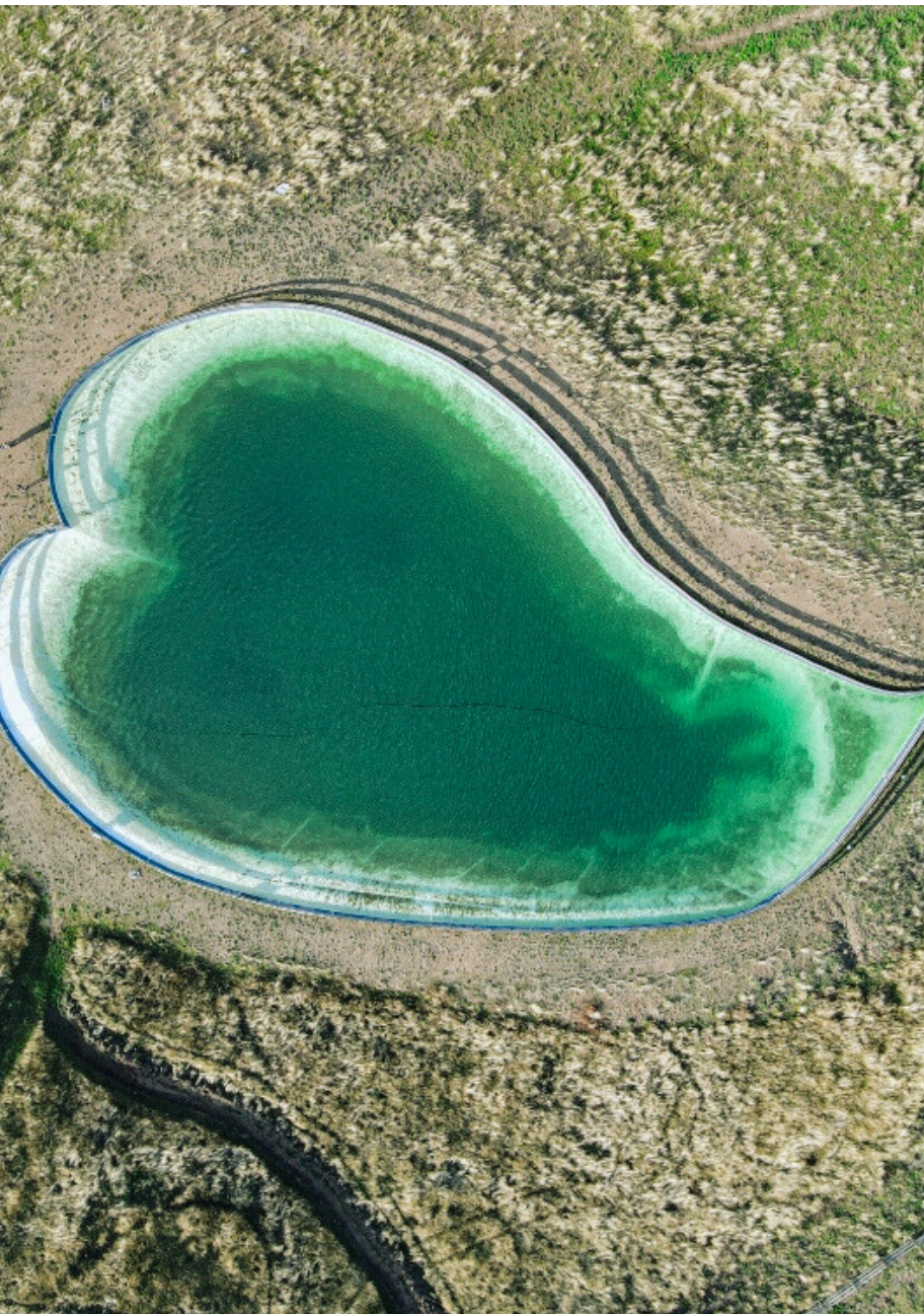
Η ΛΙΜΝΗ ΚΑΡΔΙΑ ΤΟΥ ΑΝΗΛΙΟΥ