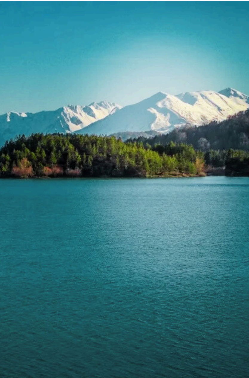
ΤΕΧΝΗΤΗ ΛΙΜΝΗ ΑΩΟΥ- ΥΔΡΟΗΛΕΚΤΡΙΚΟΣ ΣΤΑΘΜΟΣ ΔΕΗ