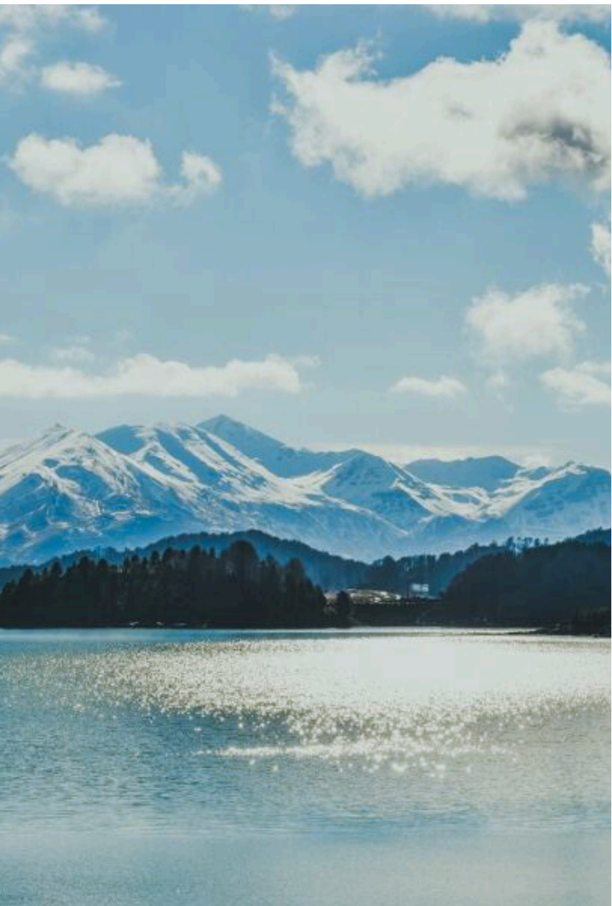
ΤΕΧΝΗΤΗ ΛΙΜΝΗ ΑΩΟΥ