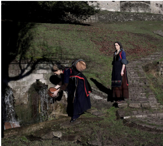
ΟΙ ΒΡΥΣΕΣ ΤΟΥ ΜΕΤΣΟΒΟΥ