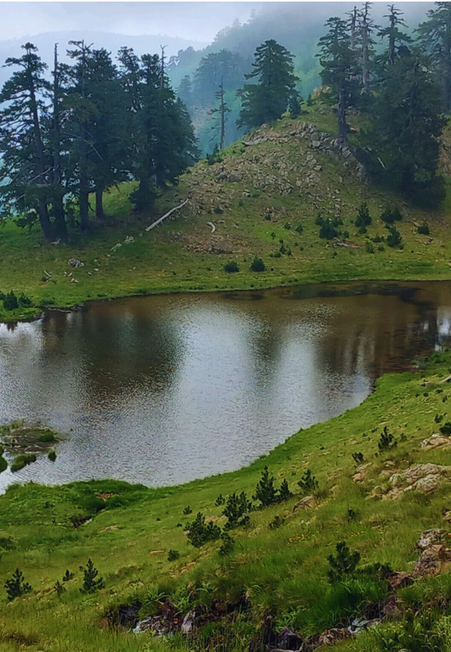
ΑΛΠΙΚΕΣ ΛΙΜΝΕΣ ΦΛΕΓΓΑ