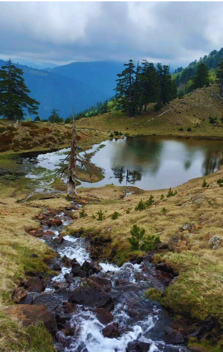
ΜΑΥΡΟΒΟΥΝΙ - ΚΟΡΥΦΗ ΦΛΕΓΓΑ