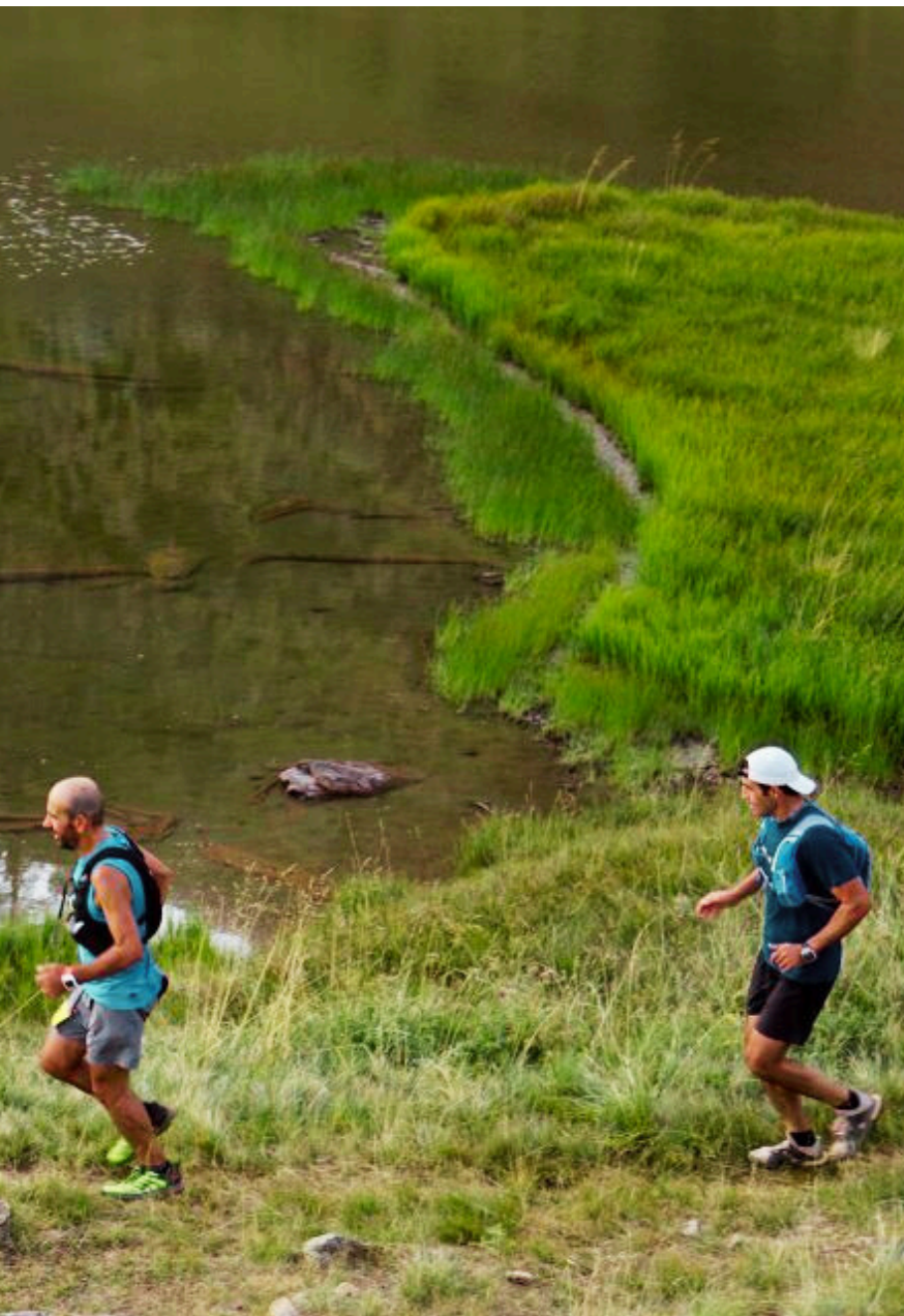
URSA TRAIL ΤΟ ΜΟΝΟΠΑΤΙ ΤΗΣ ΑΡΚΟΥΔΑΣ