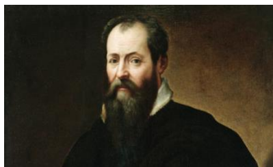
Μιχαήλ Άγγελος Μπουοναρότι, Καπρέτσε 1475- Ρώμη 1564