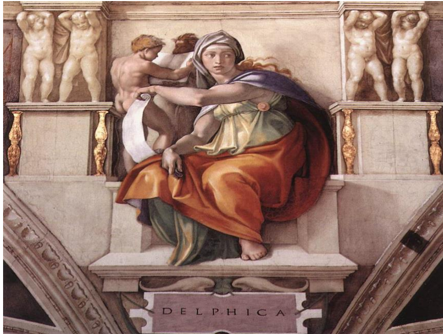
Τοιχογραφία της Δελφικής Σίβυλλας, που συμβολίζει τον αρχαίο ελληνικό πολιτισμό...