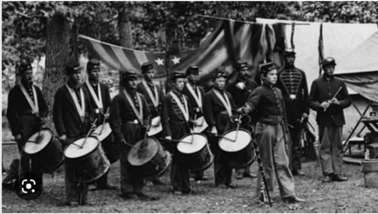
τυμπανιστές - (αμερικάνικος εμφύλιος)