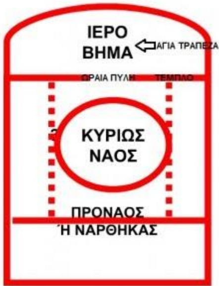
Τα τρία μέρη του ναού του ρυθμού της βασιλικής.

Το μέρος όπου συγκεντρώνονται οι πιστοί, δηλαδή ο κυρίως ναός, έχει σχήμα ορθογώνιο και χωρίζεται κατά μήκος σε κλίτη με παράλληλες σειρές από κίονες. Το μεσαίο κλίτος είναι διπλάσιο σε πλάτος από τα πλαϊνά κλίτη. Ανάλογα με τον αριθμό των κλιτών υπάρχουν τρίκλιτες, πεντάκλιτες, επτάκλιτες και εννιάκλιτες βασιλικές. Στον κυρίως ναό στο μεσαίο κλίτος υπάρχει και ο άμβωνας ένα ψηλό λίθινο κατασκεύασμα όπου ανέβαιναν οι αναγνώστες, οι πρεσβύτεροι και οι επίσκοποι για να ψάλουν και να κηρύξουν. Πάνω από τα πλαϊνά κλίτη υπάρχουν υπερώα που χρησιμοποιούνταν ως γυναικωνίτες. Οι βασιλικές αυτές έμειναν γνωστές ως ξυλόστεγες βασιλικές λόγω της ξύλινης στέγης τους. Οι κίονες που χωρίζουν τα κλίτη καταλήγουν σε κιονόκρανα κορινθιακά, ενώ ενώνονται μεταξύ τους με τόξα. Οι τοίχοι εσωτερικά στα χαμηλά σημεία καλυπτόταν με μάρμαρο ενώ στα πιο ψηλά σημεία υπήρχαν ψηφιδωτά και τοιχογραφίες. Το δάπεδο ήταν επίσης διακοσμημένο με ψηφιδωτά.