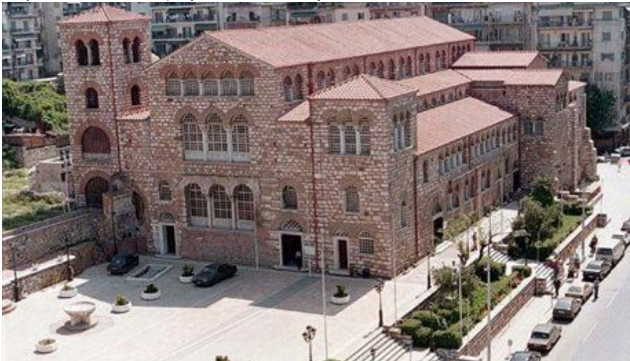
Θεσσαλονίκη: Βασιλική Αγίου Δημητρίου