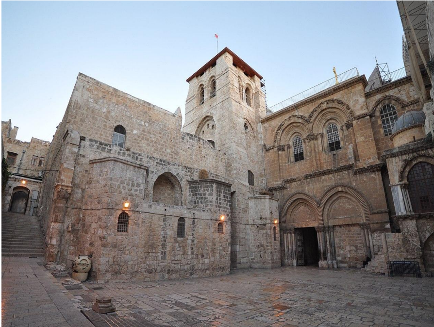
Ο ναός της Αναστάσεως στα Ιεροσόλυμα

Μετά το διάταγμα της ανεξιθρησκίας το 313μ.Χ. και το τέλος των διωγμών, δόθηκε η δυνατότητα στους χριστιανούς να προχωρήσουν στην ανέγερση νέων μεγάλων εκκλησιών σε όλη την αυτοκρατορία. Ο αρχιτεκτονικός τύπος των χριστιανικών ναών που κυριάρχησε τον 4 ο και 5 ο αιώνα έμεινε γνωστός ως «παλαιοχριστιανική βασιλική». Σημαντική στην ανέγερση ναών τόσο στην Κωνσταντινούπολη όσο και σε άλλες περιοχές θα είναι η συμβολή της Αγίας Ελένης μητέρας του αυτοκράτορα Κωνσταντίνου. Χαρακτηριστικό παράδειγμα αποτελούν ο ναός της Γεννήσεως στη Βηθλεέμ και της Αναστάσεως στην Ιερουσαλήμ.