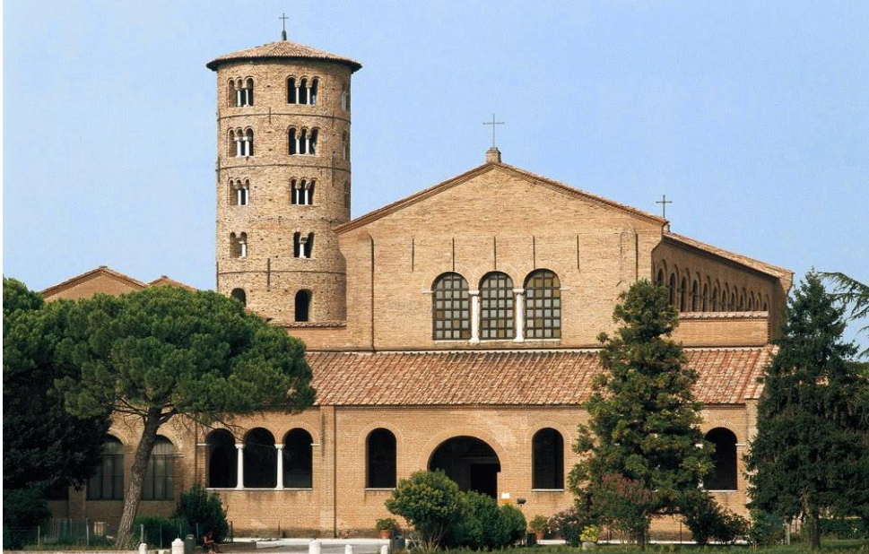
Ραβέννα: Βασιλική Αγίου Απολλιναρίου

Γνωστοί ναοί στο ρυθμό της βασιλικής εκτός από τους δύο που προαναφέρθηκαν είναι ο ναός του Αγίου Απολλιναρίου στη Ραβέννα και του Αγίου Δημητρίου στη Θεσσαλονίκη.