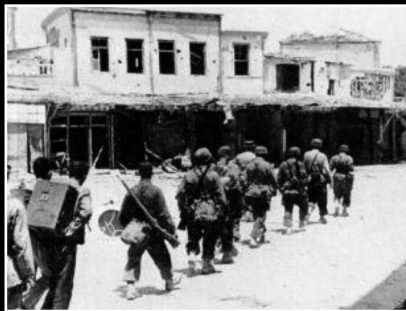
Ο γερμανικός στρατός στους έρημους δρόμους της πόλης του Ηρακλείου. Η καταστροφή είναι εμφανής. Στ' αριστερά, οι δύο πολίτες που μεταφέρουν πράγματα είναι προφανώς αιχμάλωτοι κάτοικοι