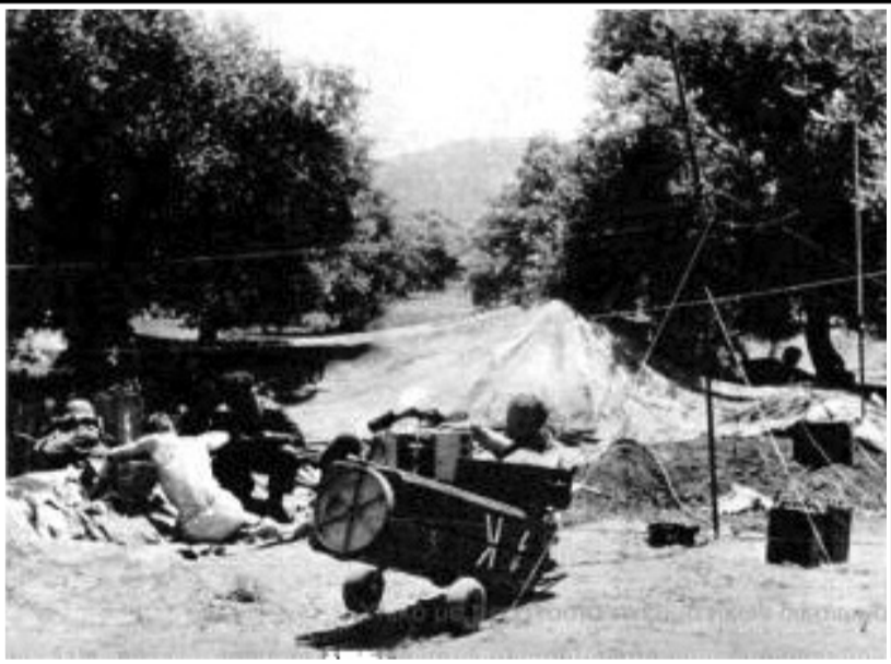
Σταθμός ασυρμάτου που έστησαν οι Γερμανοί αλεξιπτωτιστές σε λιόφυτο