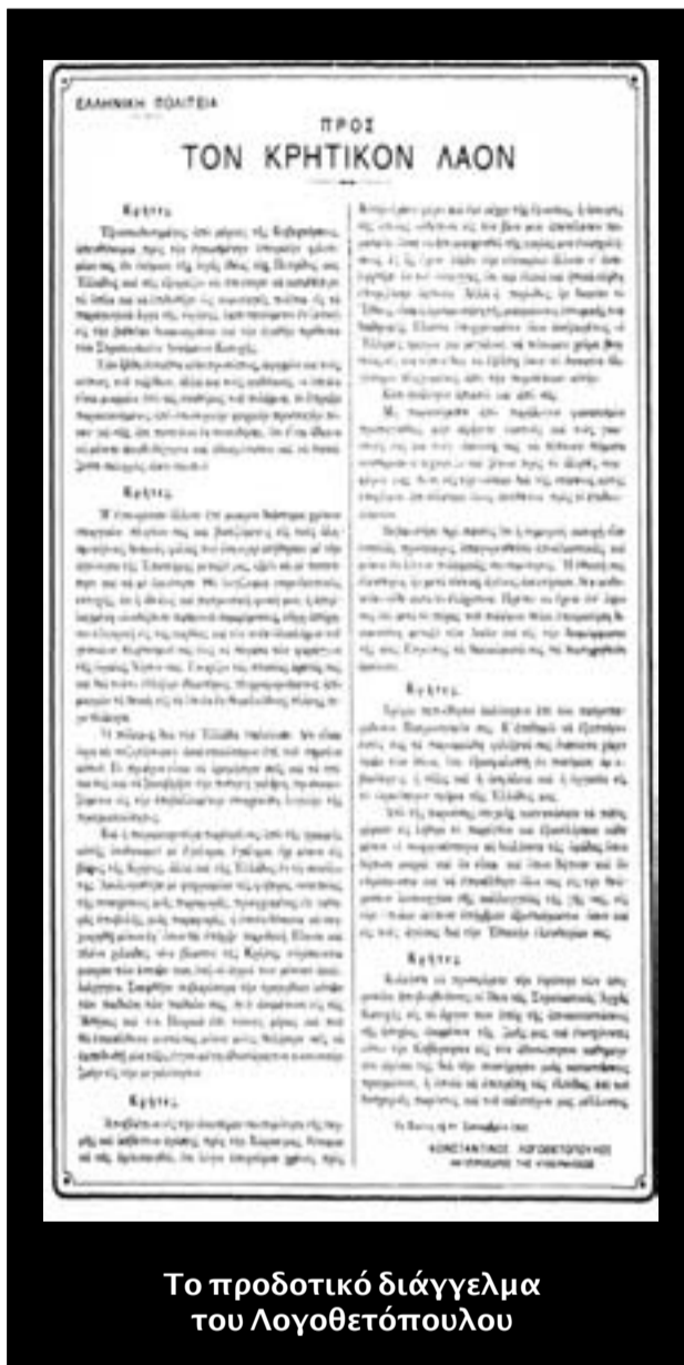
Το προδοτικό διάγγελμα του Λογοθετόπουλου

Ο πόλεμος δια την Ελλάδα ετελείωσε. Δεν είναι ώρα να συζητήσωμεν αναλυτικώτερον επί του σημείου αυτού. Το προέχον είναι να ηρεμήσητε σεις και τα σπίτια σας και να ξαναβρή-