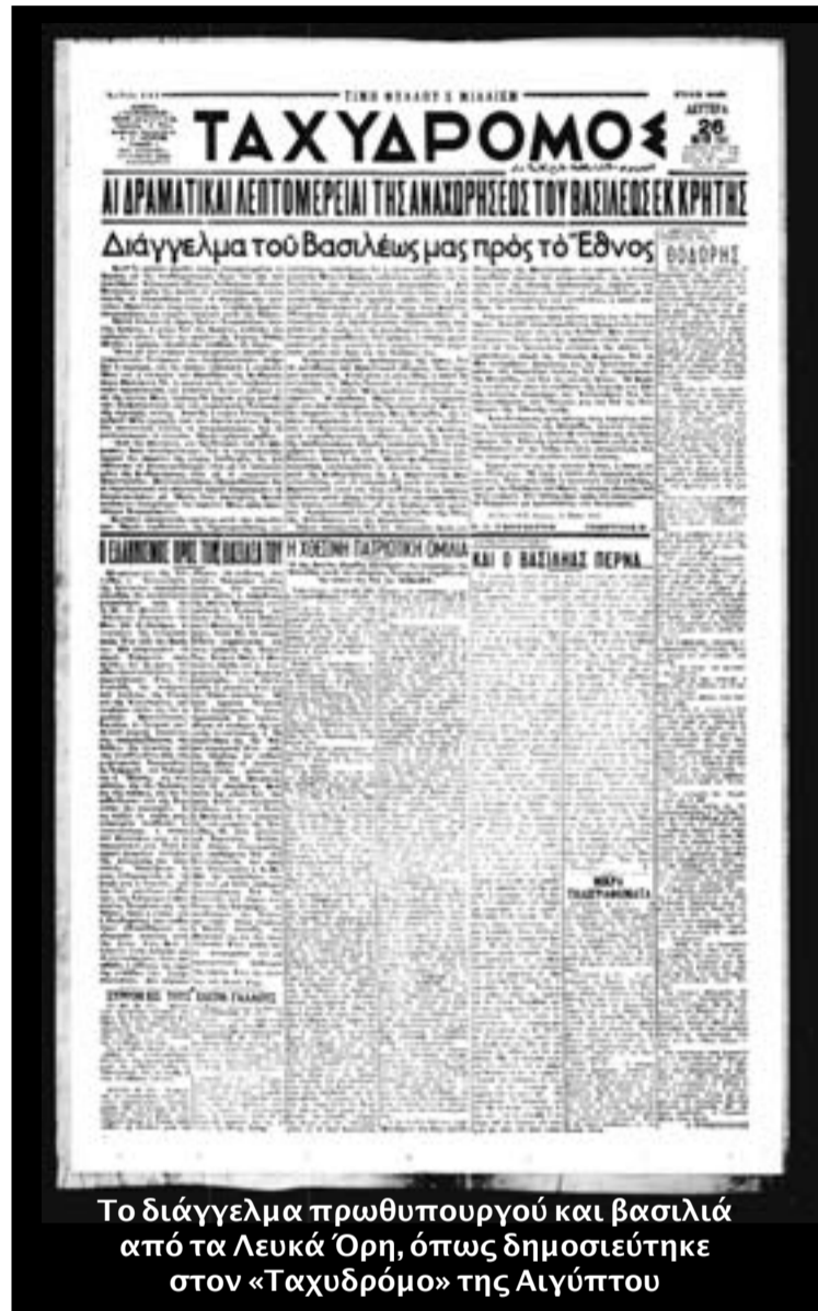
Το διάγγελμα πρωθυπουργού και βασιλιά από τα Λευκά Όρη, όπως δημοσιεύτηκε στον «Ταχυδρόμο» της Αιγύπτου

Από την Παναγιά και βραδύτερον από το Θέρισσον, όπου εσταθμεύσαμεν, δια να παρακολουθήσωμεν την πορείαν της μάχης απεδείχθη, ότι ήτο αδύνατον να επικοινωνήσωμεν ούτε με τα υπόλοιπα μέλη της Κυβερνήσεως, ούτε με το συμμαχικόν Στρατηγείον. Μεταγενεστέρως εξηκριβώσαμε ότι αι στρατιωτικά και πολιτικά αρχάι επιχείρησαν να επικοινωνήσουν με Ημάς άνευ επιτυχίας. Κατά συνέπειαν συνεχίσαμεν την πορείαν Μας προς ορεινότερα διαμερίσματα. Κατόπιν προσεκτικής ερεύνης μετά των υπευθύνων Ημών συμβούλων, της δημιουργηθείσης