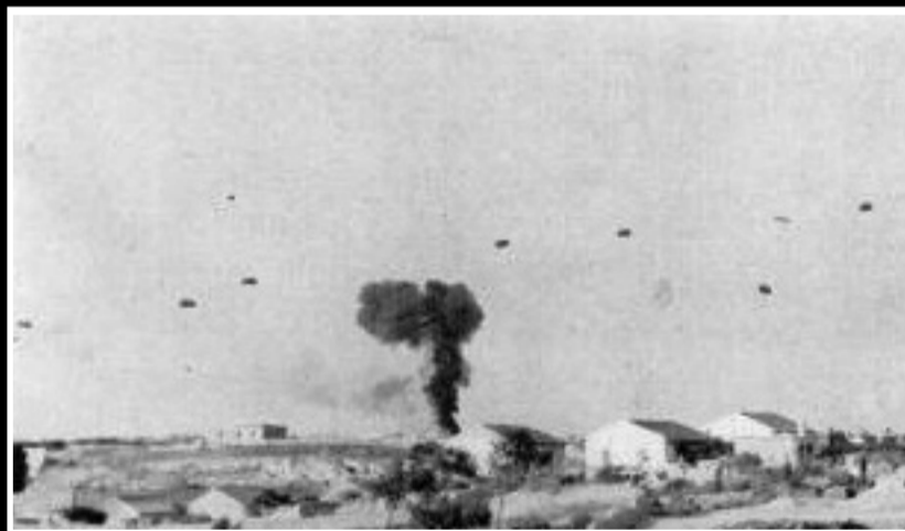
Η φωτογραφία αυτή είναι η συνέχεια της παραπάνω. Το γερμανικό μεταγωγικό έχει συντριβεί, προκαλώντας έκρηξη. Στον ορίζοντα αλεξιπτωτιστές συνεχίζουν να κάνουν πτώσεις στο Ηράκλειο