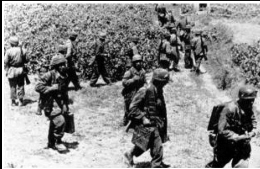
Λίγο έξω από το Ηράκλειο, Γερμανοί στρατιώτες προφανώς κάνουν ανίχνευση της περιοχής. Ο στρατιώτης δεξιά μεταφέρει στην πλάτη του κιβώτιο με βλήματα των 81 mm

Κατά τα μεσάνυχτα το σώμα περιπολίας του Υποσμηναγού W. μάς πλησιάζει από την άλλη μεριά την πόλη. Έδωσαν σκληρές μάχες και είχαν επίσης απώλειες. Τα γωνιακά σπίτια ήταν ακόμα κατειλημμένα από τον εχθρό και έτσι οι άντρες του Υποσμηναγού W. δεν μπορούσαν να μας πλησιάσουν από τους δρόμους. Λένε ότι ήρθαν μέσα από τους τοίχους των σπιτιών ή διασχίζοντας ταράτσες. Χρειάζεται δυο μέρες για να πάρουμε όλη της πόλη. Χάνουμε τον υποδεκανέα μας - που έπεσε με μια σφαίρα στο κεφάλι. Την τρίτη μέρα ξεκουραζόμαστε.