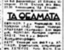
Αυτό μου φαίνεται αόρατο.

Η Μάχη της Κρήτης μέσσω από τον ελεγχόμενο κατοχικό τύπο