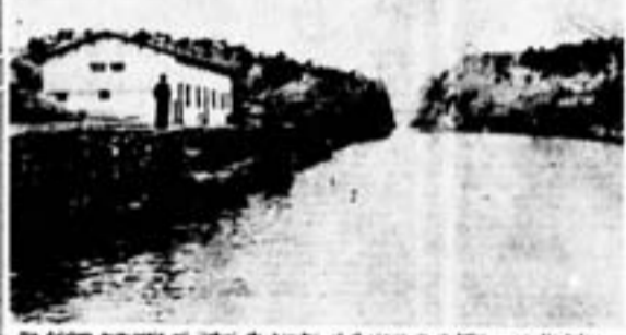
Η ΚΟΡΙΝΘΟΣ ΣΑΝΑΒΡΙΣΚΕΙ ΤΟΝ ΡΥΘΜΟ ΤΗΣ ΜΙΑ ΕΙΚΟΝΑ ΤΗΣ ΣΗΜΕΡΙΝΗΣ ΤΗΣ ΖΩΗΣ

Η Μάχη της Κρήτης μέσω από τον ελεγχόμενο κατοχικό τύπο