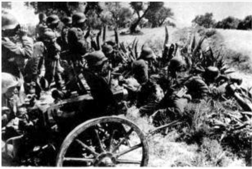
Ομάδα Γερμανών στρατιωτών, με ελαφρού τύπου κανόνια που μετέφεραν τα μεταγωγικά, ετοιμάζεται για μάχη, κάπου στην Κρήτη