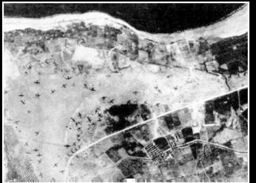
Το αεροδρόμιο του Μάλεμε, σε εικόνα που καταγράφηκε από γερμανικό βομβαρδιστικό την πρώτη ημέρα της επίθεσης