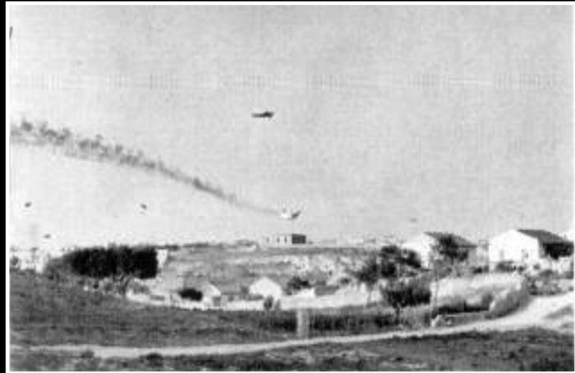
Γερμανικό μεταγωγικό πέφτει φλεγόμενο, μετά τα αντιαεροπορικά πυρά των Βρετανών, καθώς πετούσε πάνω από το Ηράκλειο.

Ξεκινάει. Το τίναγμα στα πόδια, το σκίσιμο στους ώμους και στα πόδια. Κατεβαίνουμε σχεδόν ταυτόχρονα. Τη στιγμή που πηγαίνουμε από