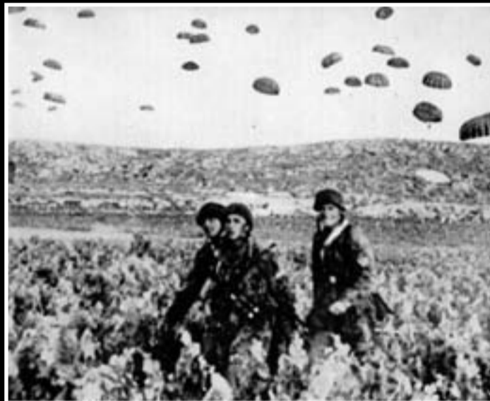
HOW WE TOOK CRETE One of the first German paratroopers to bail out gives eyewitness account of twelve-day invasion